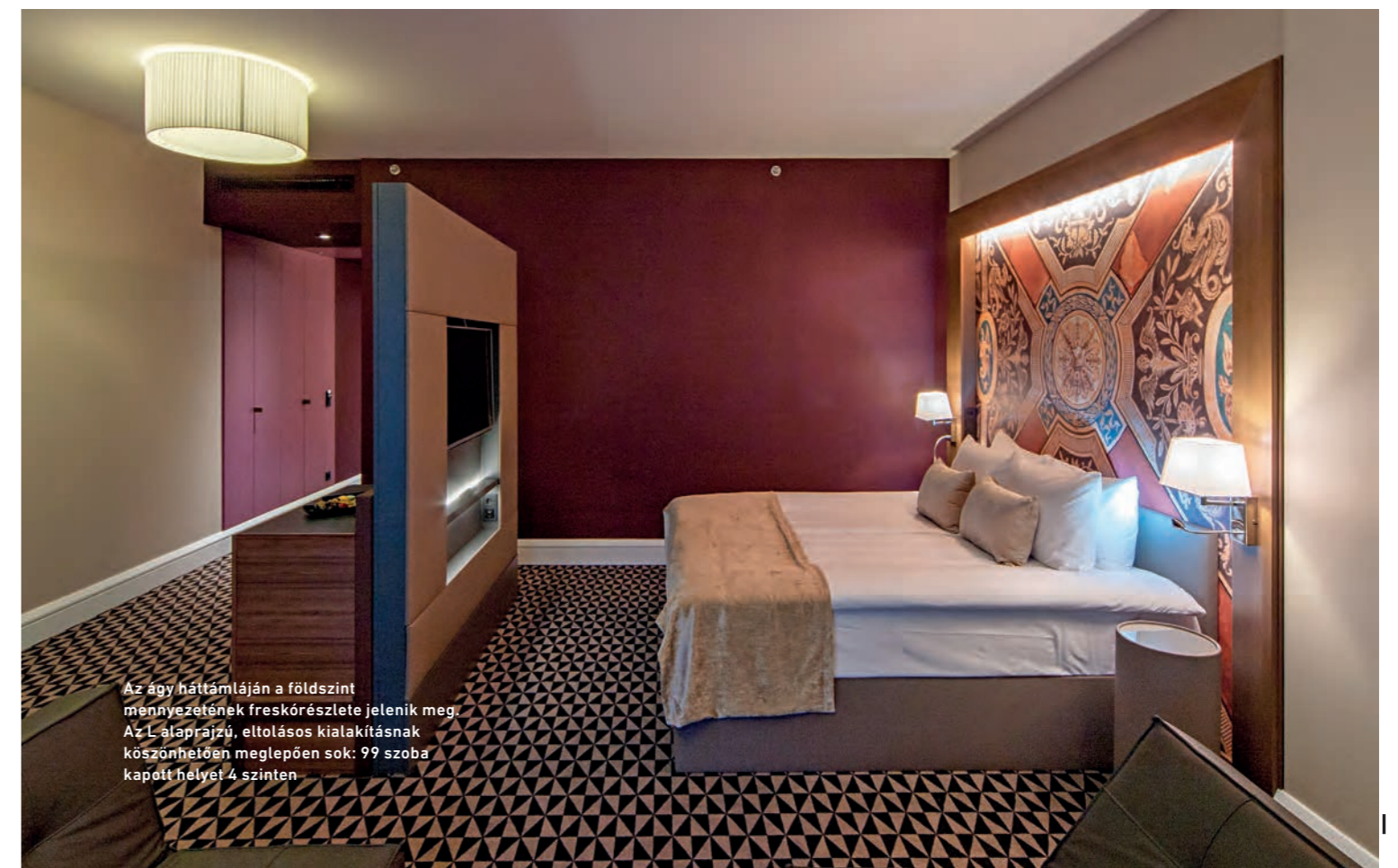
Az ágy háttámláján a földszint mennyezetének freskórészlete jelenik meg. Az L-alaprajzú, eltolásos kialakításnak köszönhetően meglepően sok: 99 szoba kapott helyet 4 szinten.

A Nyitra környékéről származó, tudományokban jártas Schossberger Lázár és fia, a később a Pesti Izraelita Hitközség elnökévé válasz-