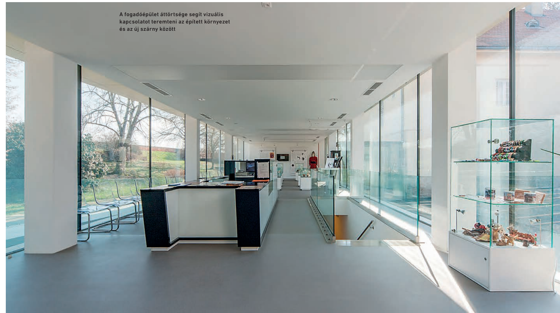
A fogadóépület áttörtsége segít vizuális kapcsolatot teremteni az épített környezet és az új szárny között