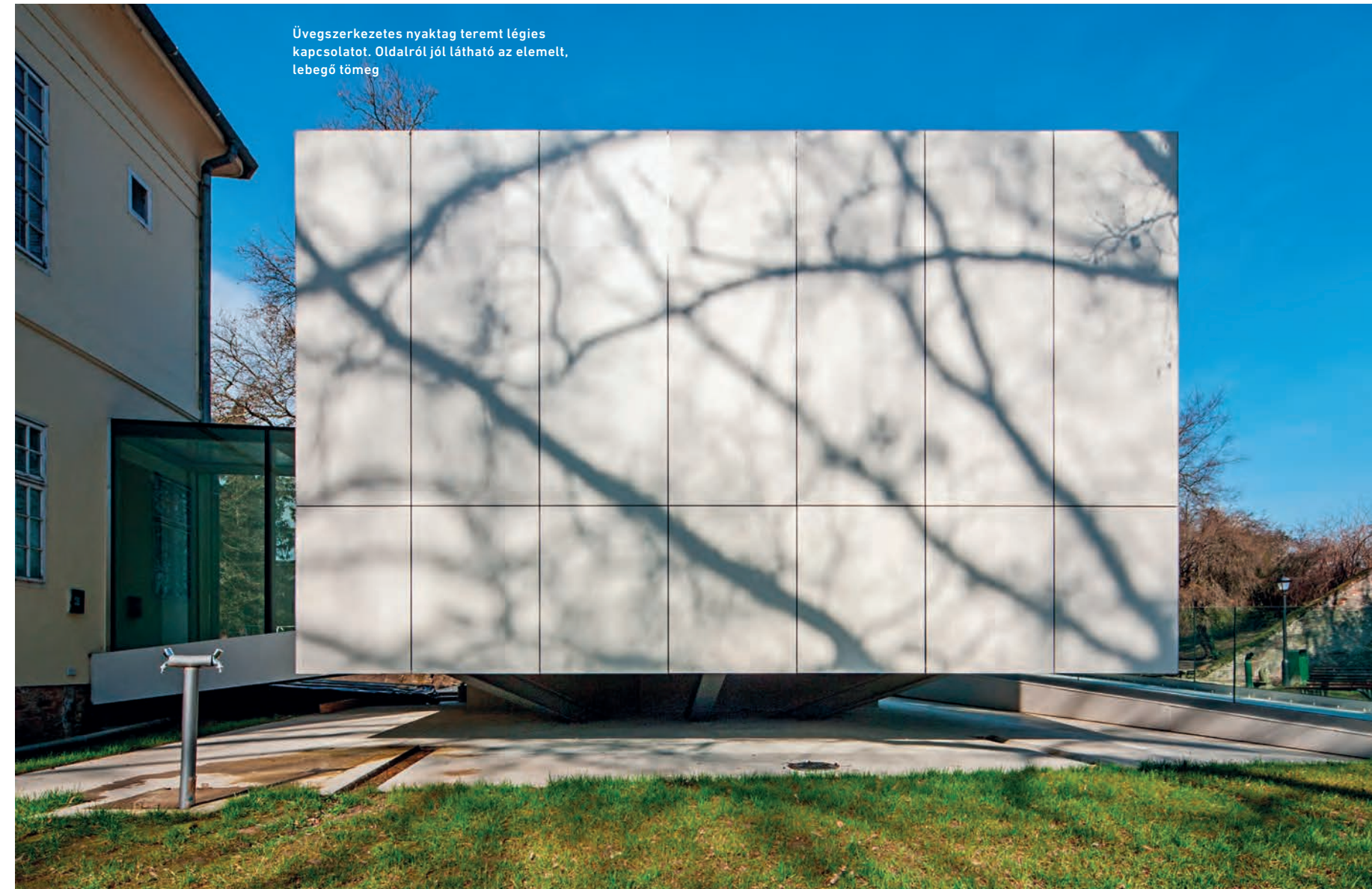
Üvegszerkezetes nyaktag teremt légies kapcsolatot. Oldalról jól látható az elemelt, lebegő tömeg