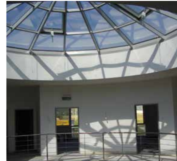
Egyedi elképzeléseit segítünk megvalósítani. Kérje ajánlatunkat és tanácsainkat!

Tervezéskor és kivitelezéskor az egészen egyedi elképzeléseknek továbbá a magas minőségnek és nem utolsósorban a kiváló ár-érték aránynak megfelelő nyílászárókat kiválasztani nem könnyű feladat. A sokoldalúságnak köszönhetően az igen jól variálható alumínium nyílászárók magas minőségi színvonalat képviselnek és mind az ipari létesítmények, mind pedig az irodaházak és családi házak, nyaralók tervezésekor ideális építési módszer. A jövő részben a költséghatékony, rugalmas és hosszú távú valamint a kifinomult műszaki megoldások egyszerre történő alkalmazásában rejlik.