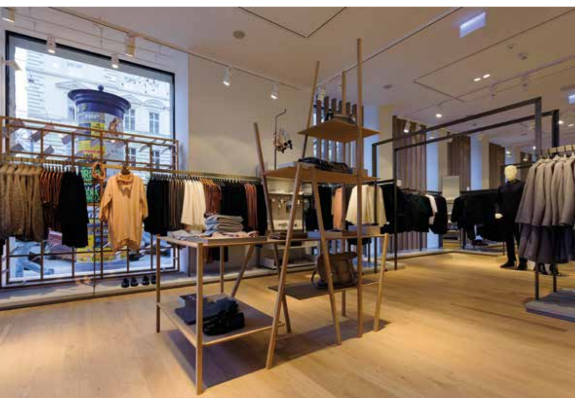
Rajzos, szabadon álló bemutatóállvány

Szöveg MOLNÁR SZILVIA Építészet SÁNDOR GERGELY H&M projektmenedzser SZABÓ ZSOLT SÁNDOR enerálkivitelező FITOUT ZRT.