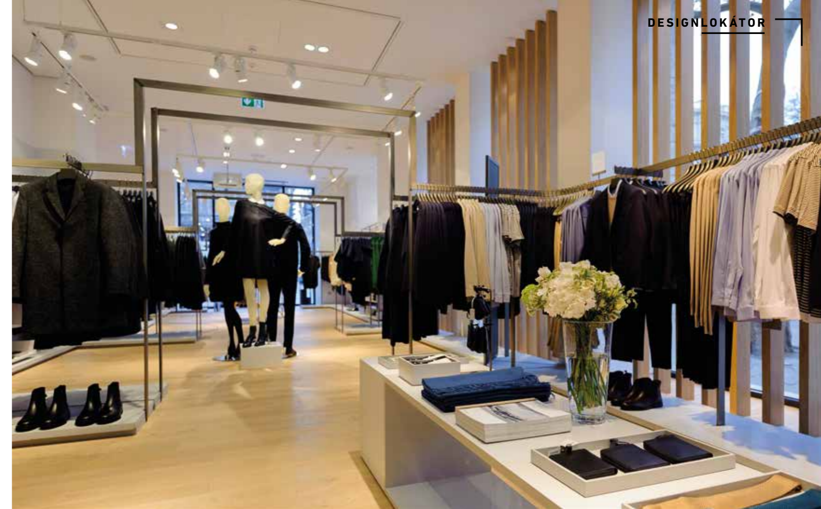
Az üzlet terét „berajzoló” sztender-rendszer a középtengelyben kapukat alkot