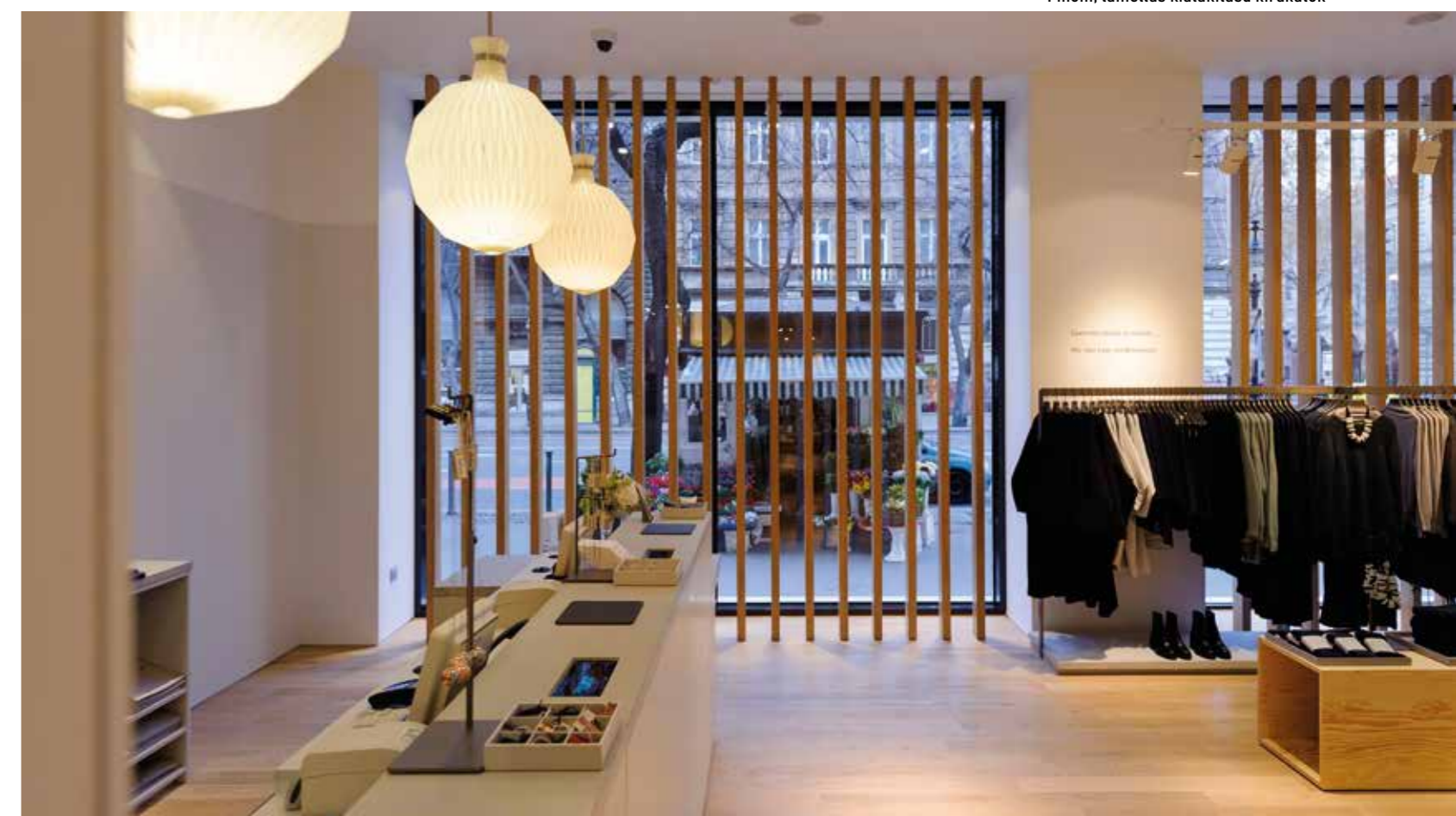
Finom, lamellás kialakítású kirkatok

gokat preferáló, kozmopolita hangulatát erősíti a fafelületű furnérpadló alkalmazása, mellette üde színfoltként szintén faborítású posztamensek váltakoznak a fehér lamináltakkal, egy helyütt összerótt lécek struktúráját imitáló, avagy szintén rajzos, szabadon álló bemutatóállvány mellett megyünk el, de erre a vonaljátékra erősíti rá a Nagymező utcai fronti kirkatok lamellázása is. Talán érthető, hogy a rajongás inntől már nem csak az öltözékeknek szól.