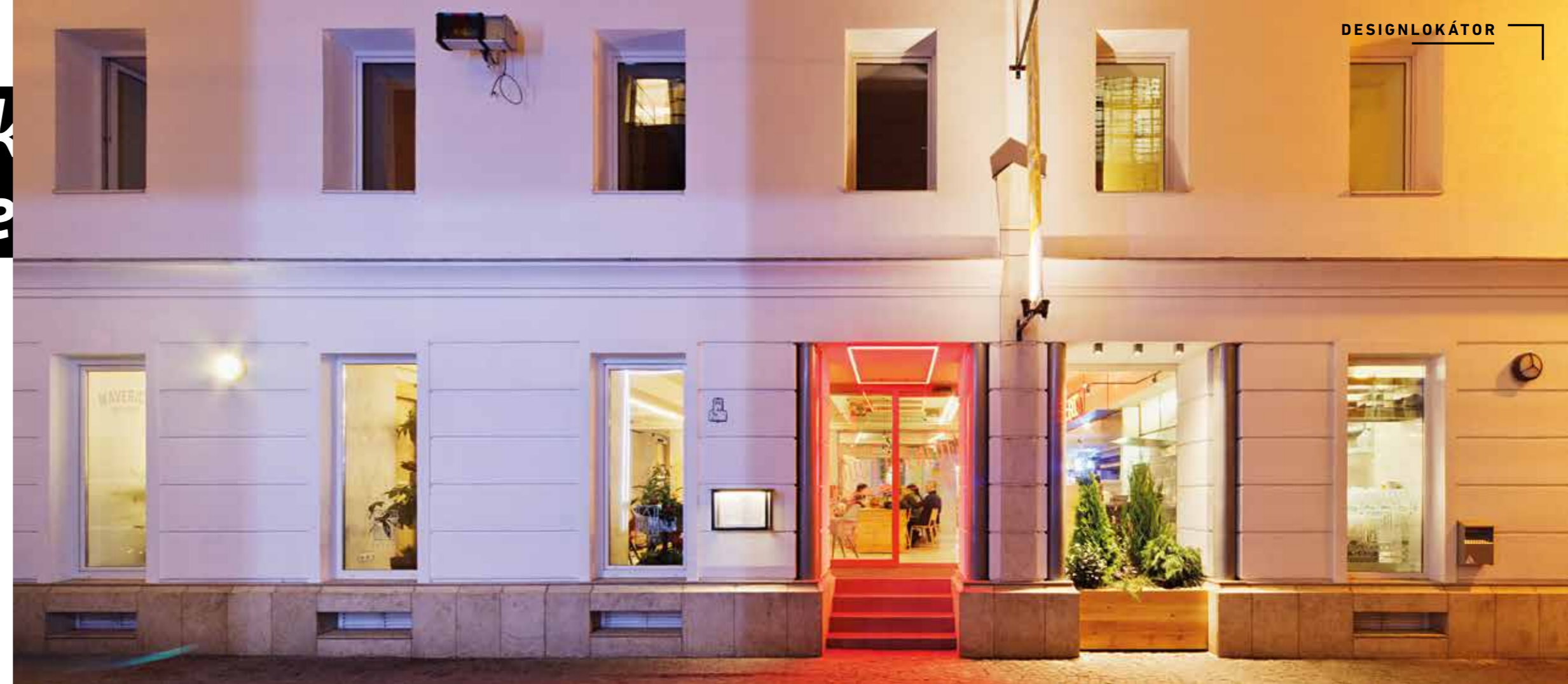
A bulinegyed „új lakója”

A sokszínű bulinegyed pezsgő „főutcájának” egyik fiatalabb épületébe, a korábbi irodák helyére néhány éve lendületes nyüzsgés költözött a Maverick City Lodge Hostellel. A tulajdonosok a célközönség számára tökéletesen pozícionált szálláshely átadása után szűk két évvel – az eredeti terveknek megfelelően –, az utcai front földszintjén nemrég nyitották meg a Fat Mama Eateryt.