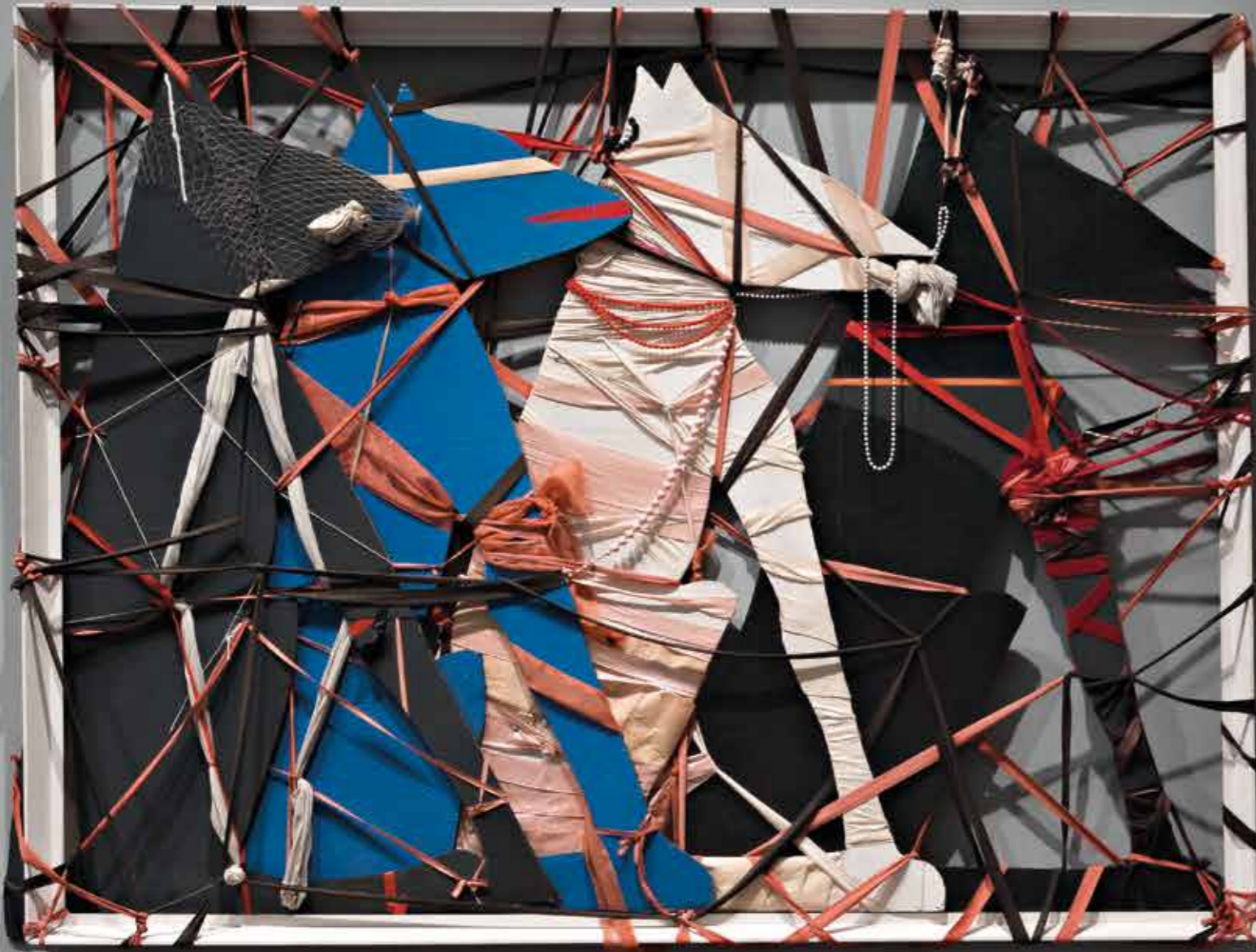
Small white label with illegible text.