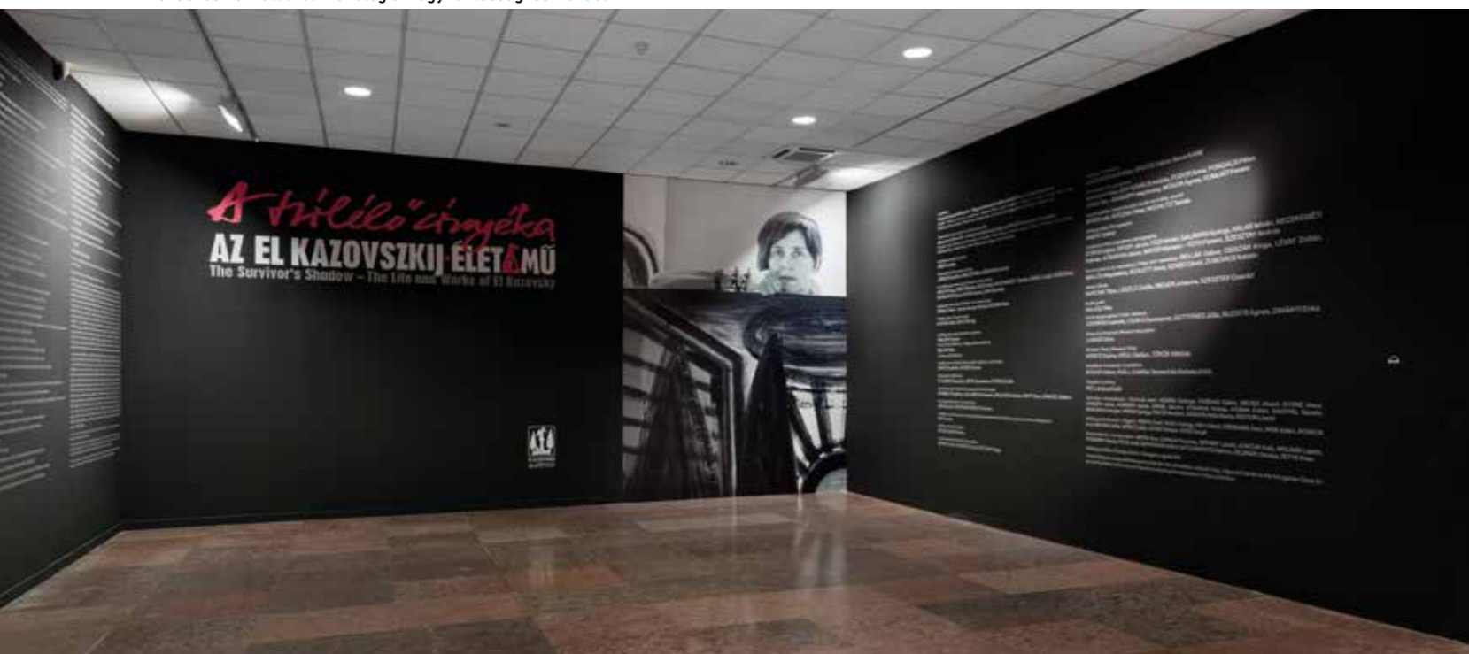
A rendezés nem állít fel kronológiai vagy fontossági sorrendet

Kiállításgrafika: Katona Klára, Megyeri Ági