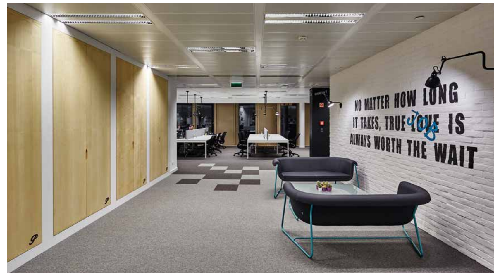
A burkolatoknál alkalmazkodni kellett

A piacvezető állásközvetítő cég új otthonát tágas konyha, masszázsszék, csocsó, zenehallgatásra is alkalmas puffok és egyedi tárgyalók