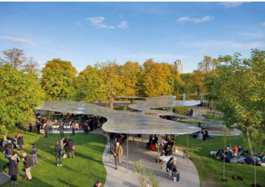
▲ Serpentine Gallery pavilon, London (2009) ▼