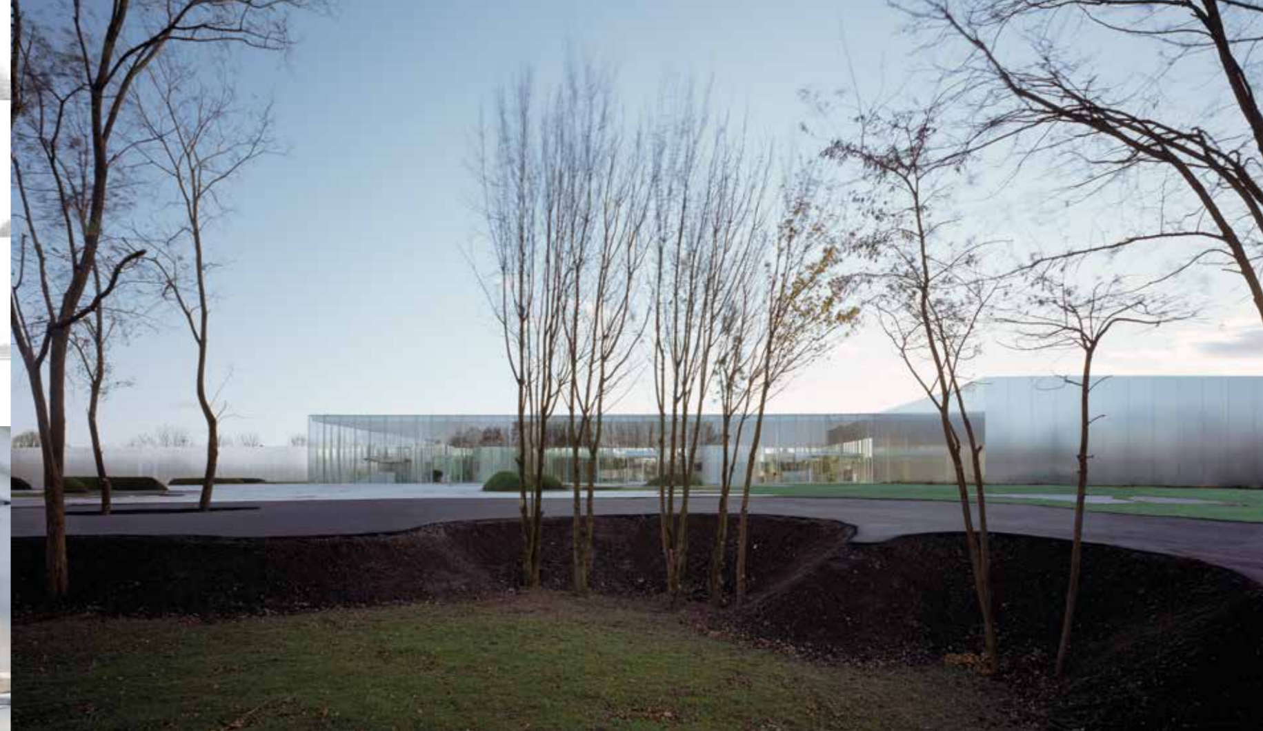
▲ Louvre Lens (2012) ▼