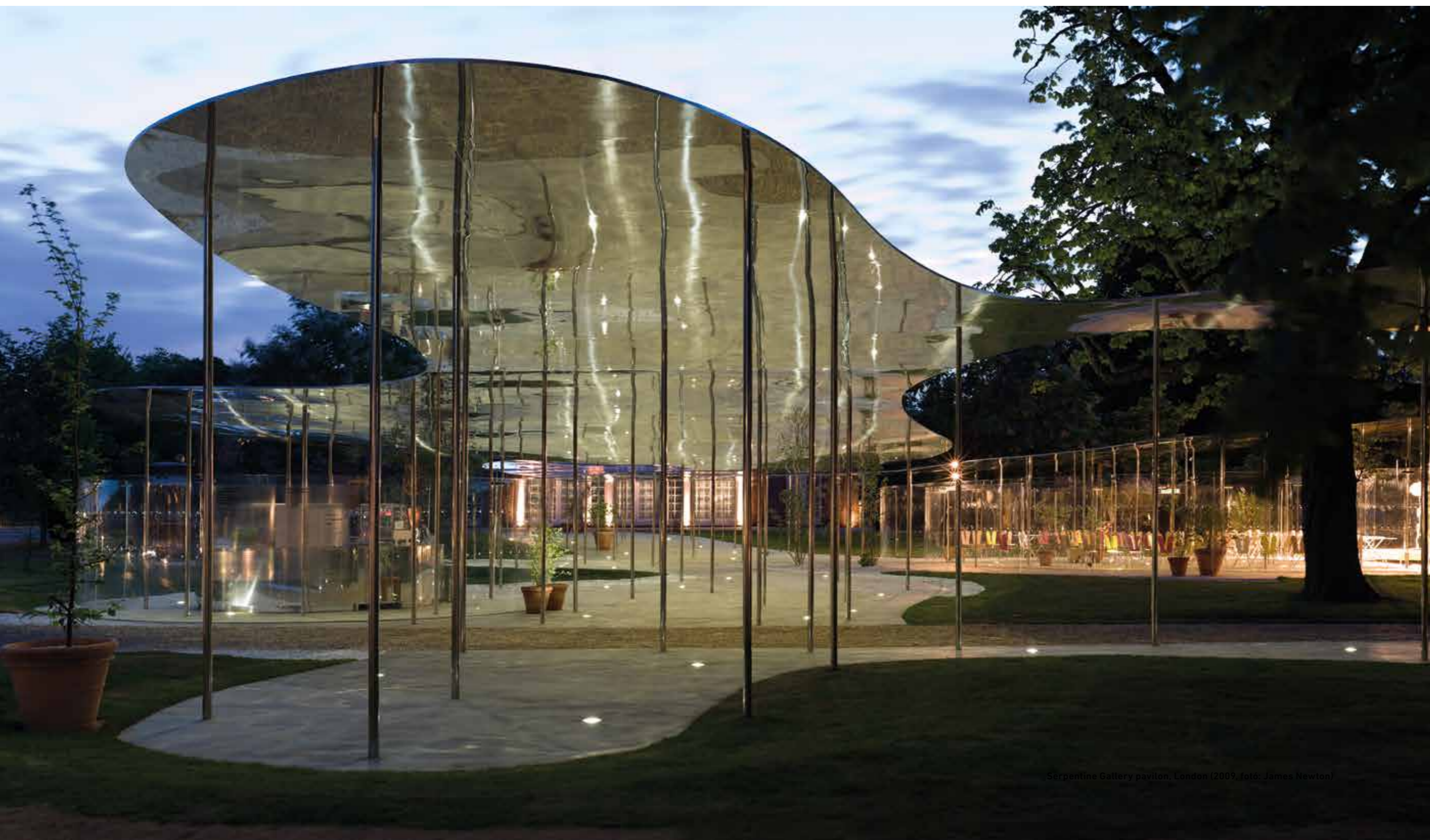
Serpentine Gallery pavilon, London (2009)

Volt a megrendelőnek bármilyen külön kérése?