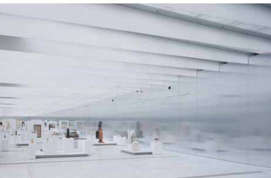
◀ A Louvre Lens (2012), az Imrey Culbert (New York) és a SANAA közös munkája (OCTOGON 2013/1) ▼

máccsal, rengeteg lelkesedéssel és próbálkozással, de végül nem jártunk sikerrel, pedig akkor hol volt még a Velencei Biennále kurátorsága, az Arany Oroszlán-díj vagy a Pritzker! Ezek után érthetően nem számítottam arra, hogy Budapesten lesz a következő felvonás.