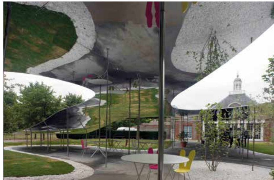
Serpentine Gallery pavilon, London (2009) ▶