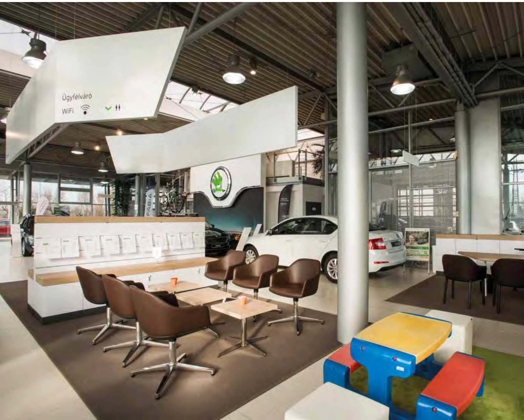
Enteriőrszigetekre ültetett ügyfélnőnek