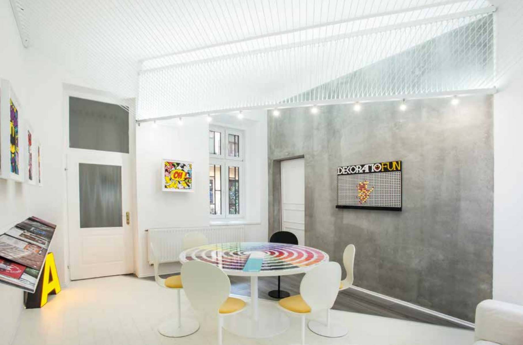
A belsőépítészeti és dekorációs „showroom” változatos kreatív élményeket kínál a vendégeknek