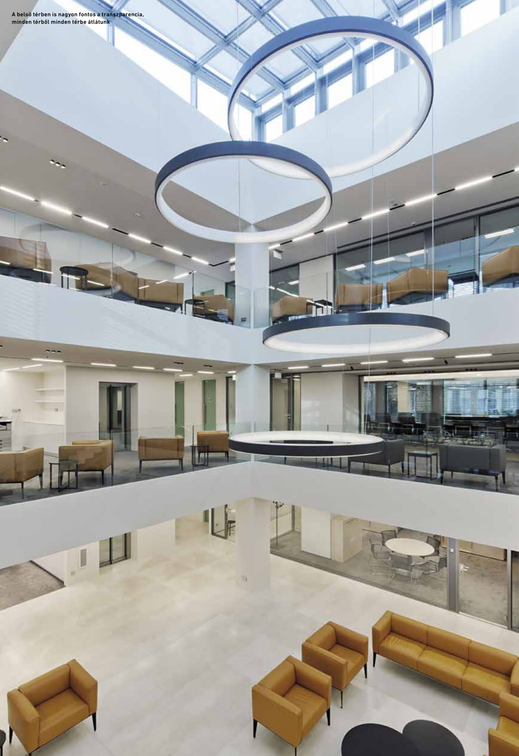
A belső térben is nagyon fontos a transzparencia, minden térből minden térbe átlátunk