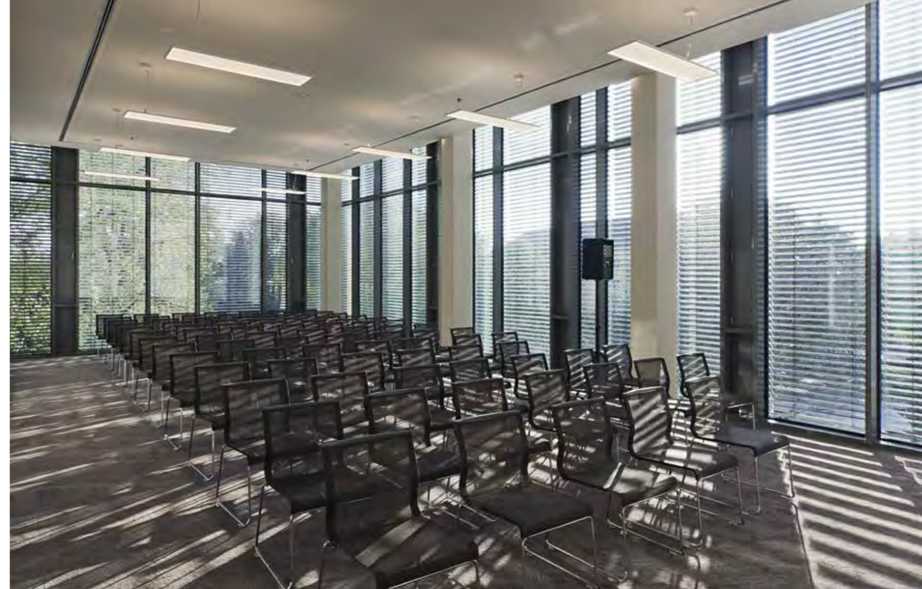
Fényjáték a dupla belmagasságú emeleti előadóban