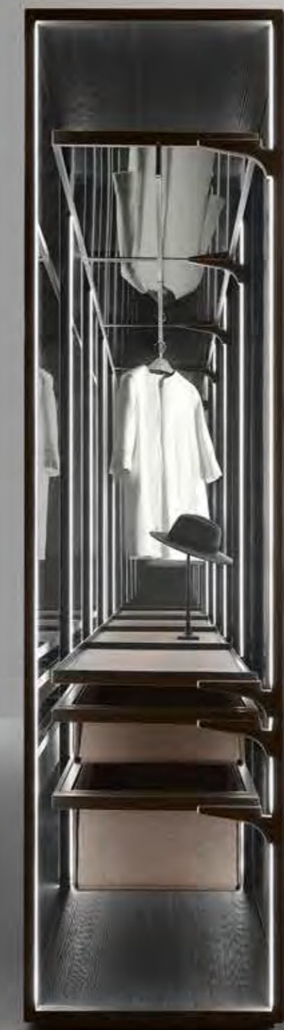
Rimadesio Cover Freestanding

interiordesign arkheia showroom made in italy your space furniture simple