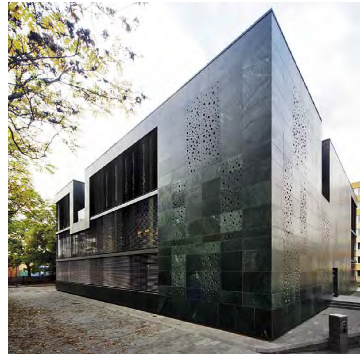
Az Eco-Clean zsaluziákat a WAREMA szállította

Szöveg MARTINKÓ JÓZSEF Építész, belsőépítész KOVÁCS CSABA, VITÁRIS LÁSZLÓ