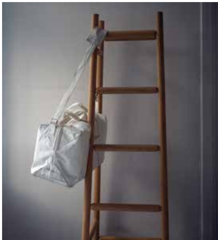
Újrahasznosított vitorlavászonból készült oldaltáska (SavetheC, 2009)

(Az interjú elkészítéséhez köszönjük a MOME és a Finnagora segítségét)