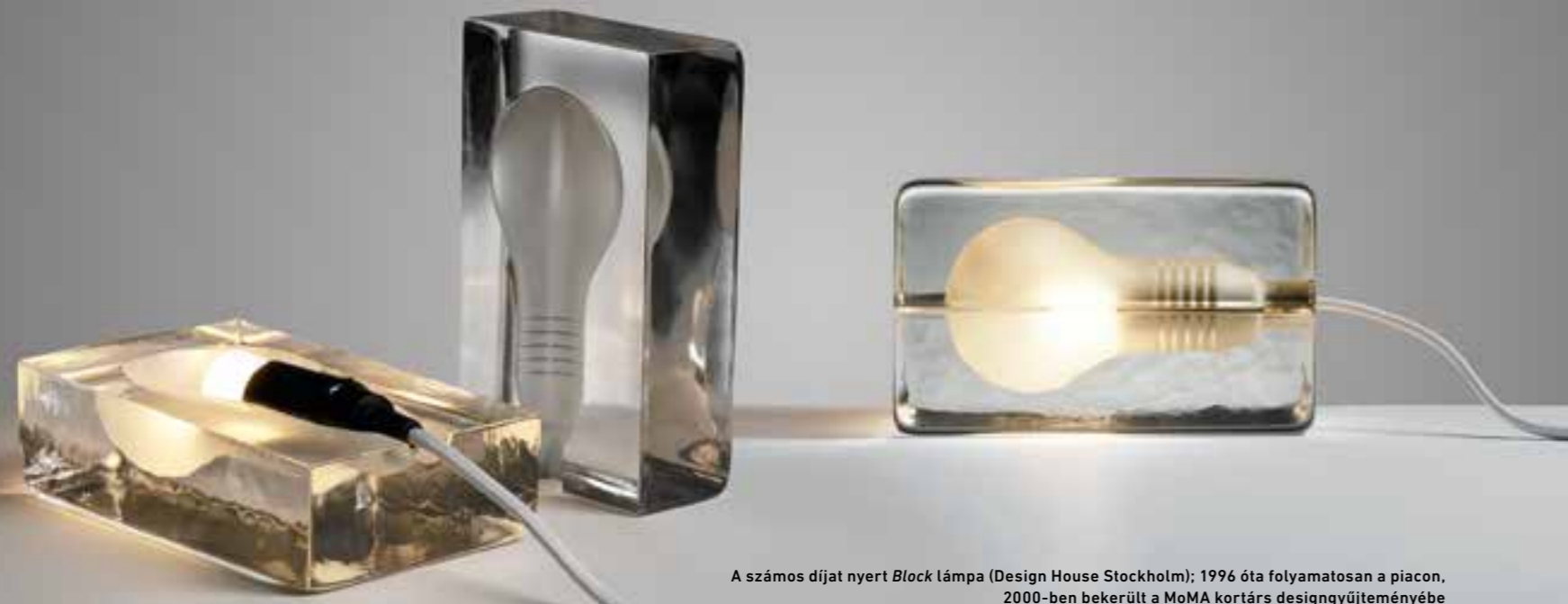
A számos díjat nyert Block lámpa (Design House Stockholm); 1996 óta folyamatosan a piacon, 2000-ben bekerült a MoMA kortárs designgyűjteményébe