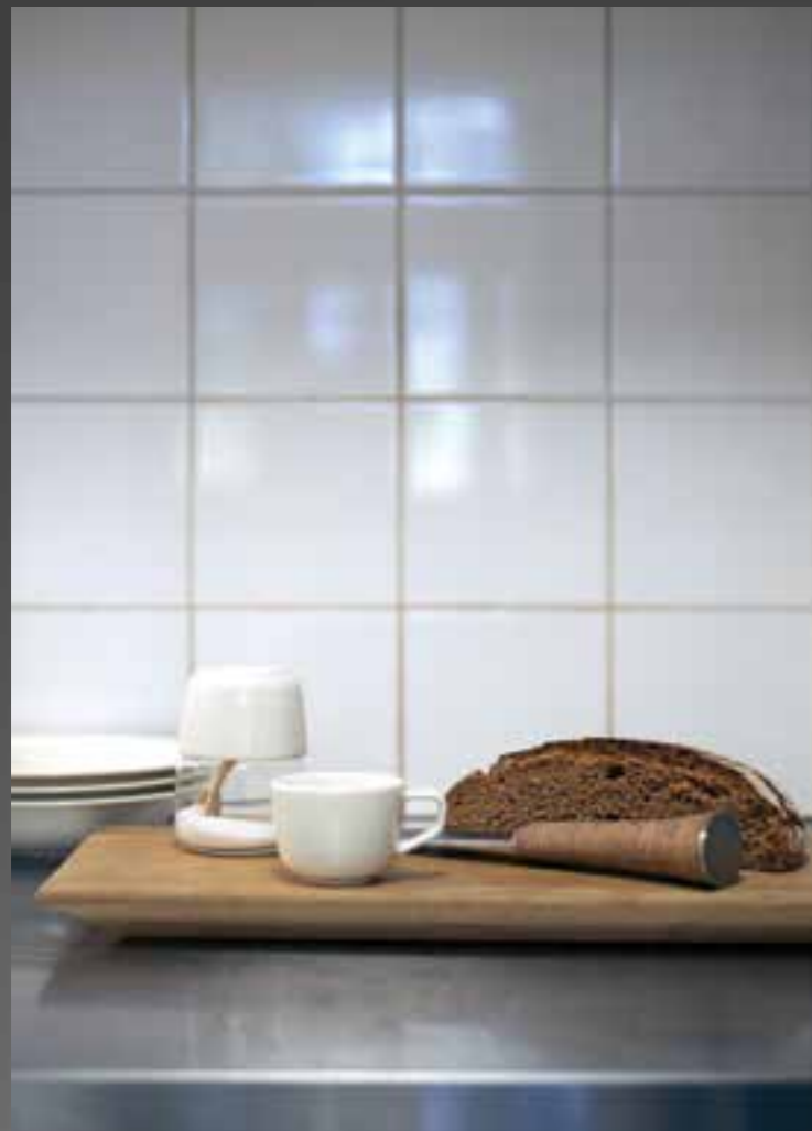
Az étkezéslet részei: a tradicionális Sámi kés újratervezése (2009); Oma cukortartó (Arabia, 2007); Sarjaton csésze (Iittala, 2012)

Ez erős ars poetica. Tehát a design önmagában jobba teheti a világot? Igen, azt gondolom, hogy a design sokkal jobb életkörülményeket és életminőséget teremthet. Ez persze nem egyszerű, mert ha belegondolsz, rengeteg tárgyi impulzus ér minket nap mint nap, és végső soron mindet valaki tervezte.