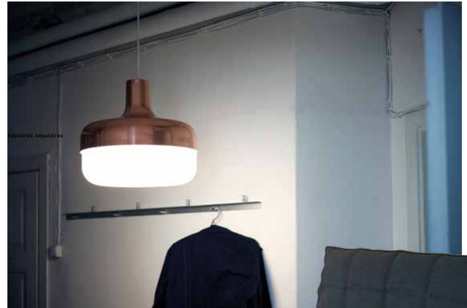
Képláírás, képaláírás Korona függeszték (Valoarte, 2014)

Nem, ilyenek már nincsenek. A finn ízlés olyasvalami, ami régen nagyon meghatározó volt. Nagy múltra tekint vissza, különösen a minták és motívumok terén, de talán azért is, mert olyan különleges kapcsolata van a kultúránknak a természettel. Attól tartok, a designvilág már