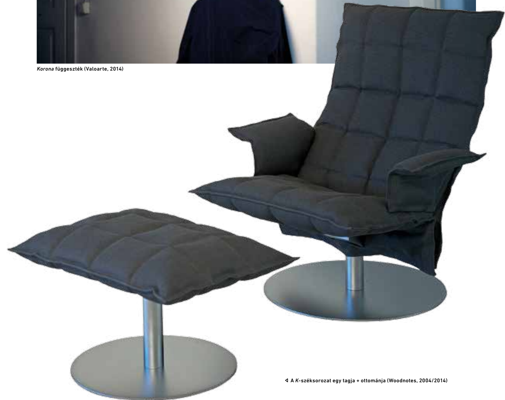
◀ A K-széksorozat egy tagja + ottománja (Woodnotes, 2004/2014)