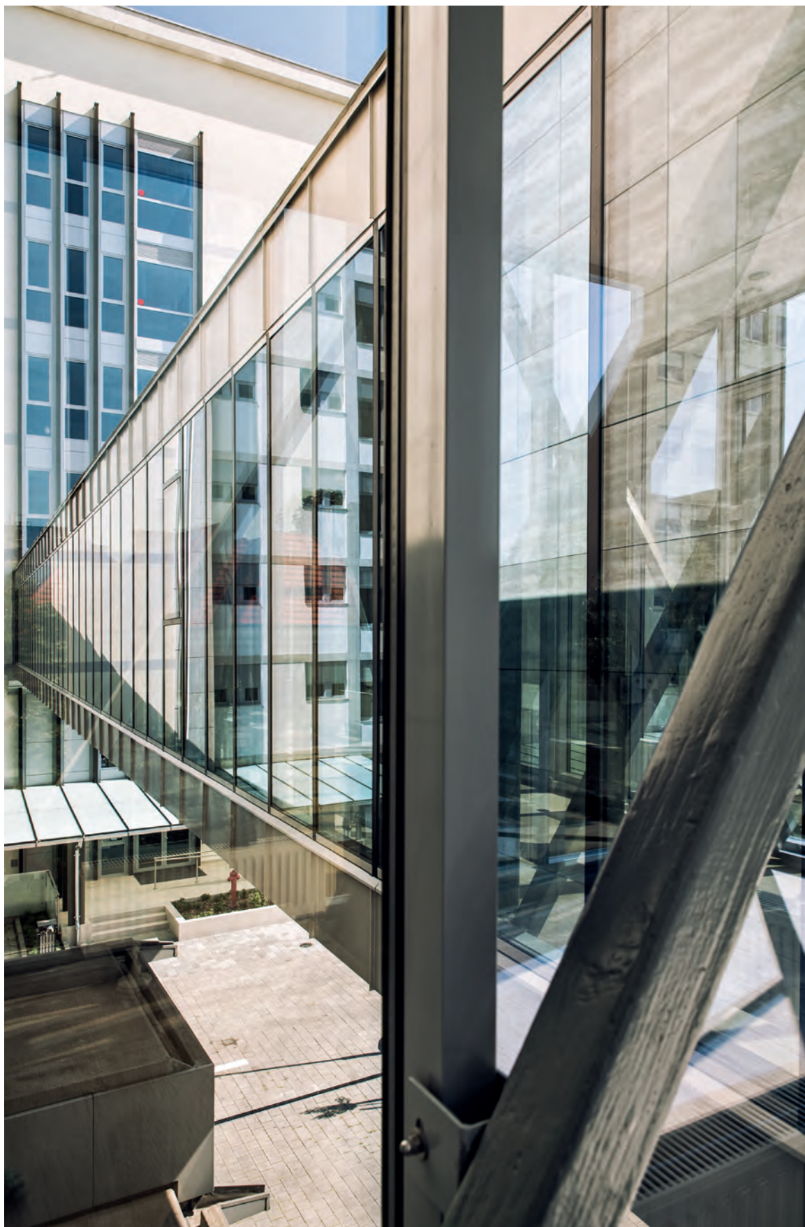
A két épületet összekötő impozáns híd