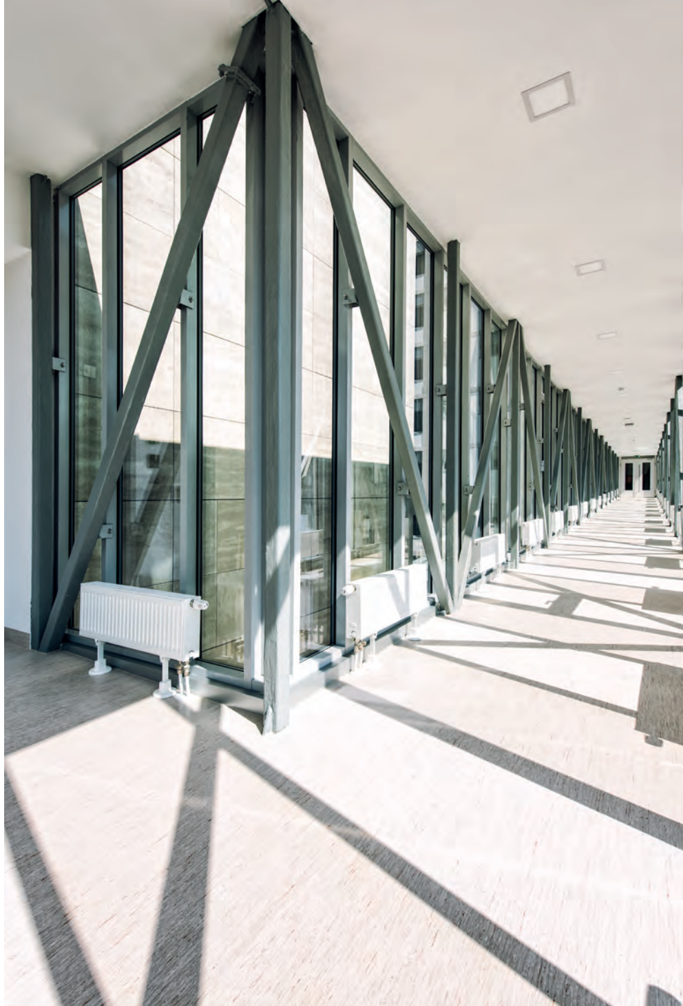
Sarokpont az épület és a híd találkozásánál

Az esti órákban is érdemes megnézni az irodaházat, hiszen impozáns díszkivilágítást kapott, amellyel hangsúlyozzák a két épület architektúráját, építészeti elemeit. A főbejáratnál a függőleges bordákat világítják meg, valamint az előtetőt, annak szélén pedig LED-csík fut végig. Az oldalhomlokzatok alulról kapnak fényt, míg a vízszintes ablakok alatti sávok pedig a Groupama színeiben pompáznak