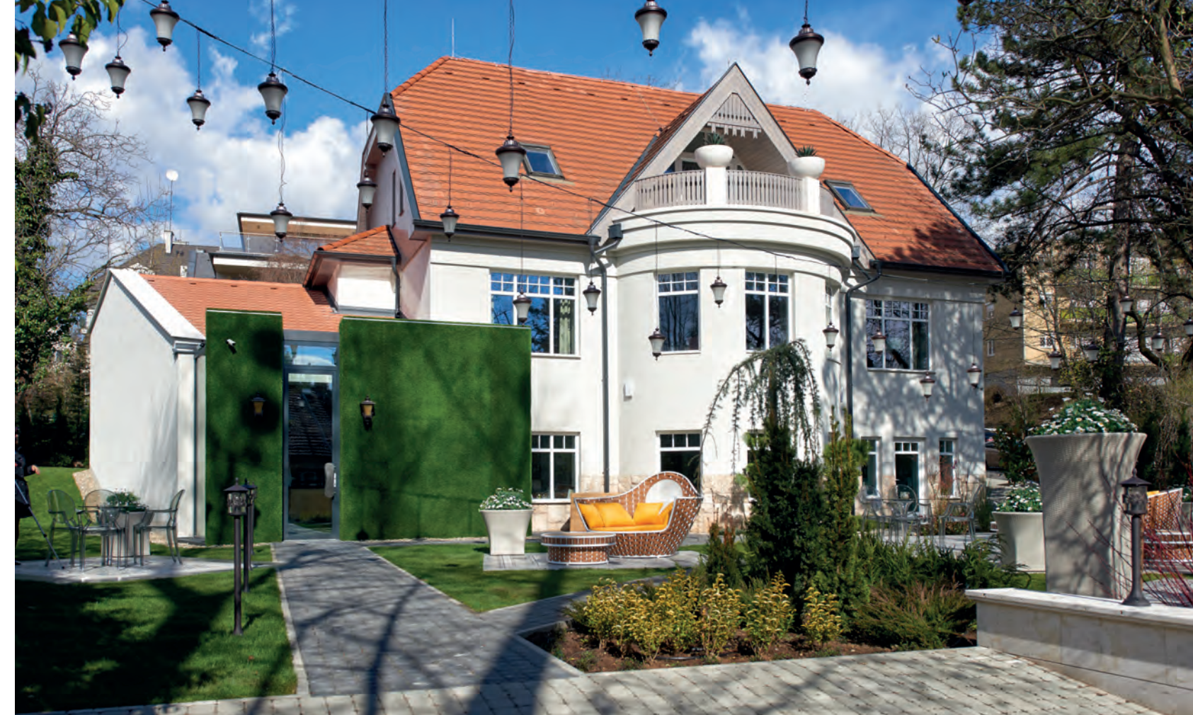
A klasszikus budai villa jellegzetes arányai szinte változatlanok

érezzük. Az épület jellegzetes arányai szinte változatlanok, csak a bejáratú részhez került modern kiegészítés. Az üveg és műfű felületű részbe lépve a „semmibe” – vagyis a borospince sokméteres mélységét megmutató üvegpadlóra – érkezünk. Merész megoldás, sokan megtorpannak néhány pillanatra a belépés előtt, mindemellett kiválóan alapozza meg az egész tér hangulatát.