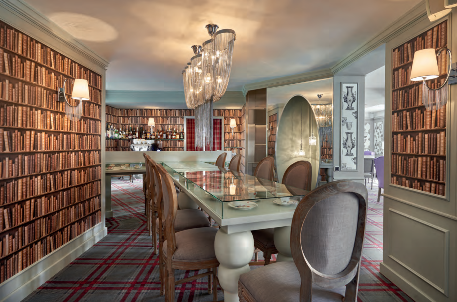
A félhomályos bárban az oversize dominál A kávézóban a teáskanna- és csészemotívum a hangsúlyos