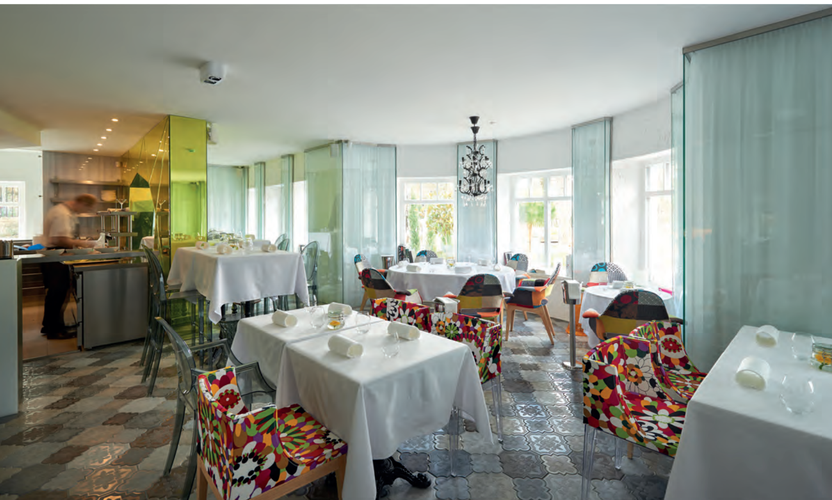
▲ A légiés és tarka kontrasztjára épült a földszinti étterem

Pontosan kiszámított sokféleségével, szórakoztató részleteivel igazi felüdülés az Émile, különösen a vendéglátásban manapság tapasztalható ipari és shabby chic dömping mellett.