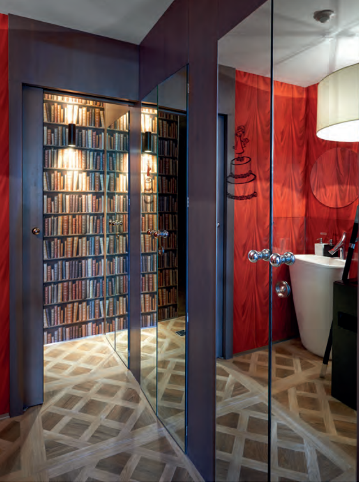
Egy elvarázsolt kastély hangulata a mosdókban is. A tükörben az Axor Starck Organic mosdócsaptelepe látható