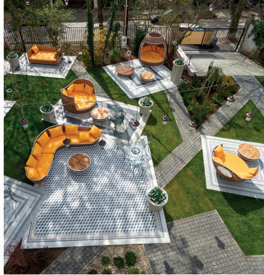
▲ Talán kissé „kilóg” a modern kert, de a kényelem adott

vonuló, a briteket és Alice-t egyaránt idéző teáskanna és csészemotívummal. Egészen más, mégis kapcsolódó világ az ettől csak egy nyitott átjáróval elválasztott intim és félhomályos bár is. Ennek oversize csillárja és asztala is a mesevilágra rimel főként, hogy az asztalba a család régi porcelánjait építették be.