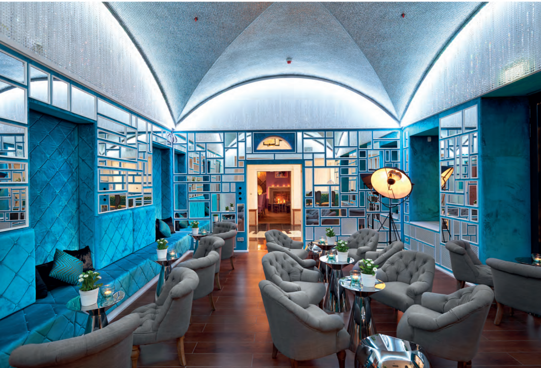
Önt is várja a Marilyn bár, a szép színésznő korának hangulatát felidéző közösségi tér a szálloda földszintjén!

2009-2012). Amerikai divat szerint a hotelbe bárki betérhet enni-inni-szórakozni. A földszint egy különböző hangulatú részekre tagolt, ám funkcióját tekintve egységes közösségi tér, a szolid recepciót oldalt rejtették el. A Marilyn bár az 1950-es, '60-as évek hollywoodi érzetével igazi női budoár, tükörmozaikkal kirakott íves mennyezete akár egy óriási lámpabura. A falburkolat pikáns kékje a színésznő kedvenc színe volt. A nőies pólussal szemközt található a férfias Satchmo (Louis Armstrong) könyvtárszoba. A Stradivari étteremben csobogó vízfal jeleníti meg a zene hullámzását.