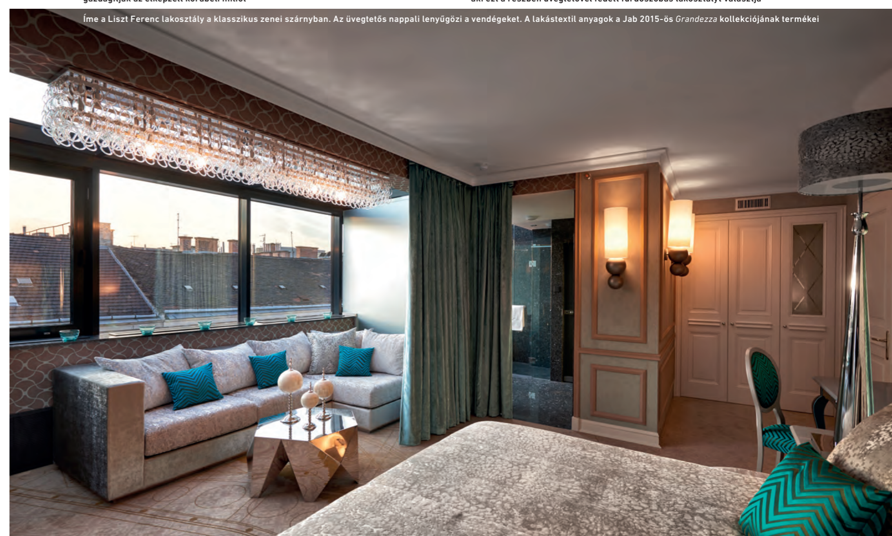
Íme a Liszt Ferenc lakosztály a klasszikus zenei szárnyban. Az üvegtetős nappali lenyűgözi a vendégeket. A lakástextil anyagok a Jab 2015-ös Grandeza kollekciójának termékei