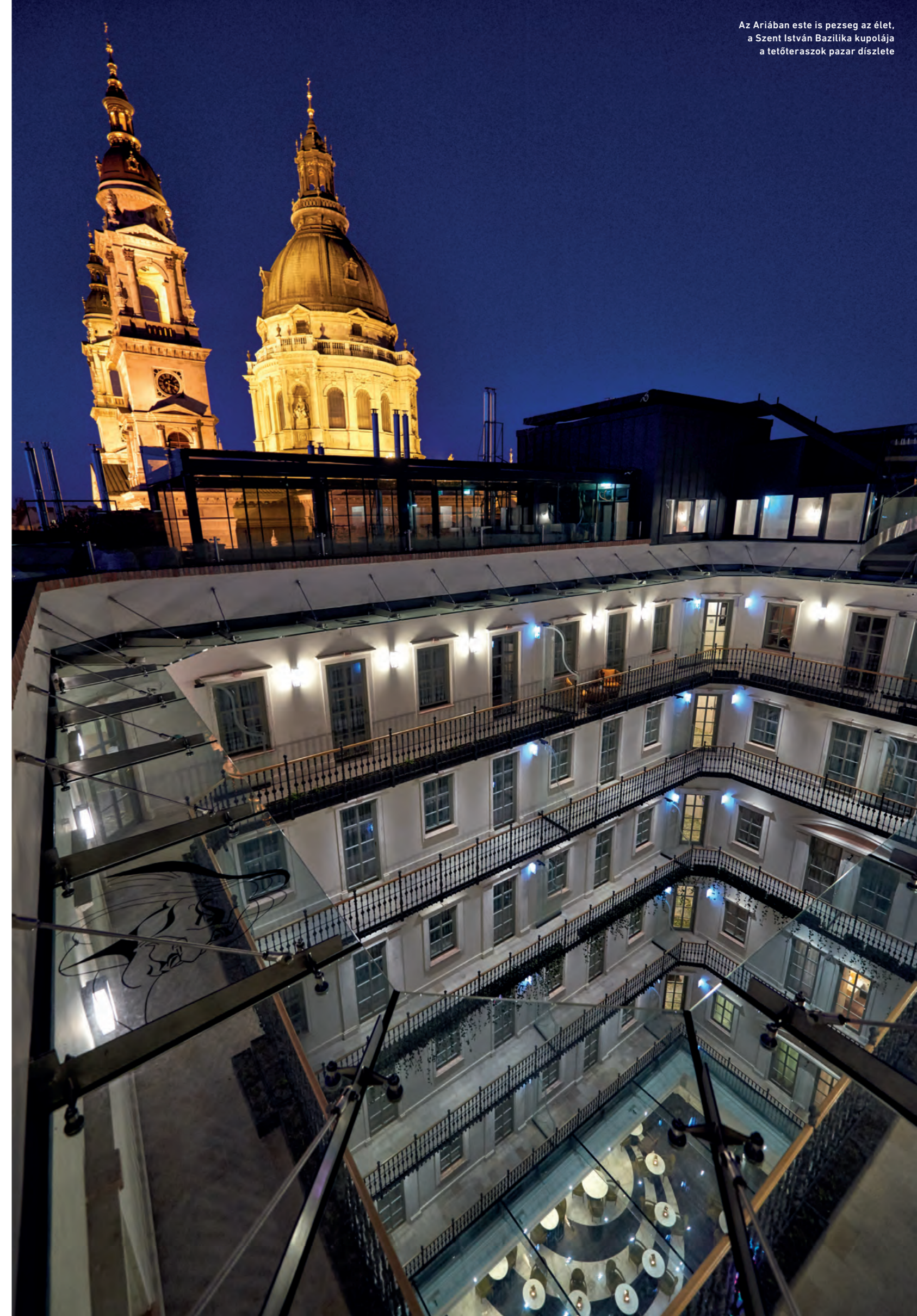
Az Ariában este is pezseg az élet, a Szent István Bazilika kupolája a tetőteraszok pazar díszlete

A belső körfolyosós ház gangját lezárható saját terasszá lehet alakítani. Mennyezeti stukkók, kandalló, elegancia, valódi ónix burkolat a fürdőszobában – mintha egy pompás régi palotában lennénk. A hátsó szobák a fiatalok számára készültek, pop-artos hangulattal, nyitott fürdőszobával. A Liszt lakosztály különlegessége a részben üvegtetes nappali és a hasonló fürdő. Kényelmes bútorokkal, párnákkal, növényekkel rendezték be a tetőteraszt, ahol pihenni és napozni is lehet. A Szent István Bazilika kupolája pazar díszlet esküvőkhöz, partikhoz egyaránt. Télen sem kell lemondani a csodás látványról, ha a fűthető étteremből élvezzük azt.