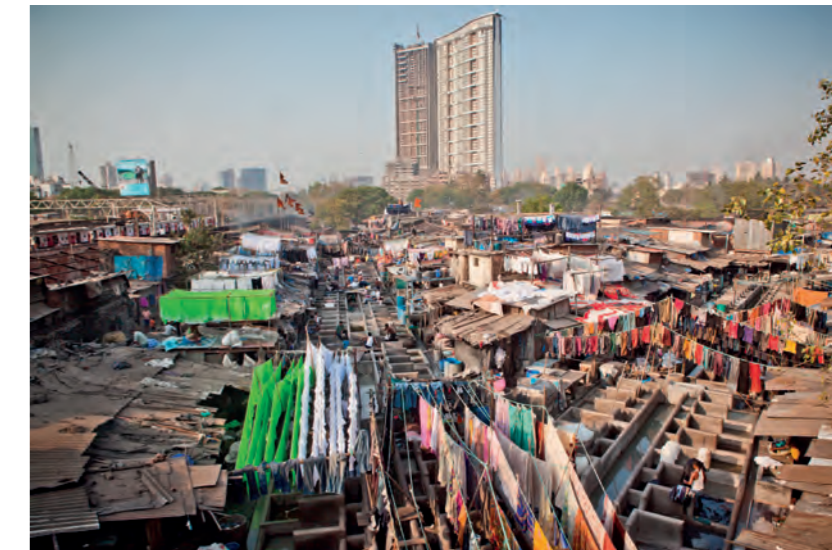
Kép a Markus Kneer rendezte filmből

tészet szerepe az olyan posztmodern megvárosokban, mint Mumbai. A hivatalos vezetés válasza a falvak mélyszegénysége előtt a városba menekülő milliók számára az, hogy vertikális nyomornegyedeket alakítsanak ki. Mivel a falura emlékeztető horizontális telepek sok helyet vesznek el a területért ténylegesen fizető ingatlanfejlesztőktől, a kormány megoldása az, hogy panelházakba költözteti ezeket az embereket, megölve ezzel a nyomornegyedek belső, szociális rendszerét.