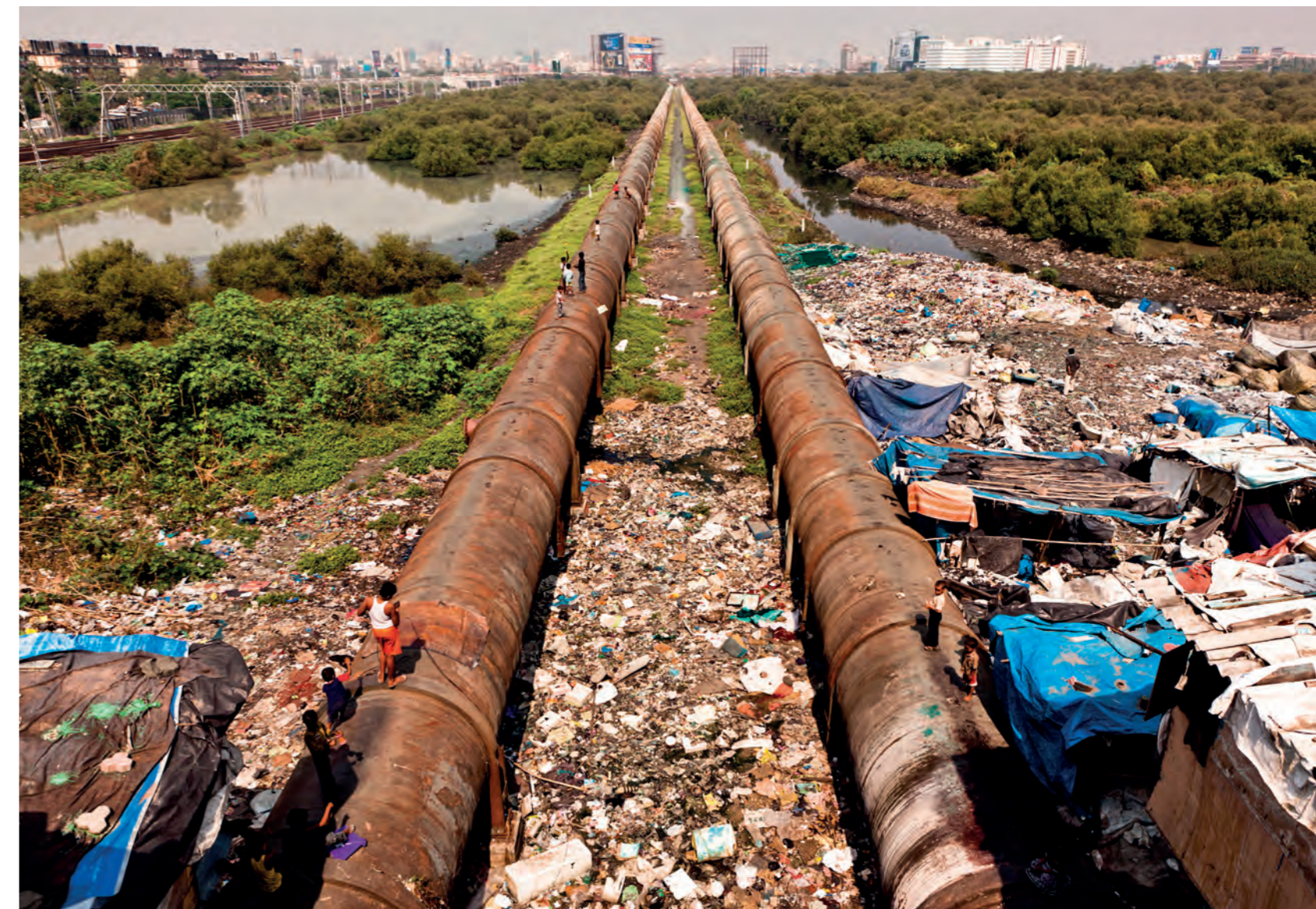
A Mumbai Maximum City Under Pressure című film részlete, a nyomortelep széle

Schwartz előadásában elmondta, hogy az Urban Think Tank mindig humanista módon közelít a nyomornegyedekben felmerülő problémákhoz. A csoport szemlélete, hogy a helyiek mindig pontosan tudják, mire van szükség, de mivel a városvezetés szintjén nincs megfelelő képviselőjük, a vezetés sokszor fájdalmas, brutális, modernista eszközökkel próbálja megoldani a felmerülő problémákat. A mumbai panelházak mellett, példa erre az U-TT eddigi legsikeresebb projektje, mely egy sífelvonót