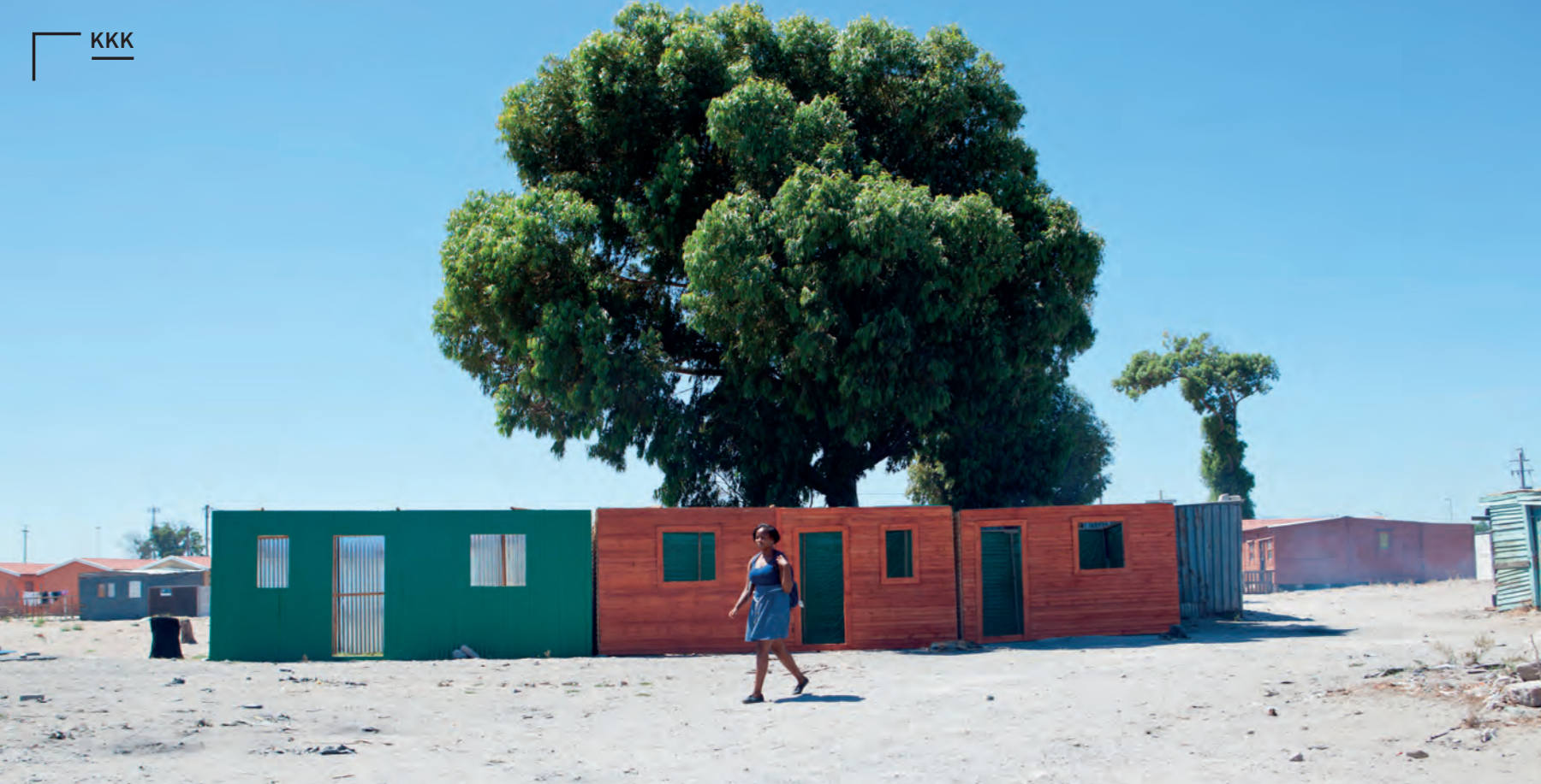
Részlet a Grand Horizonte: Around the Day in 80 Worlds című filmből (rendezte: Daniel Schwartz), fokvárosi pillanatot

telepített a caracasi nyomornegyedbe ( favela ) 2010-ben, hogy így oldja meg a sokszor 45-50 percig tartó ingázást a városba vezető metró és a telep között. A városvezetés egy autótúttal és állandó buszjáráttal akarta orvosolni a bajt, mely a favela házainak 30%-át (!) rombolta volna le, míg az Urban Think Tank által javasolt sífelvonós rendszer csupán kettőt-hármat (melyeket máshol újjáépítettek). A felvonó a favela három dombjának mindegyikén megáll, felveszi a „formális” városba igyekvőket, akiket aztán 10-15 perc alatt a metróhoz szállít.