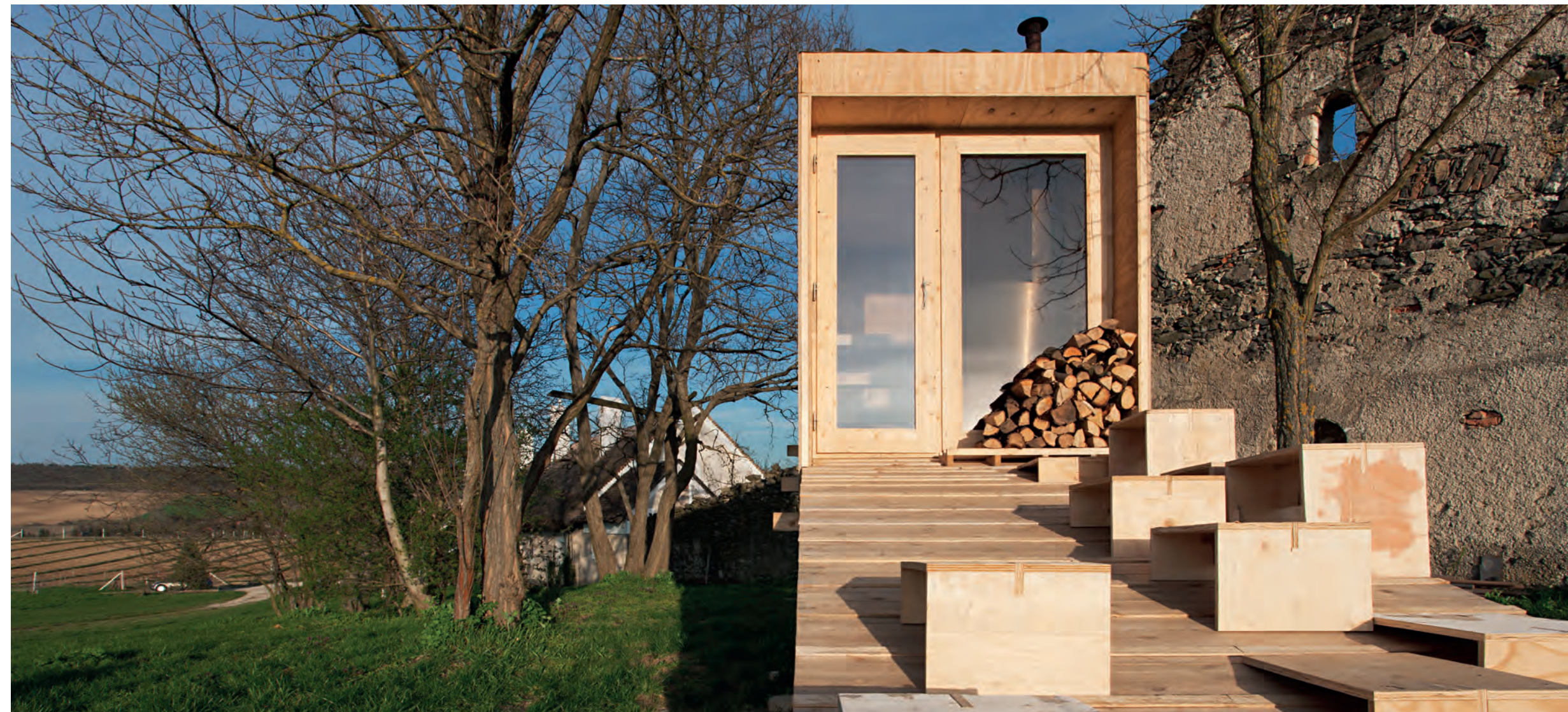
▲ Költői pozíció a régi ház sziluettjének oromfala előtt

Maga a szauna lapra-szerelhetőségéből fakadó szerkezeti logikája okán, egy rámpán közelíthető meg, mert a lépcsőt összehajtogatni nehezebb volna. Ez a rámpa lényegében folytatódik a szauna terében egy-egy lépcsőfokkal, ezzel a megoldással a szaunázó a hőmérsékletet „szabályozhatja”. Mérete nem több, mint 2 x 2 méter, vagyis pont ideális némi kikapcsolódáshoz, szemlélődéshez két ember számára. A tavalyi teraszépület (OCTOGON 2014/4) után Csórompuszta, a Hello Wood építőtáborok szűkebb pátriája újabb objektummal bővült, ami azonban a meleg beköszöntével eltárolható, elpakolható, majd télen újra elővehető.