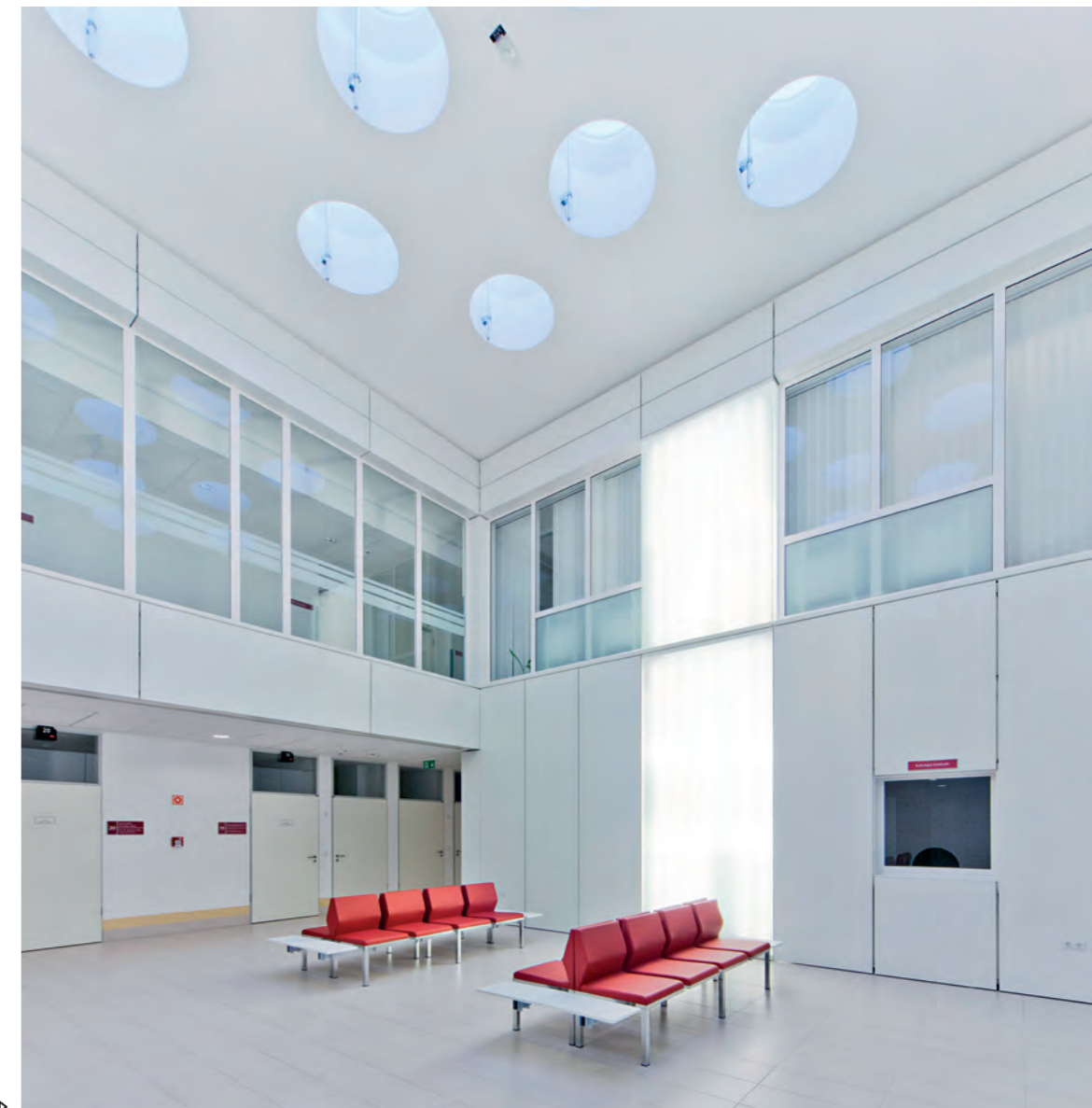
A gazdaságos terület-felhasználás ellenére tágas belső terek fogadják a látogatókat ▶

A háromszintes, összesen 6800 m 2 alapterületű, akadálymentesített Diagnosztikai Tömb végeredményben egy megnyugtatóan és okosan komponált, naponta minimum 800 látogatót fogadó egészségügyi épület, mely kiválóan orvosolta a soproni kórház központi telephelyének legfőbb infrastrukturális problémáit – ezzel ígéretes jövőképet festve a 2013-ban és 2014-ben egyaránt Az év városi kórháza címet nyert intézmény további fejlesztéseiről is.