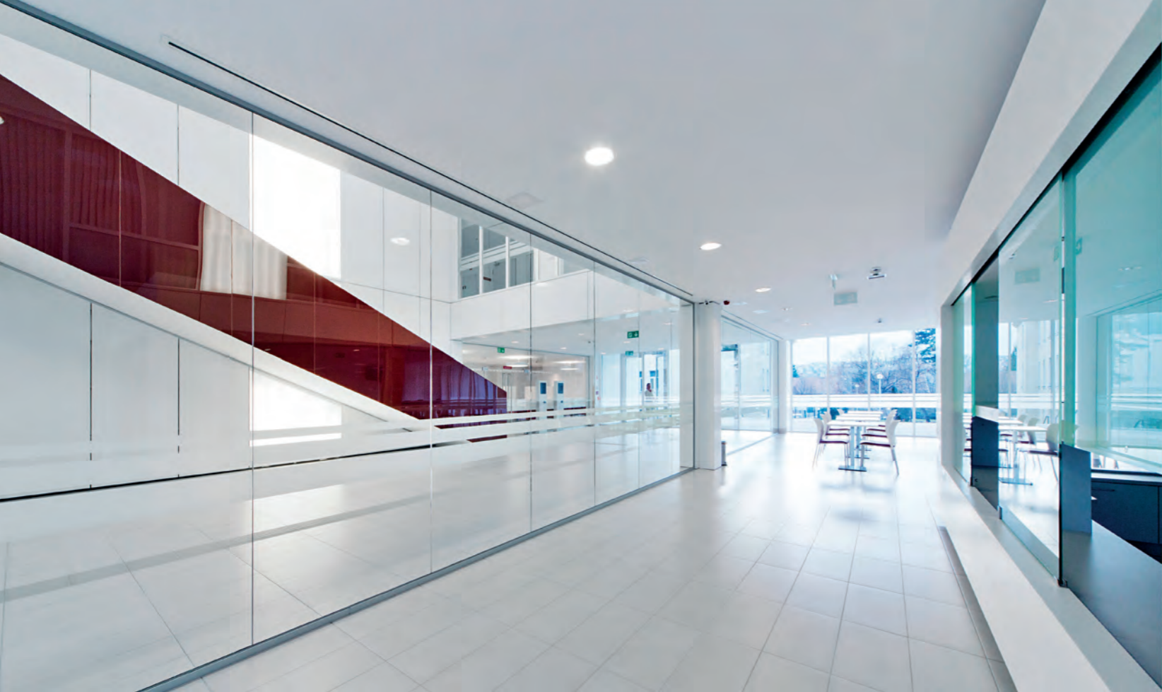
A közösségi terekbe a felülvilágítókon és az átriumokon keresztül jut természetes fény A diagnosztikai tömb környezeti rendezése és külső megvilágítása a kórház egész parkjának szívélyes miliót kölcsönöz