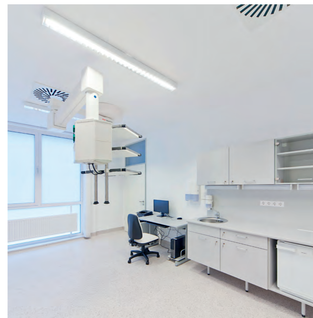
◀ A legkorszerűbb szakrendelők és diagnosztikai laborok jelentik az épület egyik fő rendeltetését

Vezető tervező: Tima Zoltán (KÖZTI Zrt.) Építész tervező: Németh Tamás Építész munkatársak: Tölgyesi Kaplony, Stein Zoltán, Molnár J. Tibor, Ráti Orsolya, Mélykúti-Papp Dóra, Szabó Máté Belsőépítész: Kerecsényi Zsuzsanna Tájépítész: Havassy Gabriella Orvostechnológiai tervező: Mediplan Kft., Altero Kft. Akadálymentesítés: Igali Zsófia Tervezés ideje: 2010-2012 Kivitelezés ideje: 2013-2014 Alapterület (bruttó): 6800 m 2