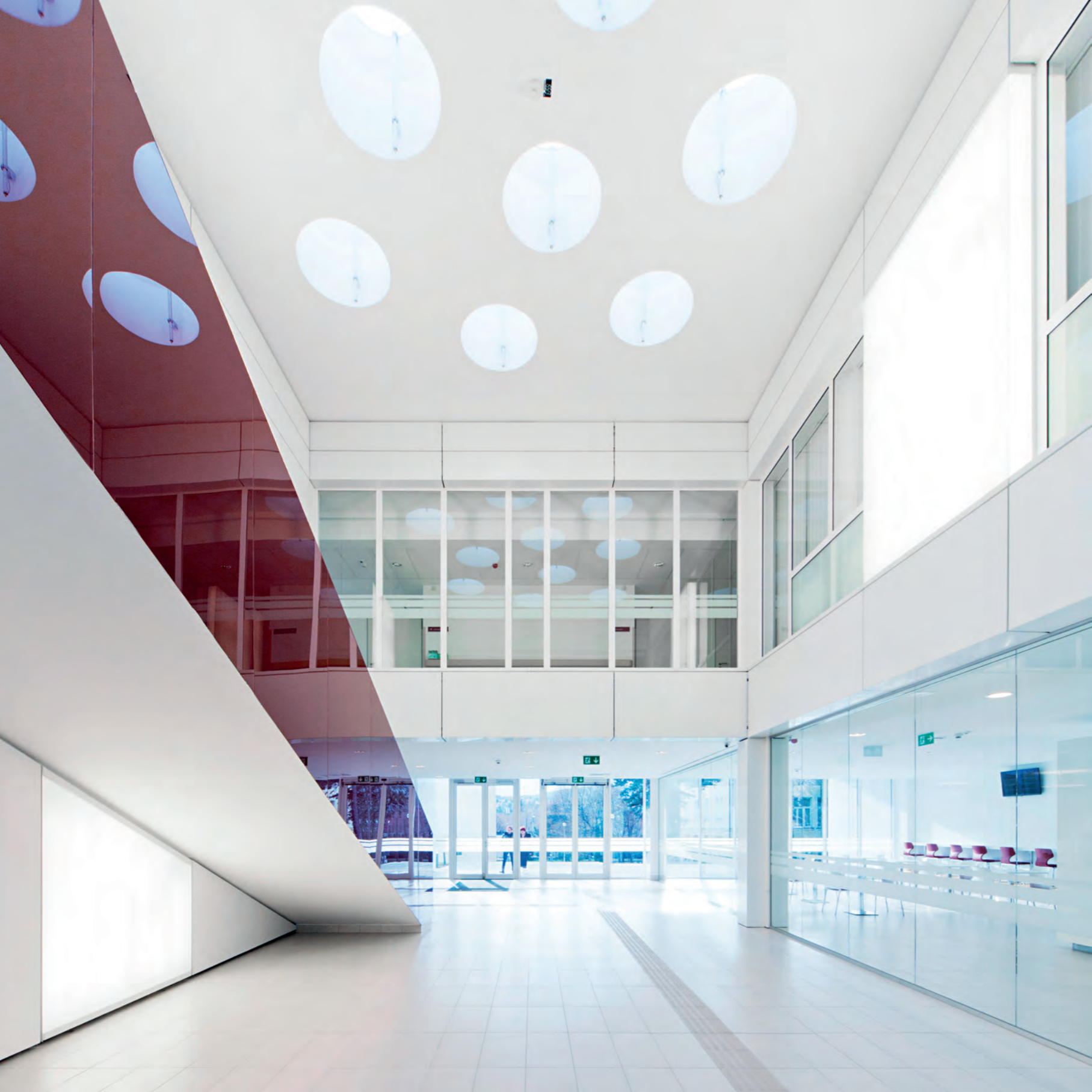
A világos és átlátható aula a kórház látogatói középpontjának tekinthető

A logikus alaprajzi szerkesztéssel centrális és szimmetrikus struktúrába rendeződnek a rendelő-sejtek, a közösségi zónák a felülvilágító és belső átriumok által becsempészett természetes megvilágításba kapaszkodnak. Így a várók is közvetlen kapcsolatban vannak az atriumokkal, melyek ugyan a látogatók számára elzárt területek, mégis látványukkal egy nyugodt és barátságos környezetet teremtenek. A természettel való közvetlen kapcsolat