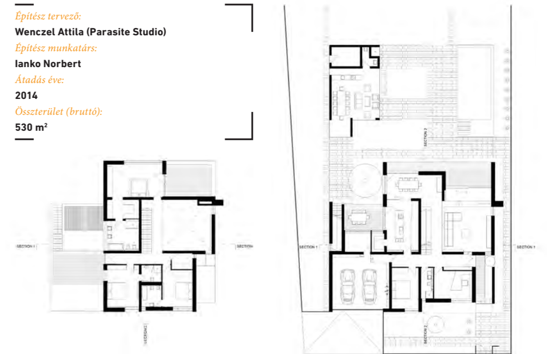
Kert, tömb, belvilág tökéletes harmóniában

Építész tervező: Wenczel Attila (Parasite Studio) Építész munkatárs: Ianko Norbert Átadás éve: 2014 Összterület (bruttó): 530 m 2