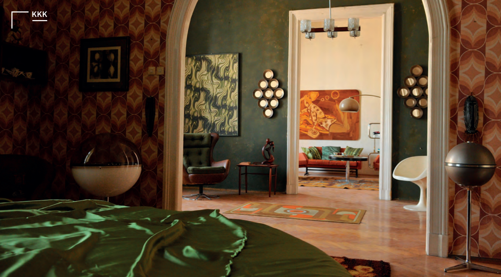
Leginkább talán a hetvenes éveket idéző retrós világ

A Lizát bámuló kéményseprő is pont egy olyan tetőről esik le, ami a ház ablakából látszik.