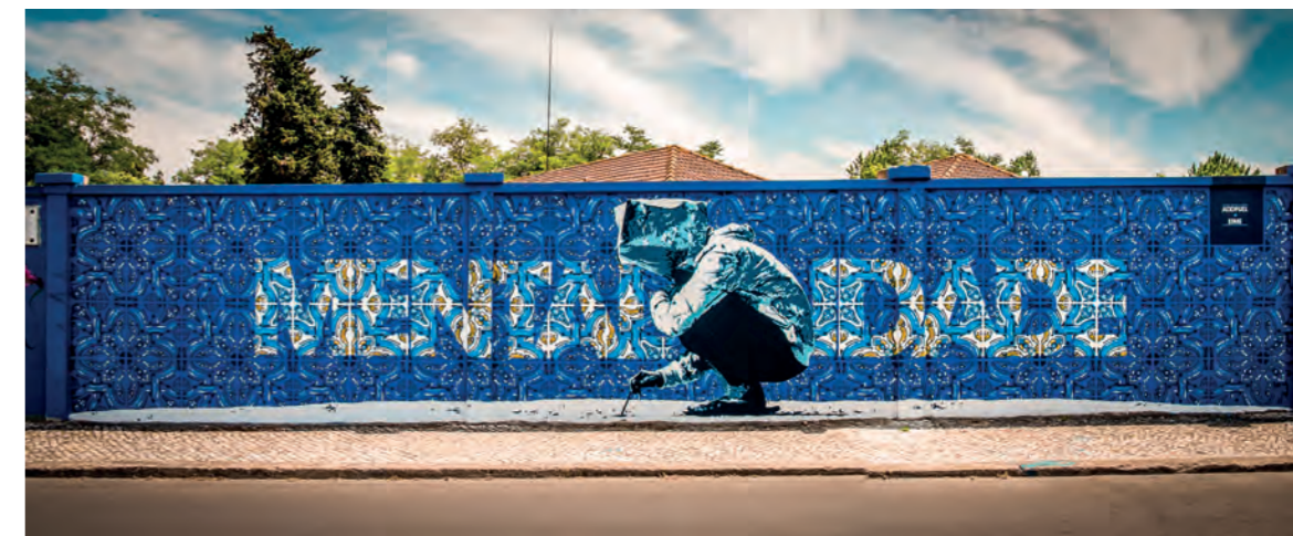
A csempék stílusát újragondoló Add Fuel munkája a Rostos do Muro Azul projekt keretében

Az omladozó épületek homlokzatából visszakapart portréiról elhíresült Vhils a graffitizés illegálisát elfeledve sztár épületszobrászá nőtte ki magát. Műveivel a világ számos nagyvárosában – Hongkong, Rio de Janeiro, Las Vegas, Mexikó, Berlin, Párizs, Sydney – találkozhatunk. A 27 éves művészre hazája is méltán büszke, formabontó munkássága a tavalyi, a Museu de Electricidade hatalmas épületében megrendezett egyéni kiállításában kumulálódott. A folyóparti állami intézmény szabad kezet adott a művészi szárnyalásnak, Vhils nem csak a belső tereket használta ki az anyag- és formakísérletre, hanem az épület és a környező