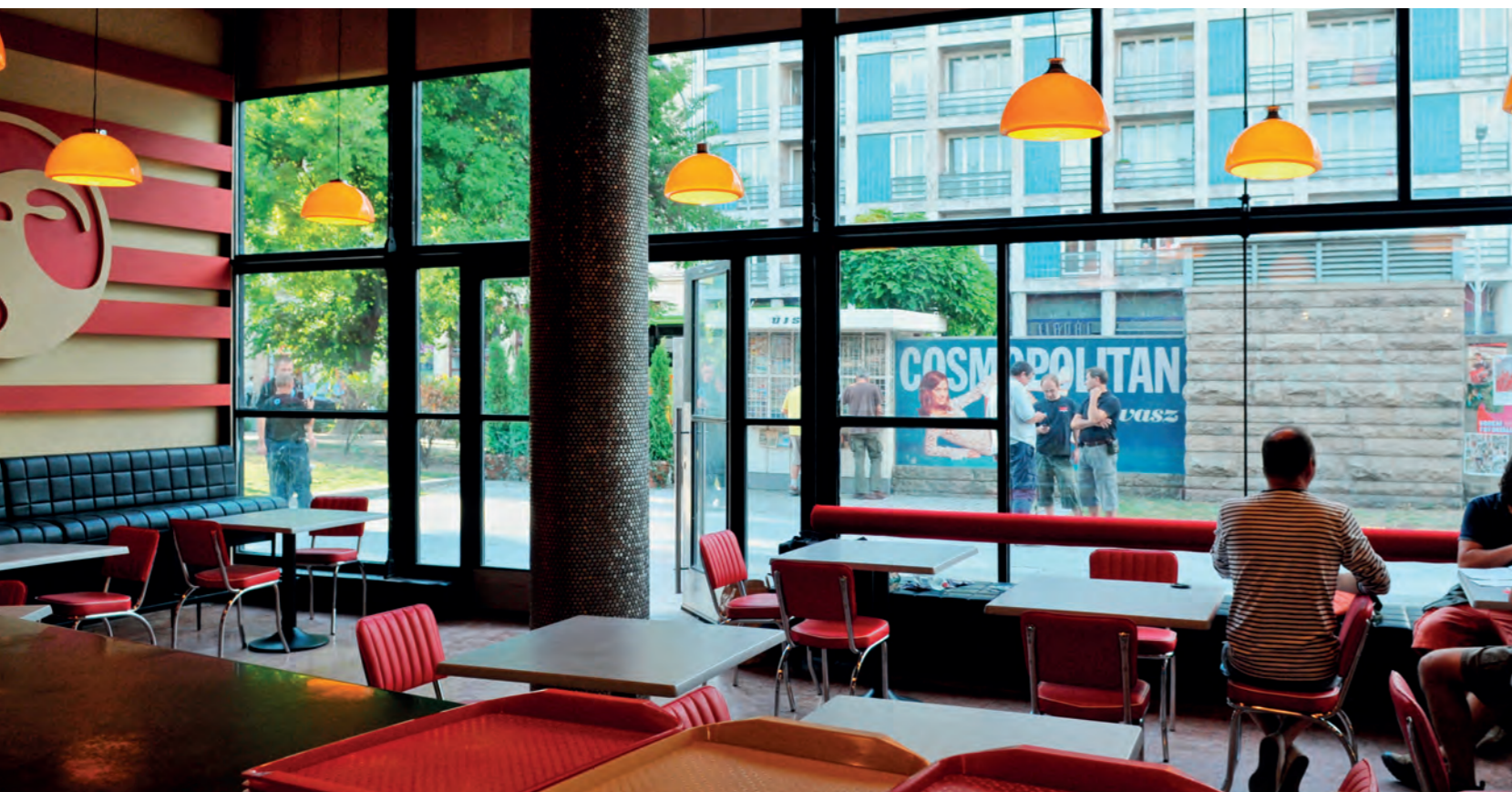
Mekk Burger gyorsétterem