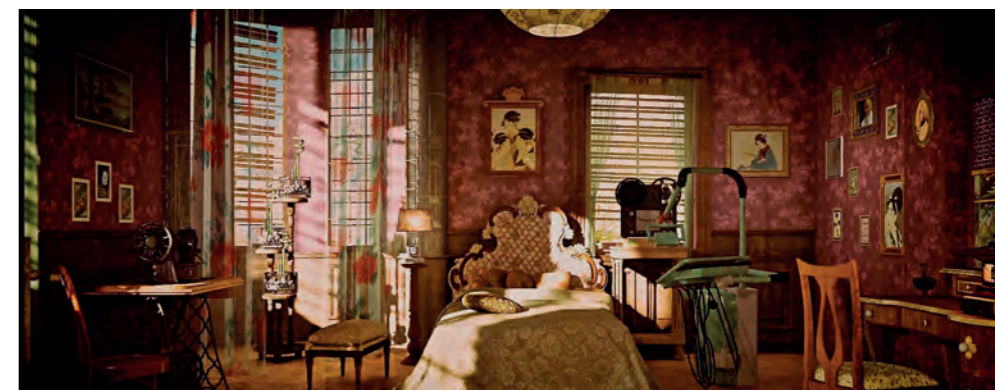
Márta néni szobája