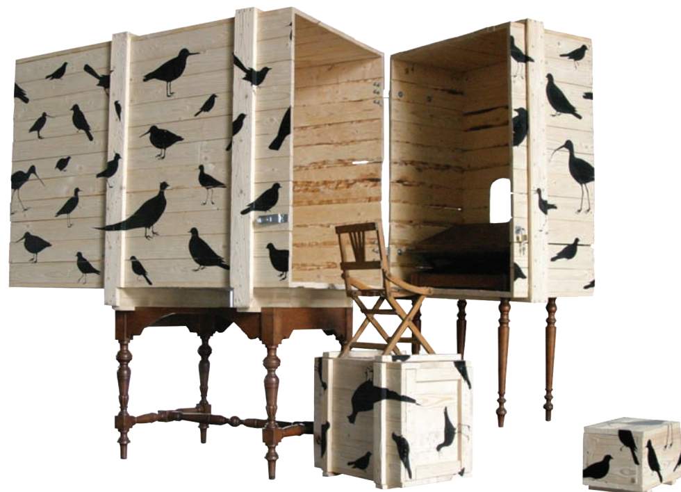
Birdwatch Cabinet Boy, 2003