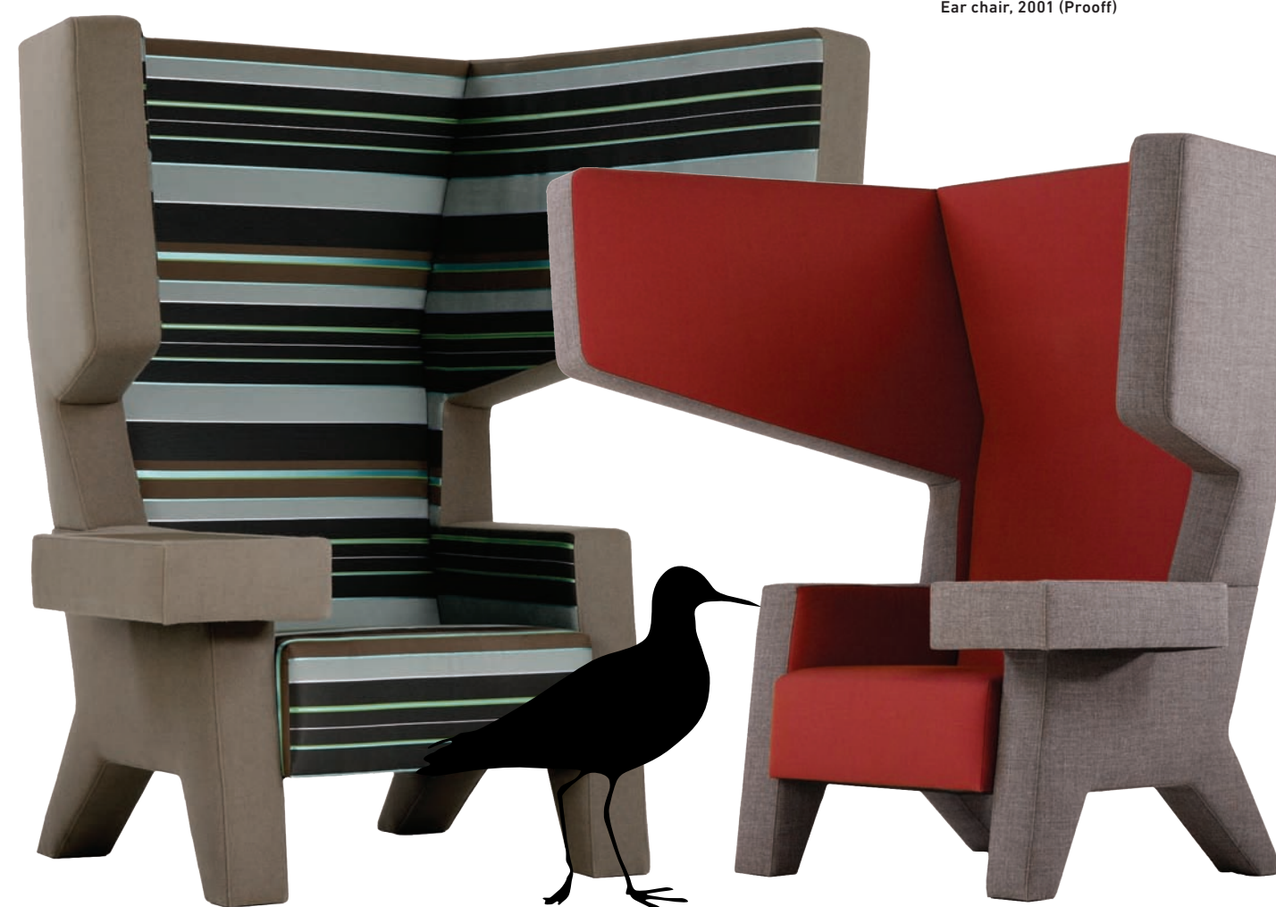
Ear chair, 2001 (Prooff)

Az elméleteim történeti háttérét nem ismerem. Ezt nem érzem kellemetlennek. Pár éve hallottam először életemben azokról a mozgalmakról, amiket említ. Ledöbbsentem, aztán rájöttem, hogy ezeket már láttam korábban, de azt hallva, hogy az írógéppel rajzoltak az irodát nyitott térként képelték el, vagy a háztáji gazdálkodást beemelték az építészetbe, mint egy releváns témát, akkor azt gondoltam, hogy „Jézusom! Ezek épp azok a témák, amikkel én is foglalkoztam, és én ugyanezekre a következtetésekre jutottam, hasonló ötletek mentén!” Persze mivel más generációhoz tartozom, a végeredmény kicsit eltérő, de nagyon boldogá tett, amikor láttam ezeket. Azt jelezte, hogy jó vágányon vagyunk. És mondhatja, hogy talán jobb eredményeket érthettünk volna el, ha én ezt már korábban ismerem, de ezt kétlem. Valójában, fel akarod fedezni magadtól a dolgokat, mert minden, amit már tudsz, az teher is. Ez a baj az oktatással is, ami önmagában jó, hogy van, de képletesen szólva, meg kell fizetni az árát. Az oktatással levágsz olyan hajtásokat, amik mindörökké elvesznek. Az is nagyon hasznos, ha azt gondolod, hogy nem tudsz semmit, mert így minden projekt egy újakezdés. Ez egészségtelen persze, mert örök bizonytalanságban élsz, ami nagyon árt a szívnek, és elveszett vagy. Így ennek is meg van az ára.