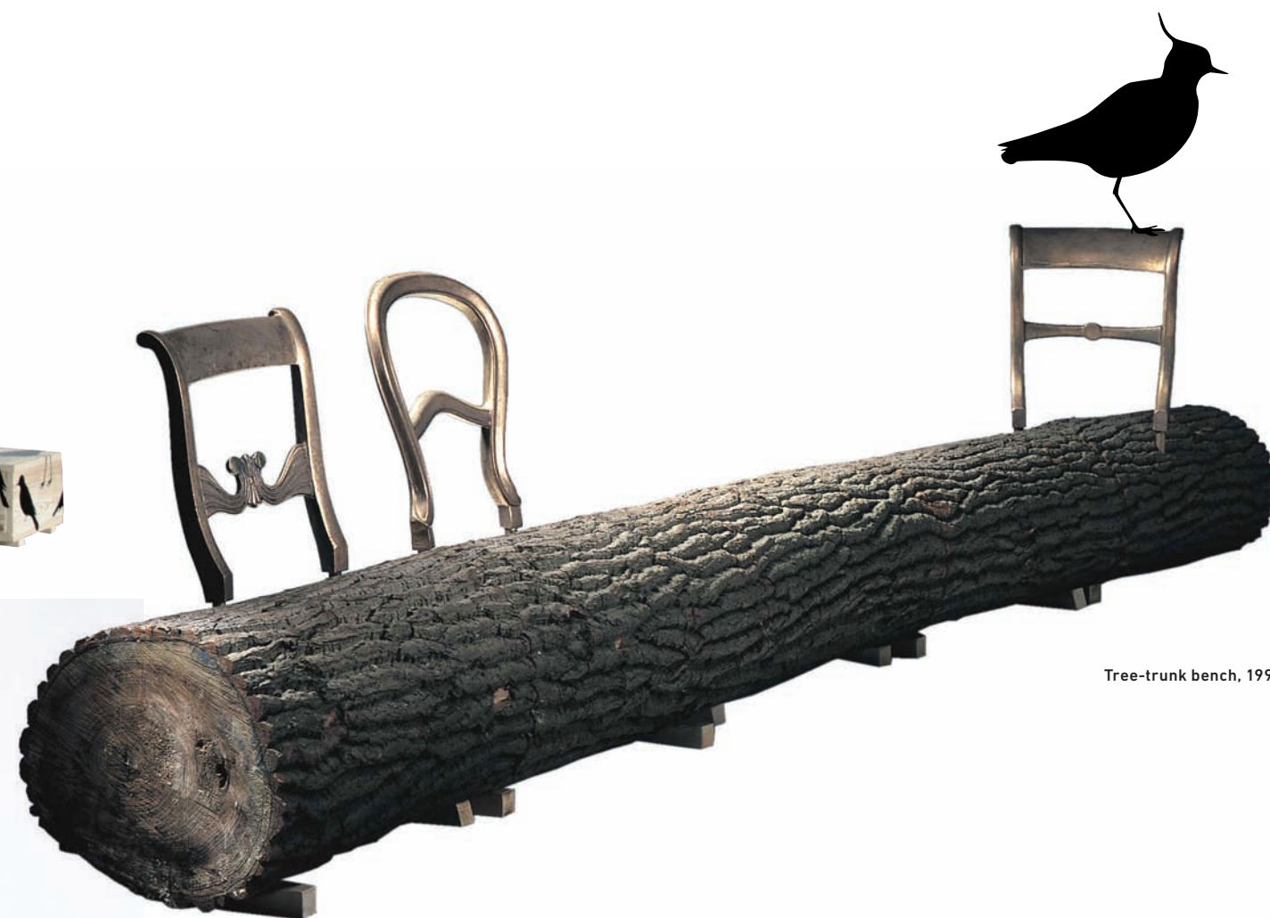
Tree-trunk bench, 1999 (droog design)