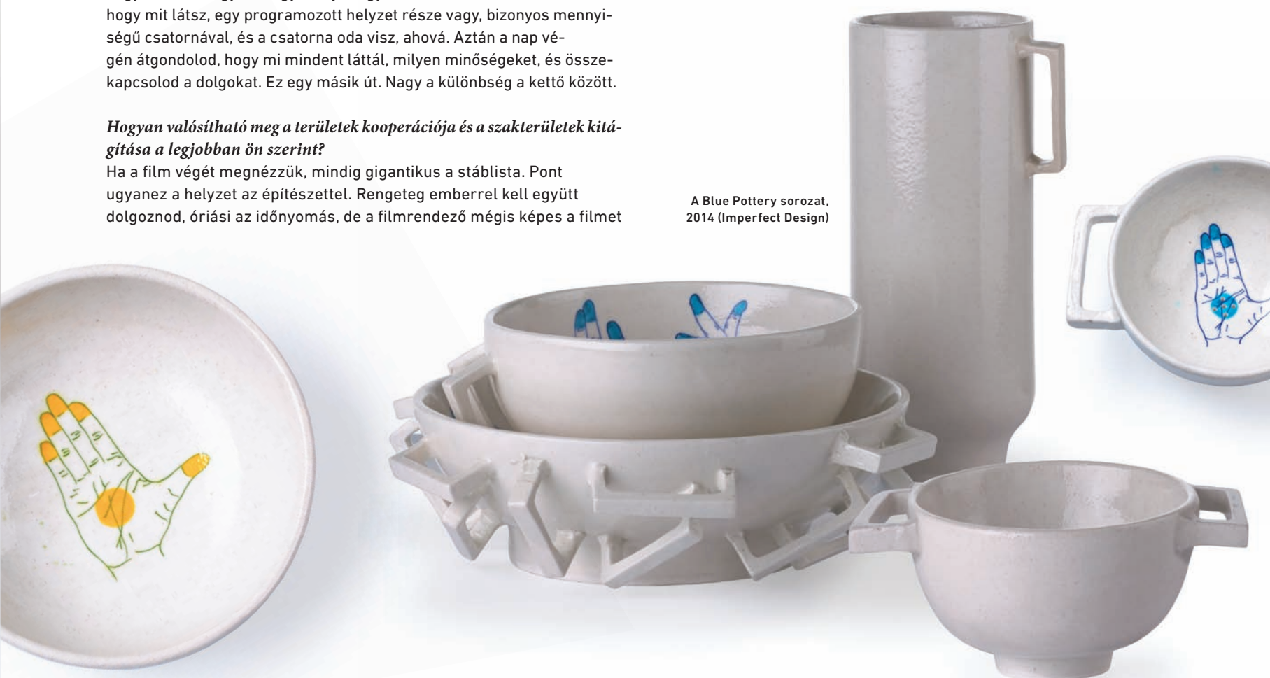
A Blue Pottery sorozat, 2014 (Imperfect Design)