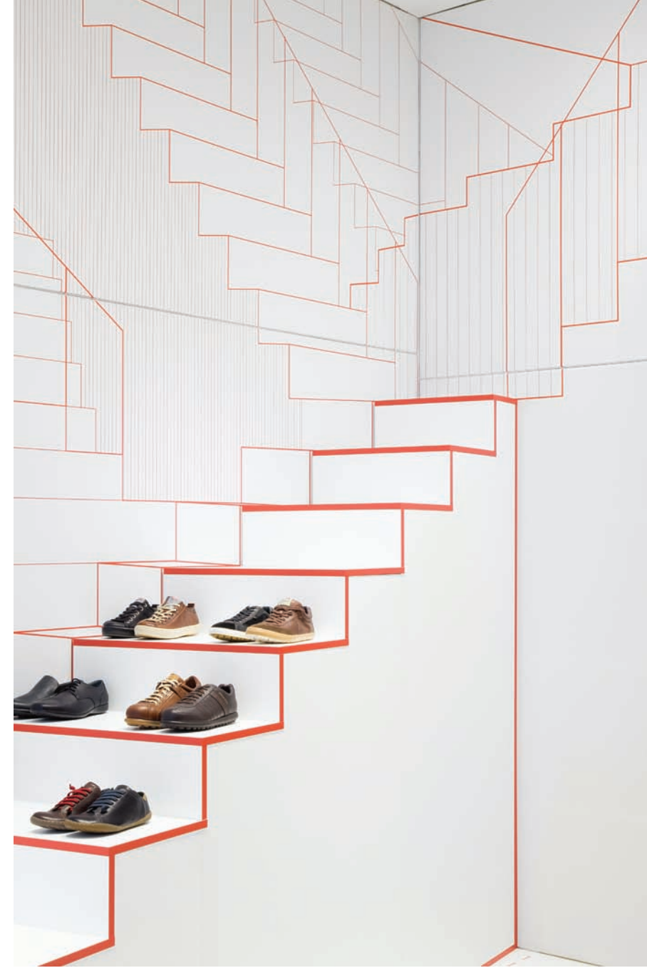
A Camper cipőboltja, Lyonban, 2012

Ha a film végét megnézzük, mindig gigantikus a stáblista. Pont ugyanez a helyzet az építészettel. Rengeteg emberrel kell együtt dolgoznod, óriási az időnyomás, de a filmrendező mégis képes a filmet