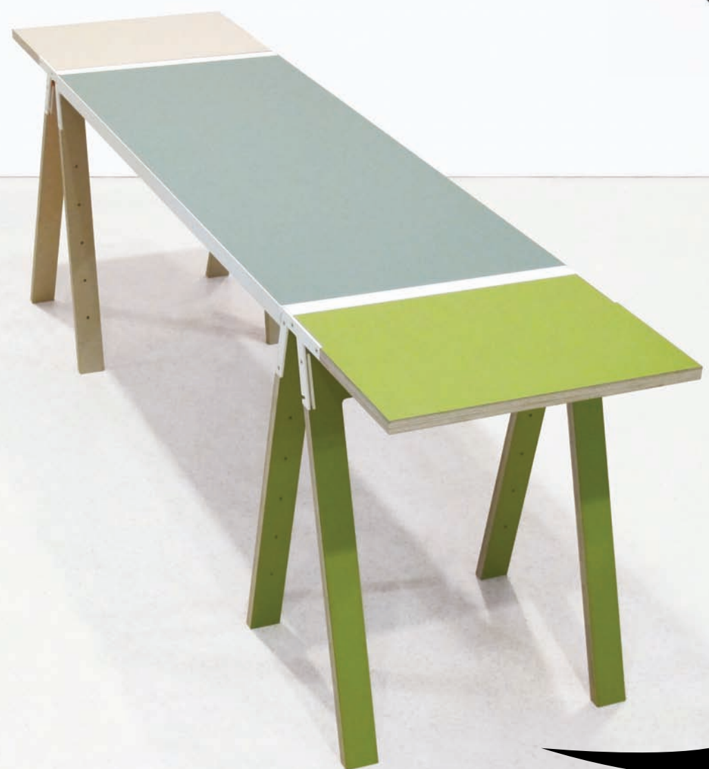
A Boijmans van Beuningen Múzeum számára tervezett, asztalokból, állványokból és festőállványból álló sorozat darabja, 2012