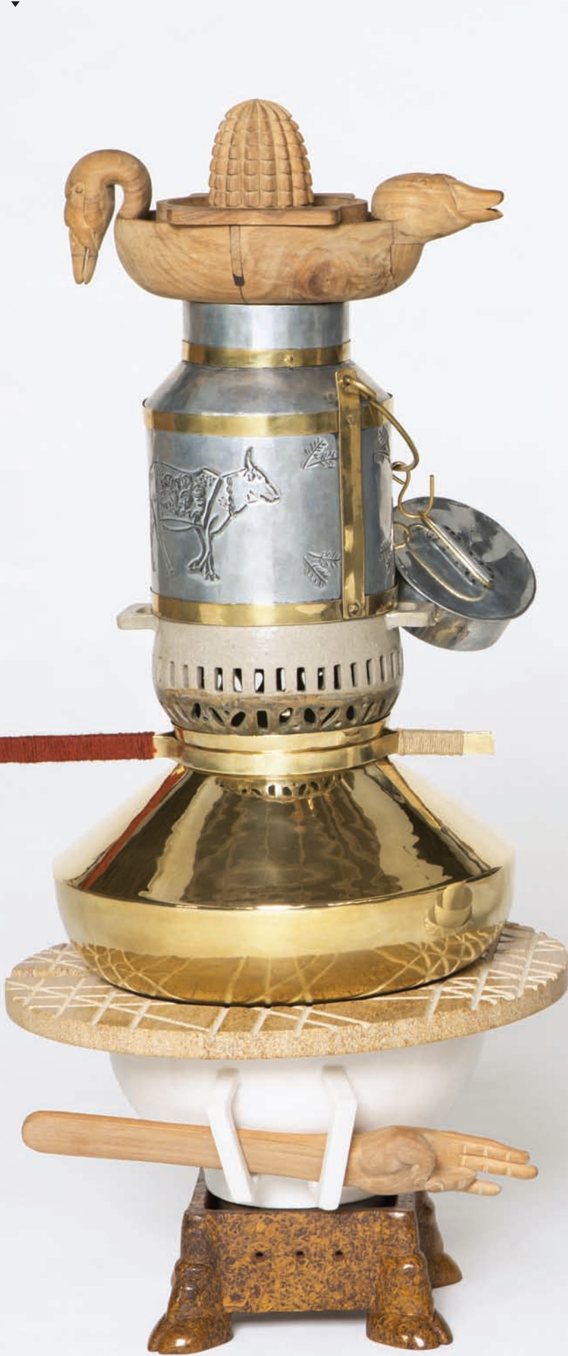
The Cheese Maker, 2014 (Imperfect Design)

használva a gravitáció ellen küzdesz, rajta egy ló szőre, aminek egy ló farkán kellene lennie, de most a vonóval mozgatod, és mivel nagyon könnyű, szinte nincs ellenállása, tehát kizárólag a mozgás teljes kontrollálásával tudsz hangot kicsikarni a hangszerből. Egy asztalt nagyon könnyű vinni, hiszen az ellenállásánál fogva kellően súlyos darab. Viszont, amikor valami ennyire pehely könnyű, akkor nagyon nehéz megtartani, hiszen egy apró mozdulat elég ahhoz, hogy más történjen, mint amit szeretnénk. Ez is egy minőség. És ez ugyanaz, mint a tánc. Ha egy jó takarítót nézel, akkor ugyanezt láthatod. Látod rajta, hogy évek óta csinálja és profi, vagy csak azért csinálja, mert most épp ezt kell csinálnia. A hatékonyságról szól a mozdulat, ami szintén igaz a táncra.