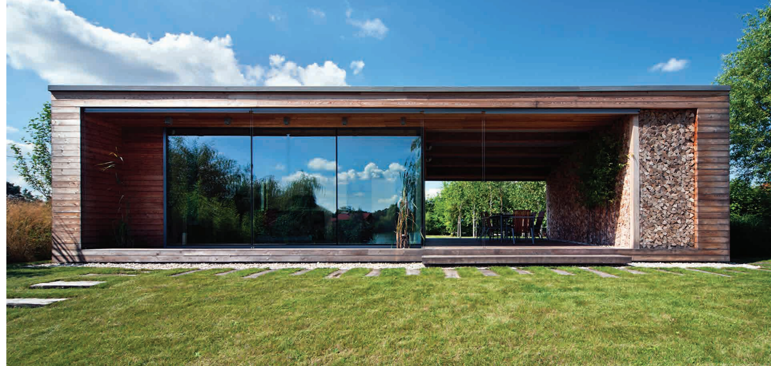
Kavicssáv öleli körbe a házat, ami egyfajta lebegő látványt eredményez

Az elmúlt években a nemzetközi építészeti folyóiratok, magazinok oldalain szép számmal láthattunk példákat parányi, ám tervezői szempontból elképesztően magas minőségben kidolgozott házakból. Ráadásul a micro-house -, a DIY -, vagy mobilház-projektek csak tovább színesítették az összképet. „Kicsit” tervezni és építeni sok tekintetben jutalomjátéknak tűnik, amiben minden részletre kellő mennyiségű figyelem fordítható. Másfelől a kicsiben minden szem előtt van, vagyis mindennek a helyére kell kerülnie, mert szinte egyetlen elhibázott megoldás üvöltő sebet üt a koncepción.