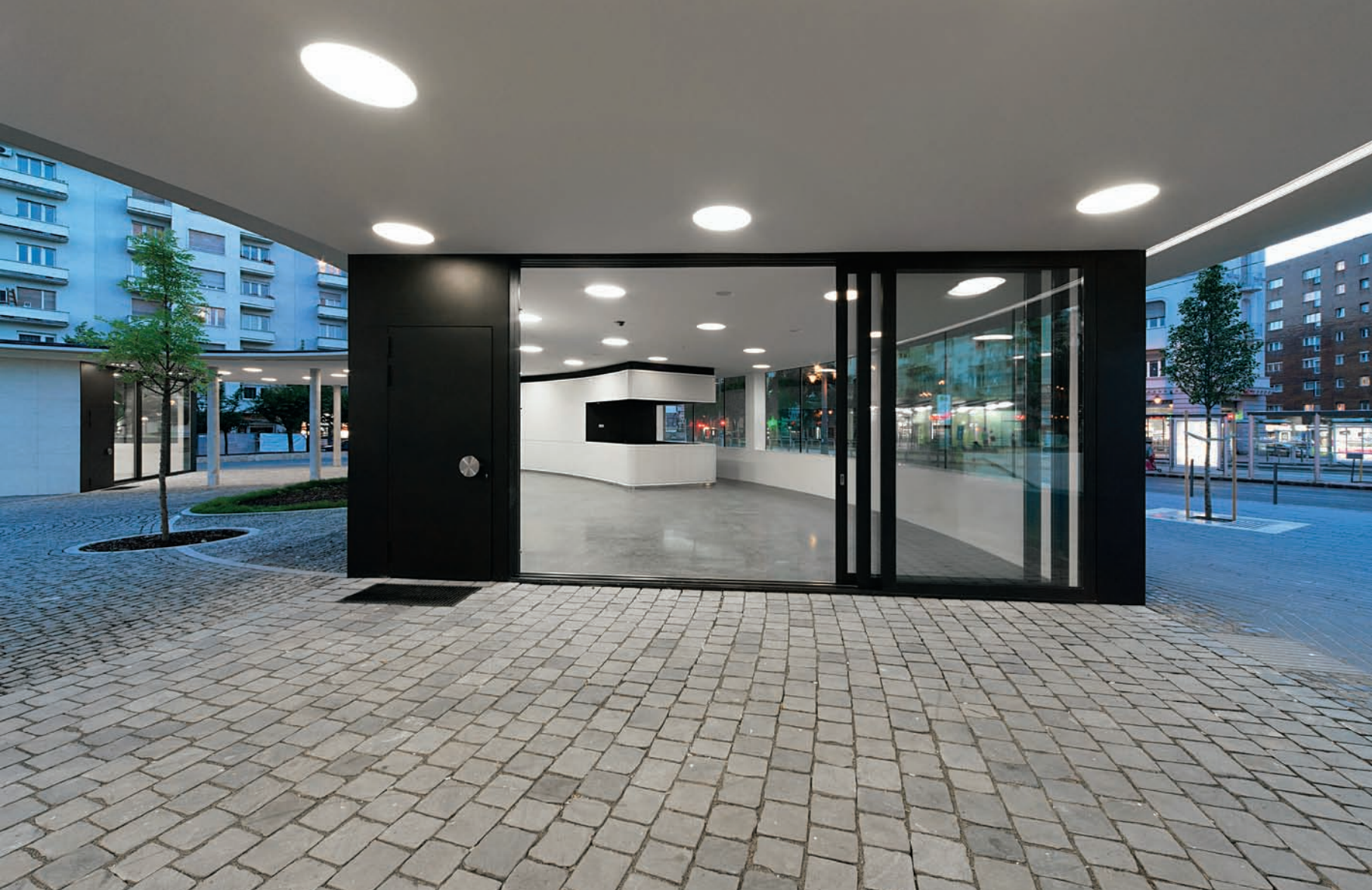
Az eredeti osztott üvegtáblák és mellvédek helyett finombeton felületek és íves üvegtáblák