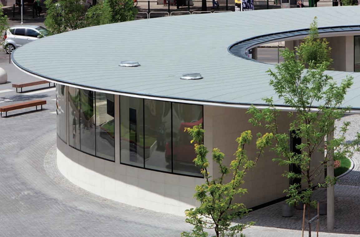
Ritmus és harmónia, a körforma önmagába visszatérő áramlása

A 4-es metró építése helyzetbe hozta a Gombát. 2009-ben Újbuda önkormányzata tervpályázatot írt ki, amelyre az építészeti-örökségvédelmi szempontok mellett hasznosítási ötleteket is várt, magyarul egy funkcióját vesztett, de esztétikai és a hely identitásában fontos szerepet játszó építmény értelmes újrafogalmazását. A feladat legalább annyira gazdasági, mint építészeti természetű, mégis vagy hetven pályázó