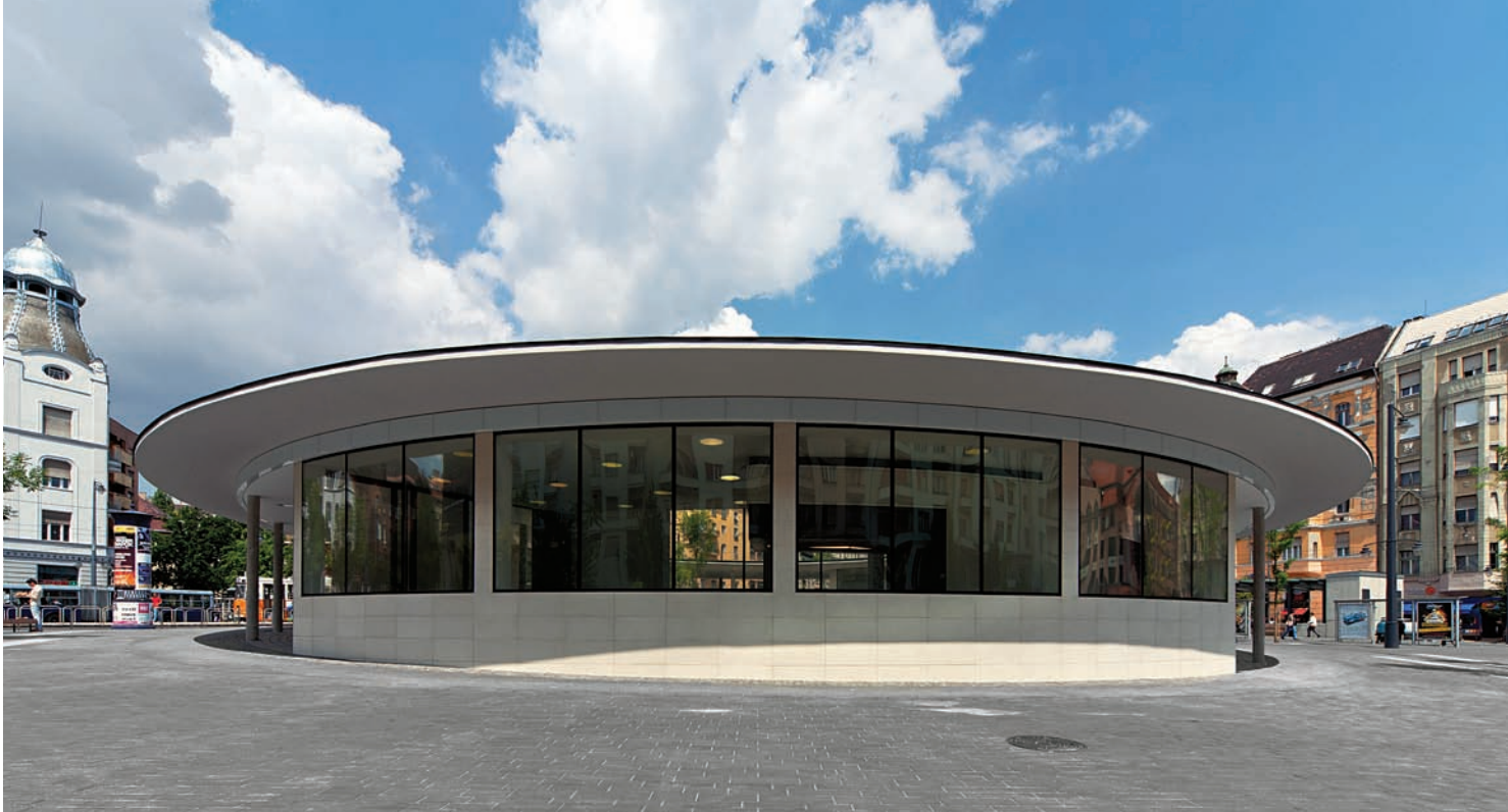
A Gomba kifinomult arányai és illeszkedése a tér mai sodrásában tökéletes

A körgyűrűs tető alá illeszkedő három pavilont, Schall József építész alkotását 1942-ben adták át, jegypénztár és bisztró működött benne, később egy domborművel díszített csobogó is került a közepére. Rövid időre Budapest egyik legszebb térkompozíciója lett, de csupán néhány év békeidőt