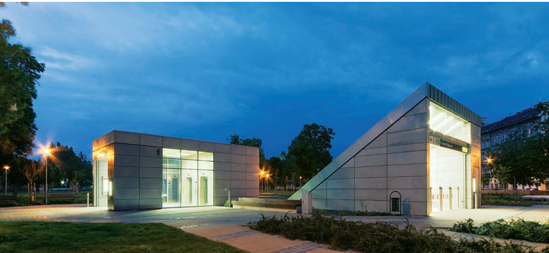
Alkonyattól a mélyből feltörő fény hívogatja az utazókat

Dobos Ivett, Zelenka Márta (Vár-Kert Műszaki Tervezési Kft.)