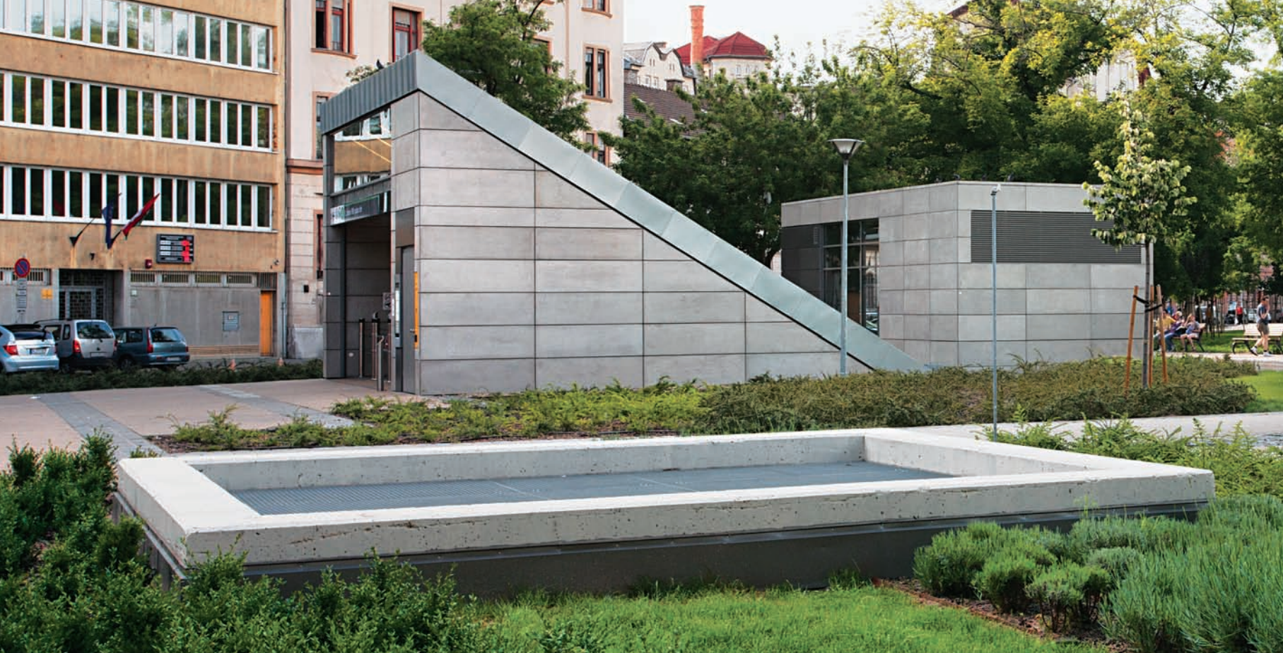
Kisléptékű pavilonok rejtik a függőleges közlekedőket

A tervezők egyetlen ponton sem estek fölösleges túlzásba, ugyanis a tér mára kialakult szerkezetét jórészt megtartották. Hangsúlyosabbá vált a főtengelyre illesztett sétány, amely a csikorgó kavics és a kockakő helyett térkő burkolatot kapott, akárcsak a teret átszelő többi útvonal. A bazaltkockákat szegélyként újrahasznosították.