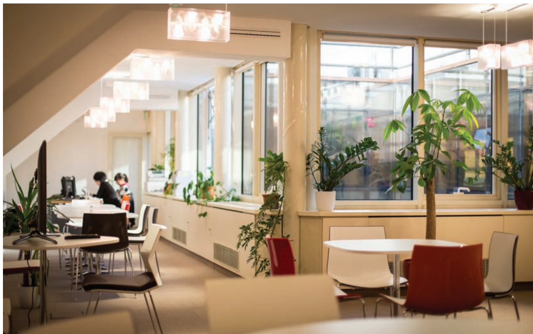
Könnyed hangulatú, modern rekreációs tér és étkező a legfelső szinten

Szöveg Molnár Szilvia