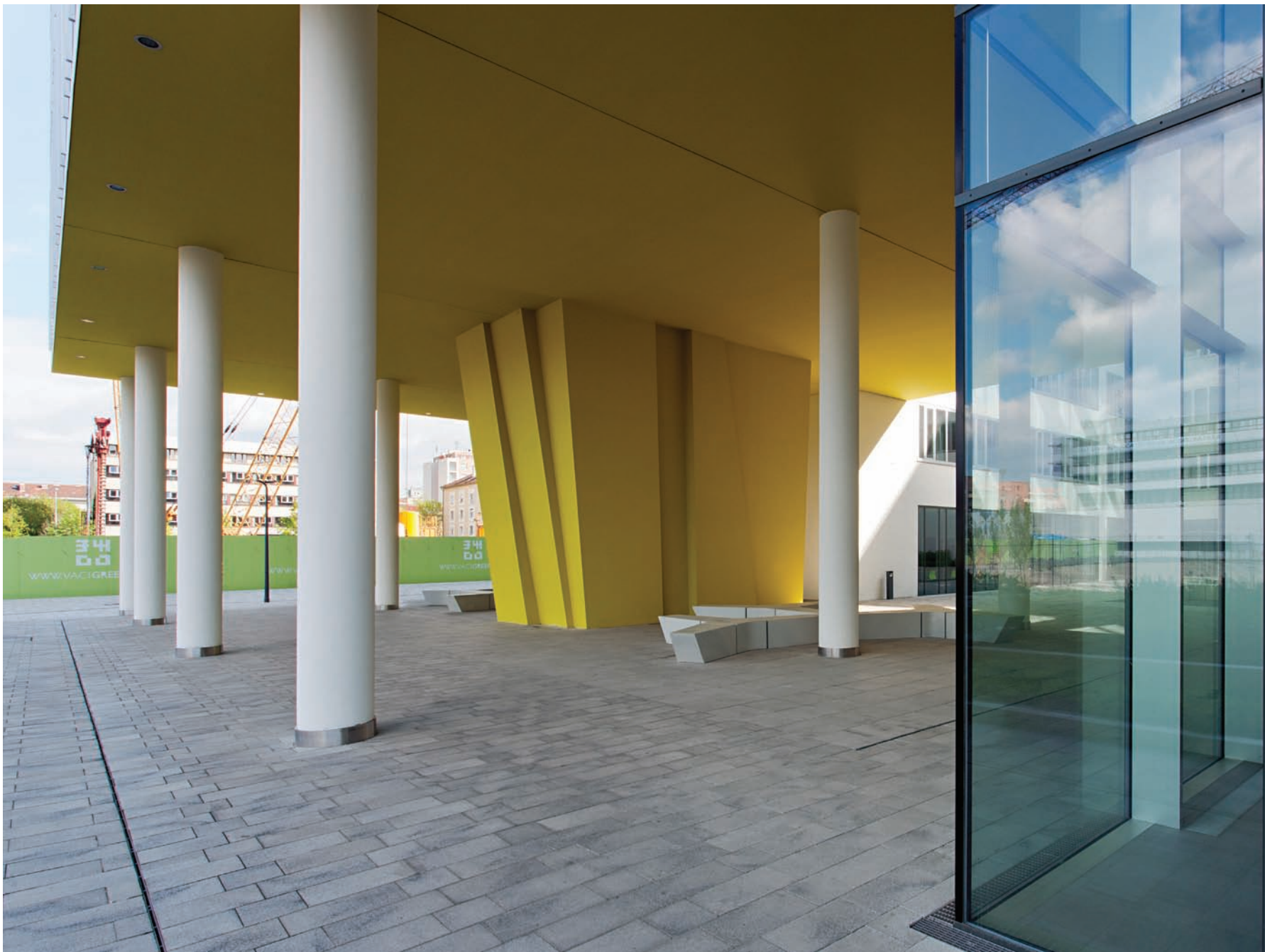
A projekt fontos része az épület körüli köztér rendezése. A jelenlegi és a később megépülő tömbök közötti passzázs és az árkádok az épületek közötti kis tér részét képezik majd A-épület. Úgy tervezték, hogy minden szinten fenntartható legyen, elnyerte a BREEAM Kiváló minősítését. 2011-ben Property Awarddal (nemzetközi ingatlan díj) jutalmazták, a legjobb irodafejlesztés kategóriában