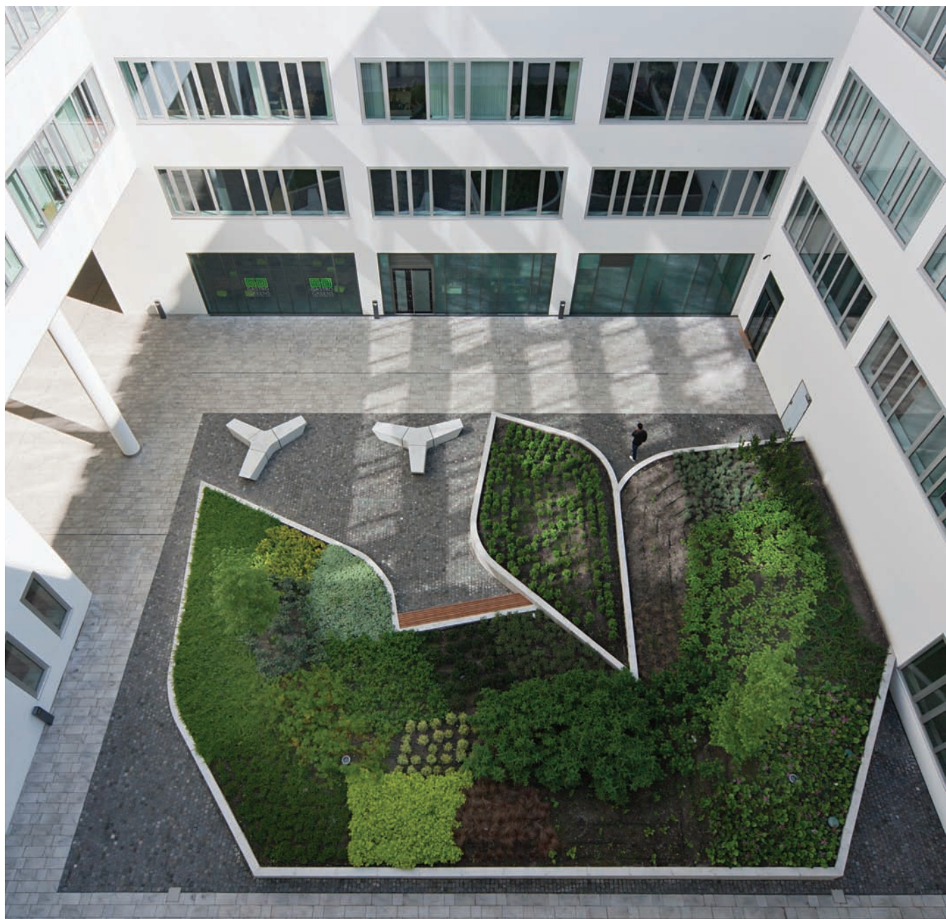
Az irodaépület körül és a belső udvarban egyaránt aktív zöldfelületeket, parterre-eket láthatunk

Miközben Budapest belvárosi részei, jórés uniós támogatásból szépülnek, rendeződnek, addig a külvárosokban – persze ez jó ideje sajátságos a honi urbanisztikai állapotoknak –, évtizedek óta jelentősebb fejlesztésekre csekély forintok jutnak csupán. Persze vannak kivételek. A XIII. kerület, például bérház-programjaira tekintve, de akár a középület-felújításokban egyaránt élen jár, fővárosi viszonylatban is. S ha végighaladunk a Nyugati pályaudvartól egészen Újpest-Városkapuig az irodai ingatlanfejlesztés sem marad el. Kérdés persze, hogy milyen/milyenre lesz az építészeti minőség és mennyire egységes a kivitelezési nívóban. Mert az említett szakaszon adták át nem olyan régen a kortárs és előremutató építészeti koordinátarendszerében nehezen elhelyezhető Váci Corner Offices-t, ám itt épül a Volga szálló helyére felhúzott, merész, sokat ígérő, átjárókkal, legyező formájú beépítésben megtervezett Vision Towers (3h