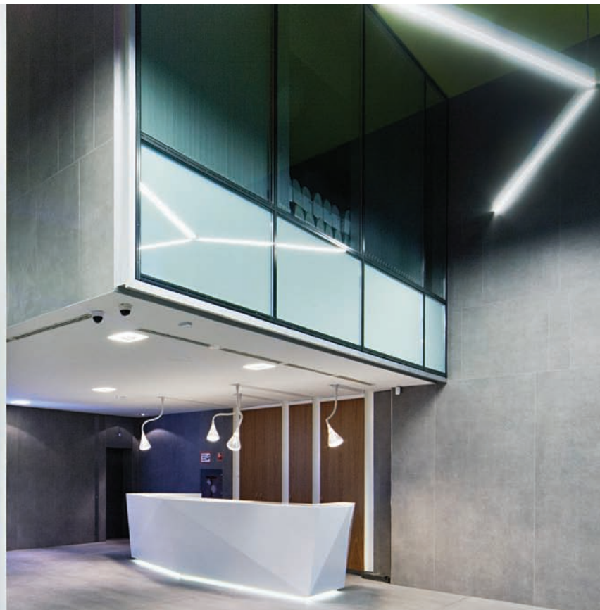
Kortárs anyagok, homogén felületek, üveg, látszóbeton

és homlokzat alakításában is a pontosan ki dolgozott részletek ellentéteinek játéka épült. A vastok konzolos alátámasztást karcú oszlopsorok kísérik, a kubusos felépítmény főhomlokzati szakaszának legfelső szintjén terasz szakítja meg a zártságot, szünteti meg a klasszikus lezárást. Harsány párbeszéd zajlik a színek között is: az éteri fehérre, és a technicista szürkére napsárga felel. A legmegragadóbb azonban a homlokzat grafikai játéka, ami már-már Tibavédjegy. Az iroda-építészet kedvelt vagy-