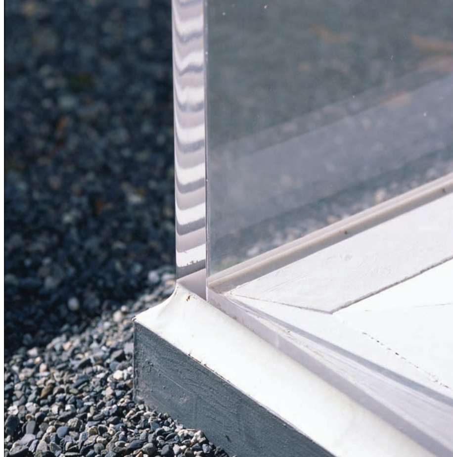
... és megépítette, akrilból