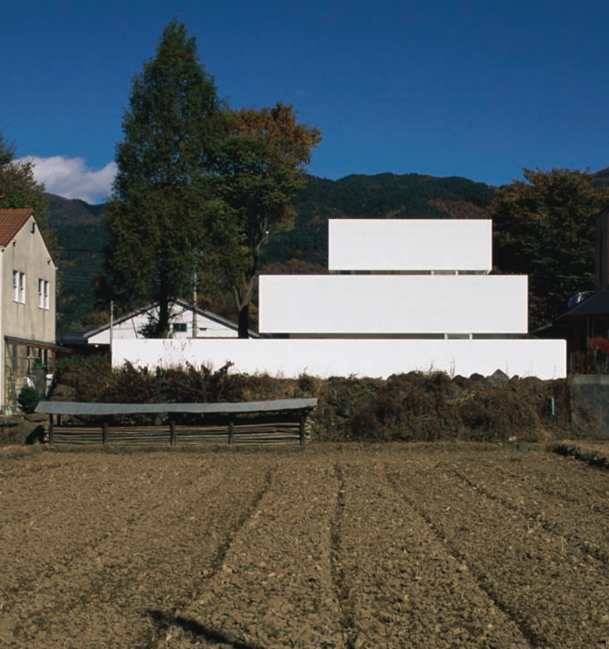
Akril Ház, ahol a megrendelő meglátott egy hibajavítóval korrigált fotómontázst...