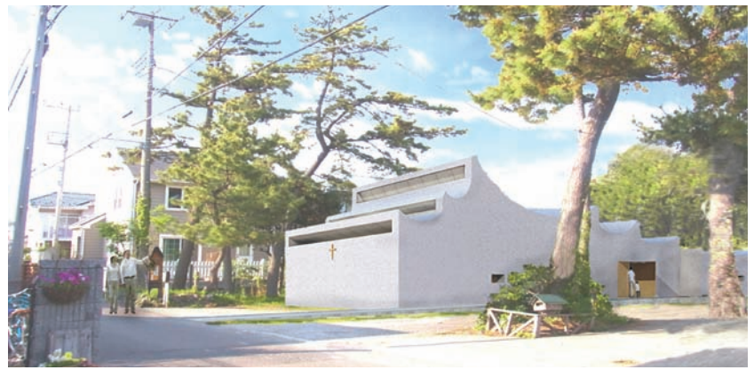
Shonan Keresztény Templom (renderek), amelybe pontos számítások alapján csak a miseidőn kívül süt be a nap, mise alatt szórt fényt kap