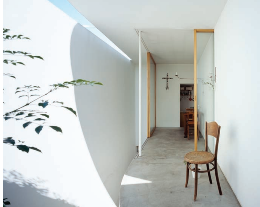
Love House, holdfény szonáta, 3x10 méteres telekre

Olyan, mint egy beavatási szertartás, amit ha túlélnek, dőlnek a jobbnál jobb megbízások.