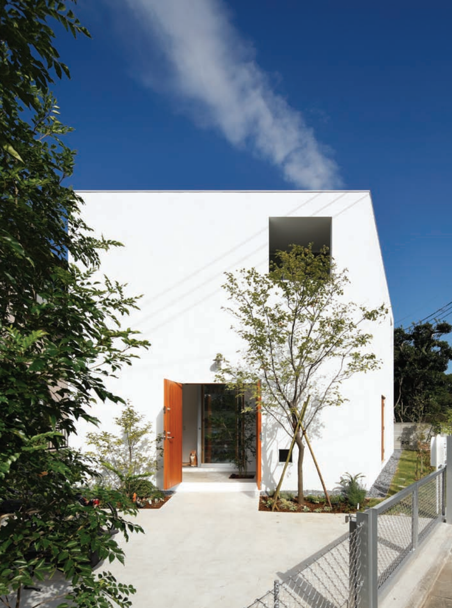
Inside Out House, ház a házban rendszer