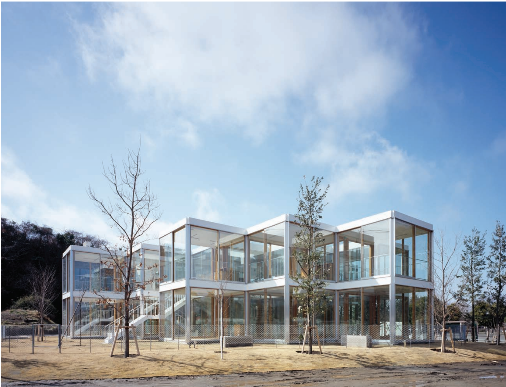
Hongodai, átlátható keresztény iskola és óvoda

HT: Legalább száz évre terveztem az eddigi épületeimet, de szeretném, ha ötszáz évet is túlélnének, bár ez egy kicsit túlzónak hangzik. Elég alaposan válogatom ki az anyagokat, de azt gondolom, hogyha a tulajdonos szereti, akkor gondos és karbantartja őket, és ez a kulcskérdés az öregedés tekintetében. Jól karbantartható anyagokkal építettem meg a házaimat.