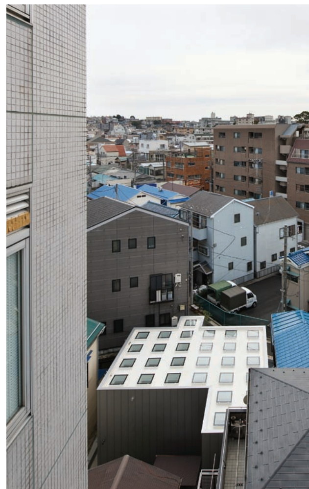
A Daylight House a megrendelő (mellesleg Herendi porcelán gyűjtő) naps házat akart sötét telken