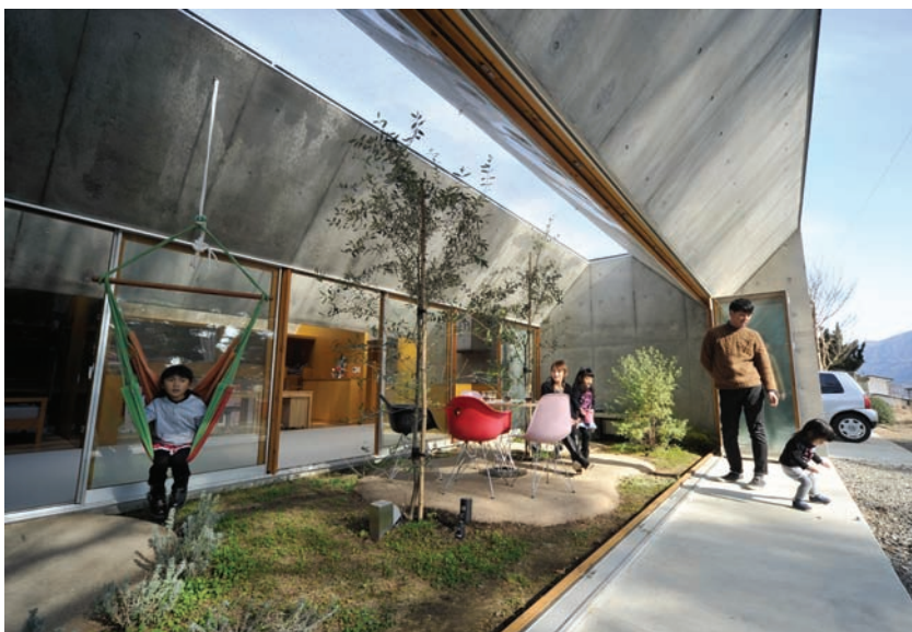
Outside In House, kertés ház, házon belül