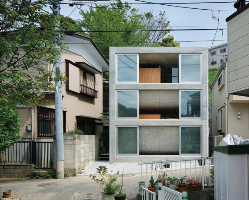
A byobugaurai ház, ahová gördeszkán jár a nap

formában lehetne csak a Tokió körül megépült mesterséges szigetrendszer annak gondolni. A metabolizmusnak – az általános ismertsége ellenére – általában nagyon kevés megvalósult épülete lett.