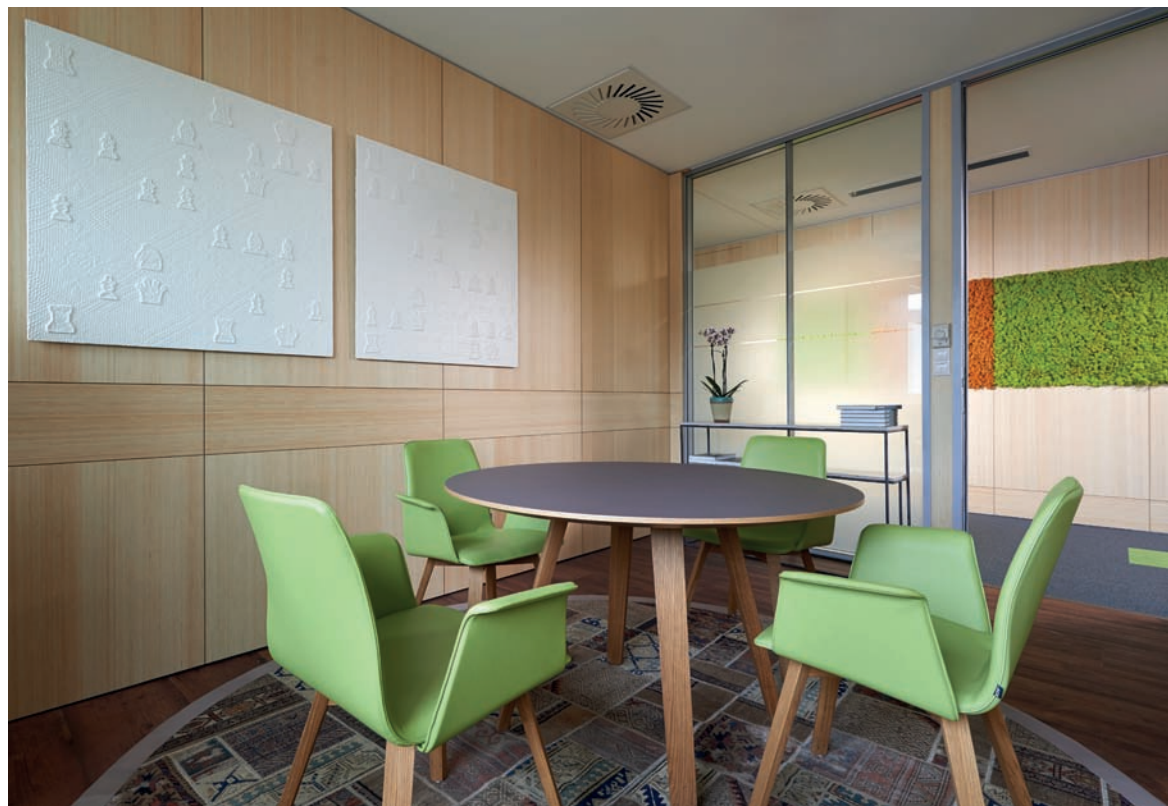
A falon kép a legendás Bobby Fischer-Borisz Szpasszkij 1972-es sakk-játszmáról

Vizuális csomópontokat mégis a műalkotások jelentenek. Az itt látható tizenhat darab alkotás az eddigi életmű különböző korszakaiból válogat. A Játszma című 2006-ban készült sorozat négy képe a legendás Bobby Fischer-Borisz Szpasszkij 1972-es sakk-játszma emlékét idézi, mikor a két géniusz között zajló napos mérkőzés lépései egyúttal az ősi szabályok konfliktusára, illetve a velük dacoló individuum egyszeri esélyére is utalnak. A Pinokkió szobor gyermekkorunk egyik kedvenc mesefiguráját hívja elő, aki miközben arról álmodik, hogy egy nap igazi kisfiú válik belőle, minden egyes füllentésért megüti a bokáját. A kacsa collage és a hét kacsa szobor arra inspirálják a nézőt, hogy új szemlélettel nézzen a közhelyre, a Bika és a Medve festmények a tőzsde szimbólumai, a nagy tárgyalóba készült kép pedig a Concorde Alapkezelő sikerét jelképezi.