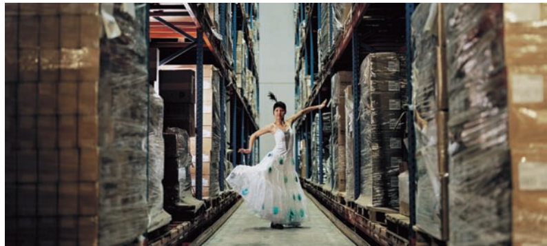
Cao Fei: A jövőm nem egy álom , 2006, videó 20' (állókép); Műcsarnok

kényszerített emberek erőszakos reakcióit mutatja be. Topográfiailag független, hogy éppen Belgrádban, Szentpétervárott, Párizsban vagy Kijevben vagyunk, a fullasztó építészeti környezet és a társadalmi kiszolgáltatottságra adott agresszív válasz mindenhol ugyanaz. A tehetetlenség, a megalázottság és a lecsúszás konkrét és szimbolikus képe jelentkezik Francis Alys Próba-sorozatában, a felesleges és hiábavaló mozgással teremtve meg a bódéváros szélének reménytelen helyzetét. A kivetettek és perifériákra vetettek városi életének bemutatása köti egybe a műveket. Járjunk akár Nápolyban, New Yorkban mindenütt velük találkozunk. Tobias Zielony Le Vele di Scampi 7000 fotográfiát filmszerűen egybevonó sorozata nem a turisták által csodált Nápolyba kalauzol, nem a romantikus zezzugos utcák történetét meséli, hanem egy a környezettől idegen betonkomplexum életébe és haldoklásába tekintünk bele. Haldoklik morális értelemben, hiszen lakói, ahogy életüket, úgy magát az épületet is elhanyagolják. Nem rendezett lakássá, hanem büntanyává alakítják, az egyébként térszervezési szempontból átgondolt, bonyolult házat. Matta-Clark Városforgácsok és Tűzgyermek című munkáiban még