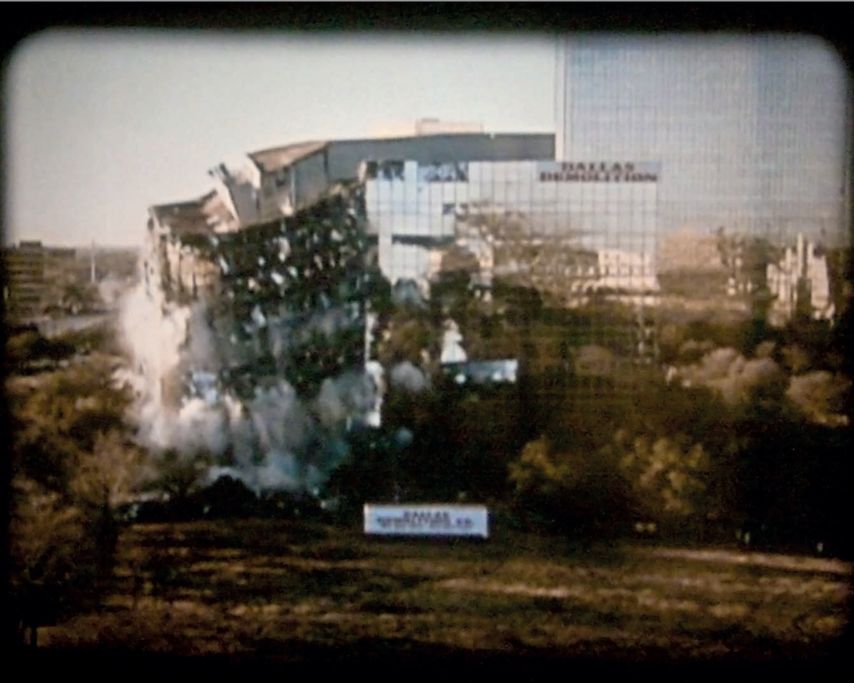
Cyprien Gaillard: Az arany és tükrök városai, 2009, 16 mm-es film, 8' 52" (állókép); Mücsarnok

Egy város entrópiája szerző: Uhl Gabriella