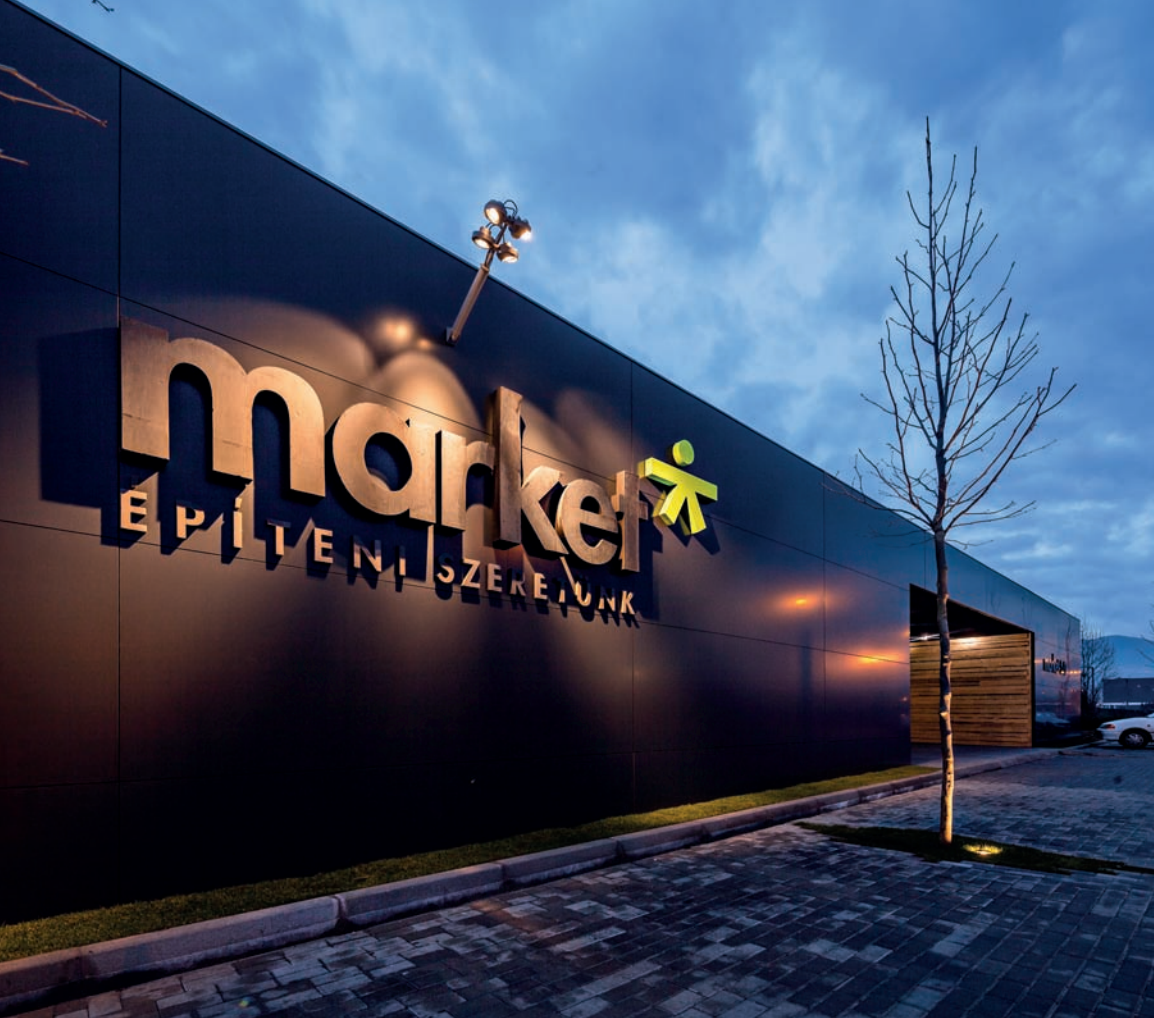
A melléképületen átvezetett kapuzat fa bélést kapott