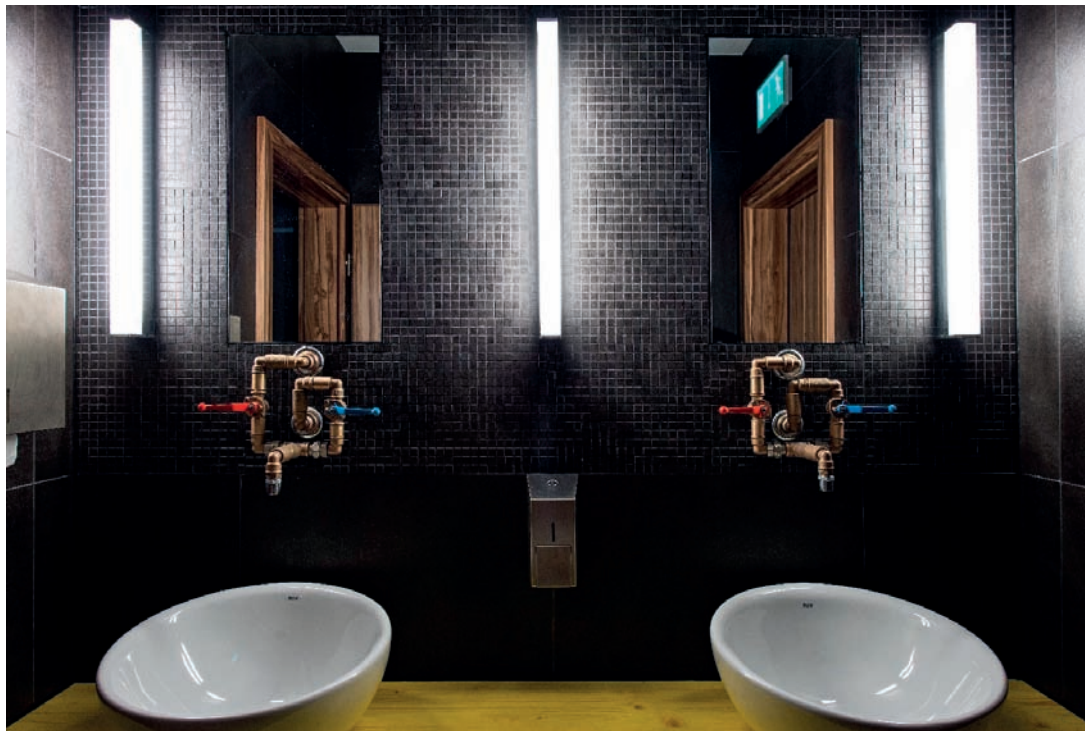
Rézcsövekből, zsalutáblákból, építési állványokból áll a vizesblokkok rendhagyó bútorzata

Annak ellenére, hogy a csarnok tere, léptéke lenyűgöző, az új irodaházban járva lépten-nyomon az alkotó emberre alakított gesztusokkal lehet találkozni. Néhány éve Zimmermann Zsolt grafikus tervezte meg a Market pálcikaemeres logóját, ami azt szimbolizálja, hogy ez a cég a személyesre koncentrál. Az iroda pontosan ugyanerről az értékrendről beszél, más eszközökkel, más léptékben, de ugyanolyan szenvedéllyel.