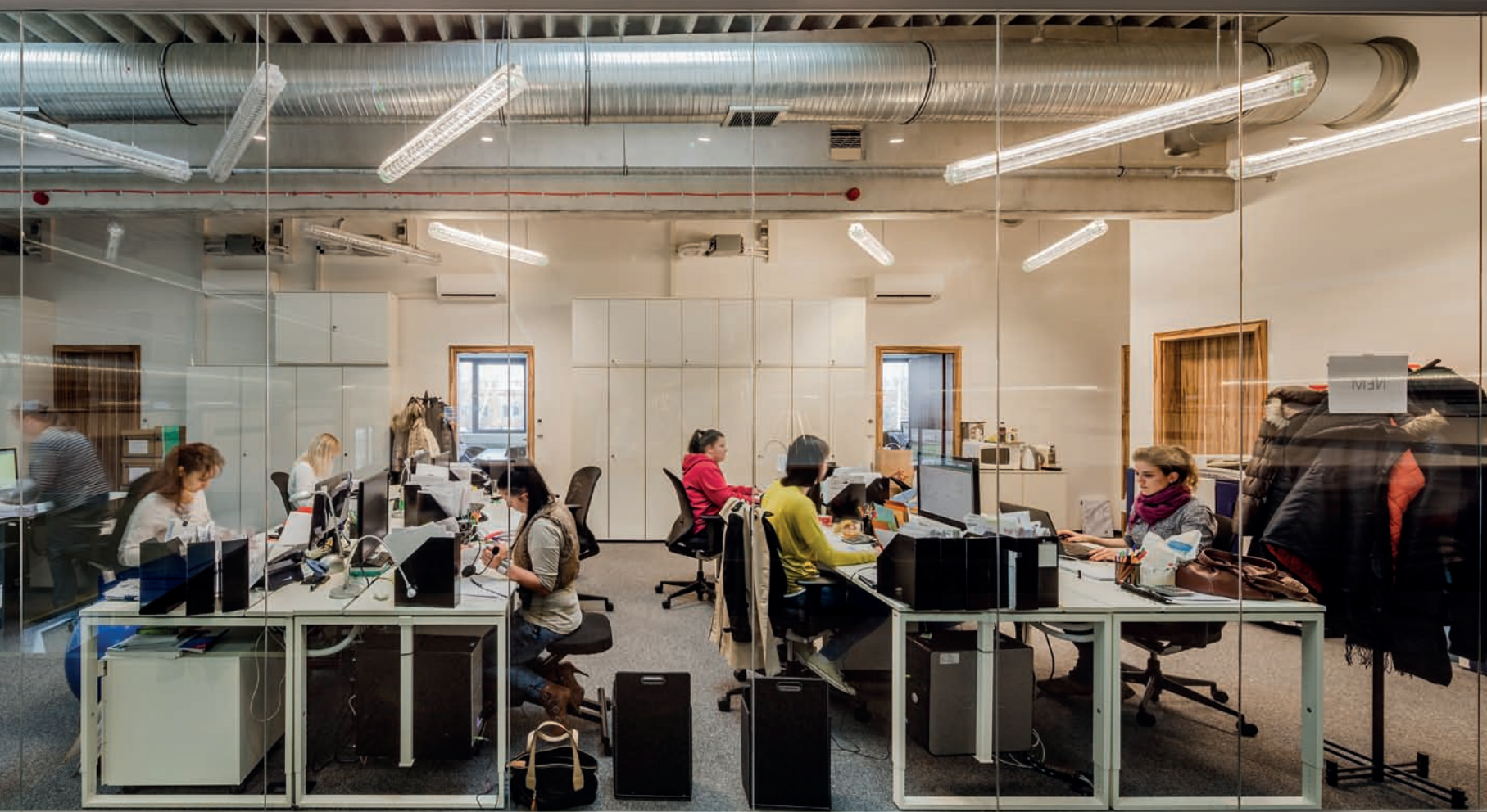
Burkolatlan gépészeti elemek eredményeznek izgalmas, industriális látványvilágot a belső terekben