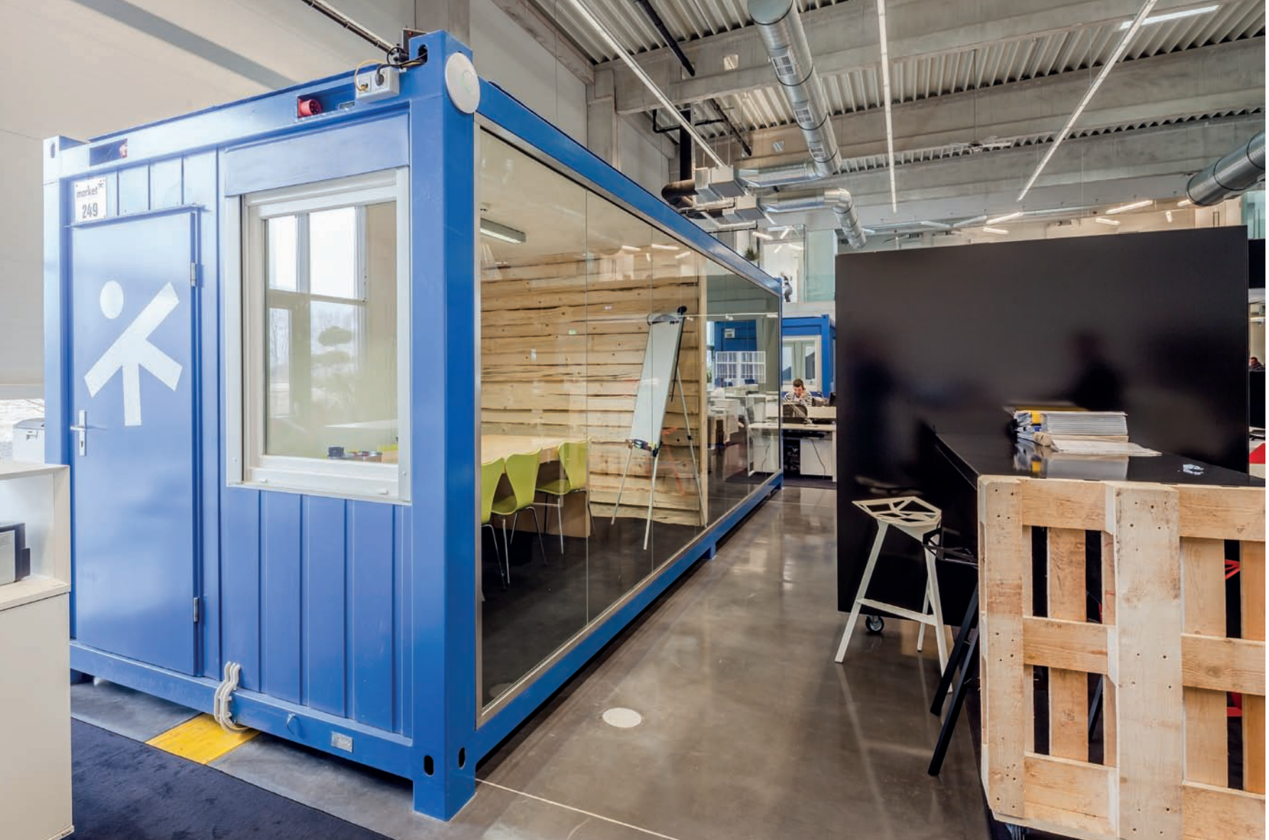
A korszellemnek megfelelő módon jelenik meg a recycling. Konténer tárgyaló, raklap pult a munkatérben