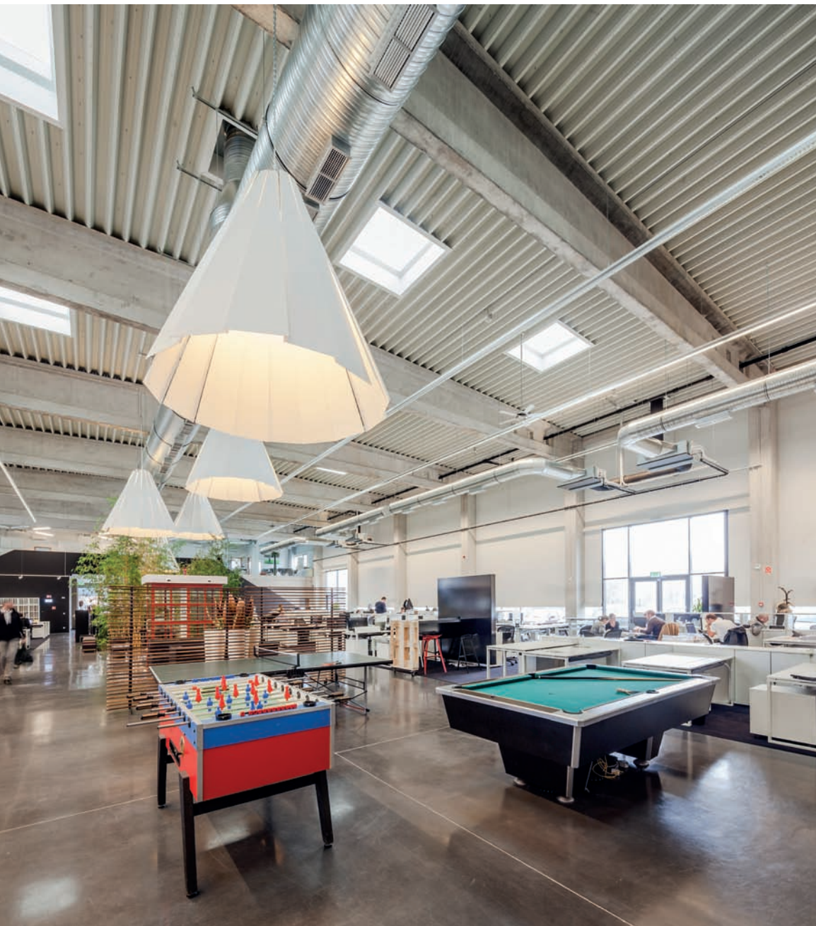
A hatalmas léptékű belső teret bátran befüggesztett egyedi lámpatestek tagolják