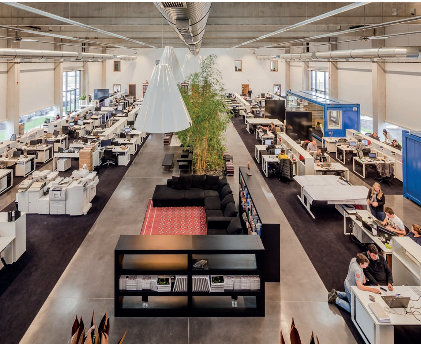
kanapés lounge-sziget és bambuszliget jelöli ki a irodabelső középítő tengelyét