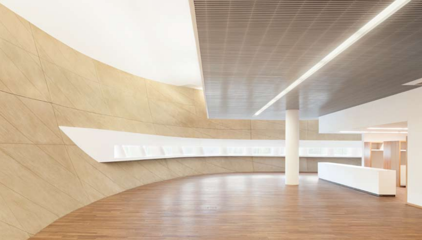
A görbült felületek következetesen kísérik végig a belső tereket