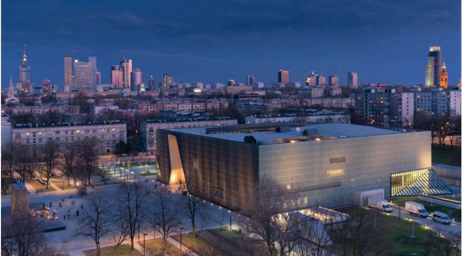
A koncepció kettőssége a főhomlokzaton érvényesül a leghatásosabban