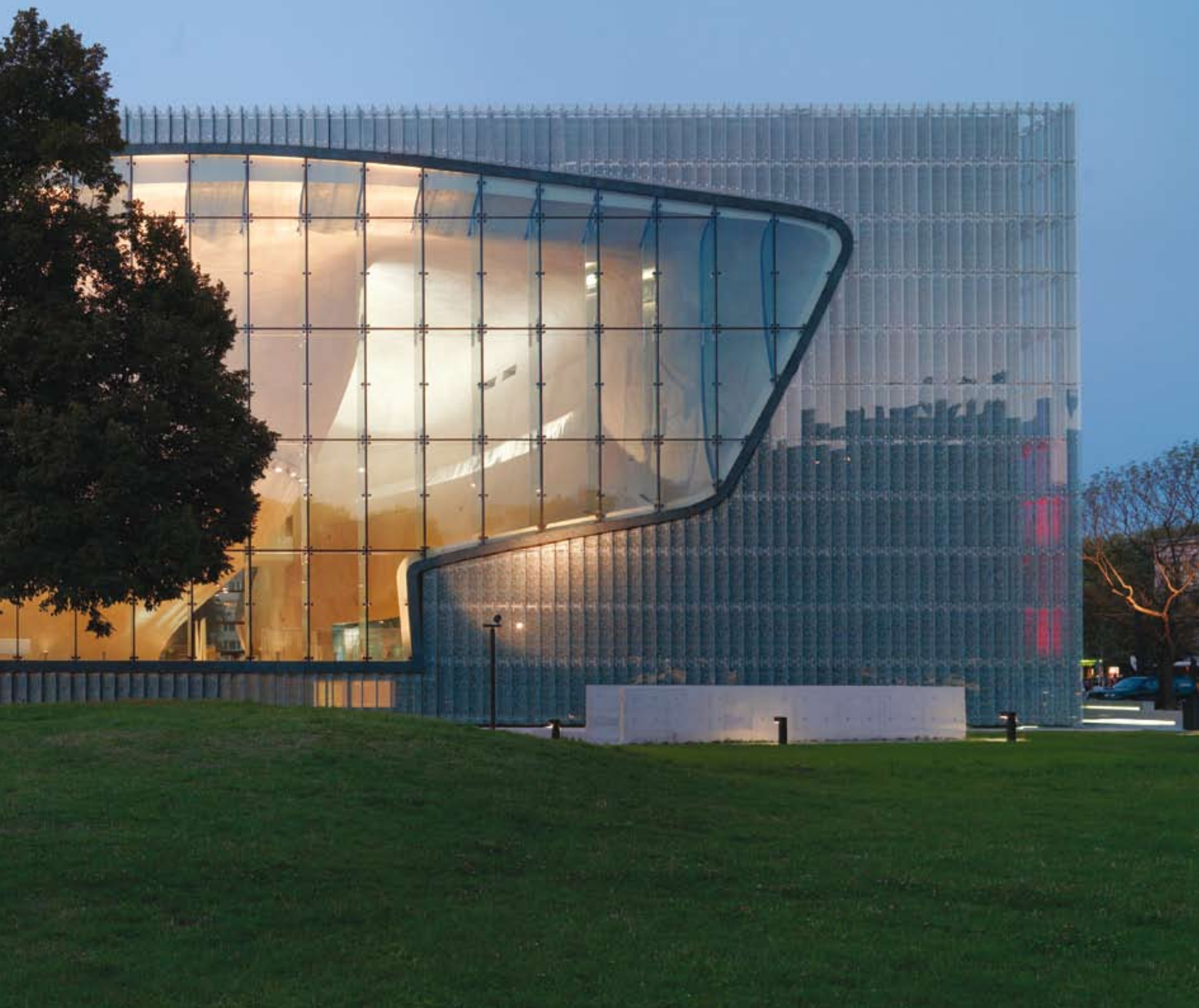
A szigorú külső forma és a belső tér lágsága erős kontrasztot képeznek az épület homlokzatain – Fotó: Wojciech Kryński

A múzeum kialakításának a szándéka '90-es évek közepéig nyúlik vissza. Az alapkoncepció és a kiállítás előzetes terve 2003-ra állt össze, egy több mint 100 fős nemzetközi kutatócsoport munkájának eredményeként, amelyet a washingtoni Holokauszt Múzeum alapító-igazgatója, Yeshayahu Weinberg