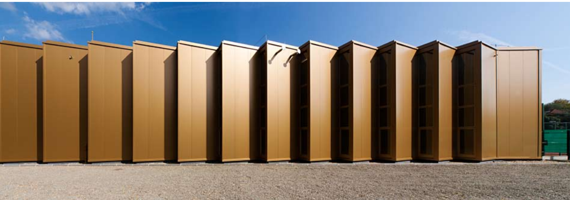
A befordított, függőleges sávablakok kívülről zártságot sugallnak