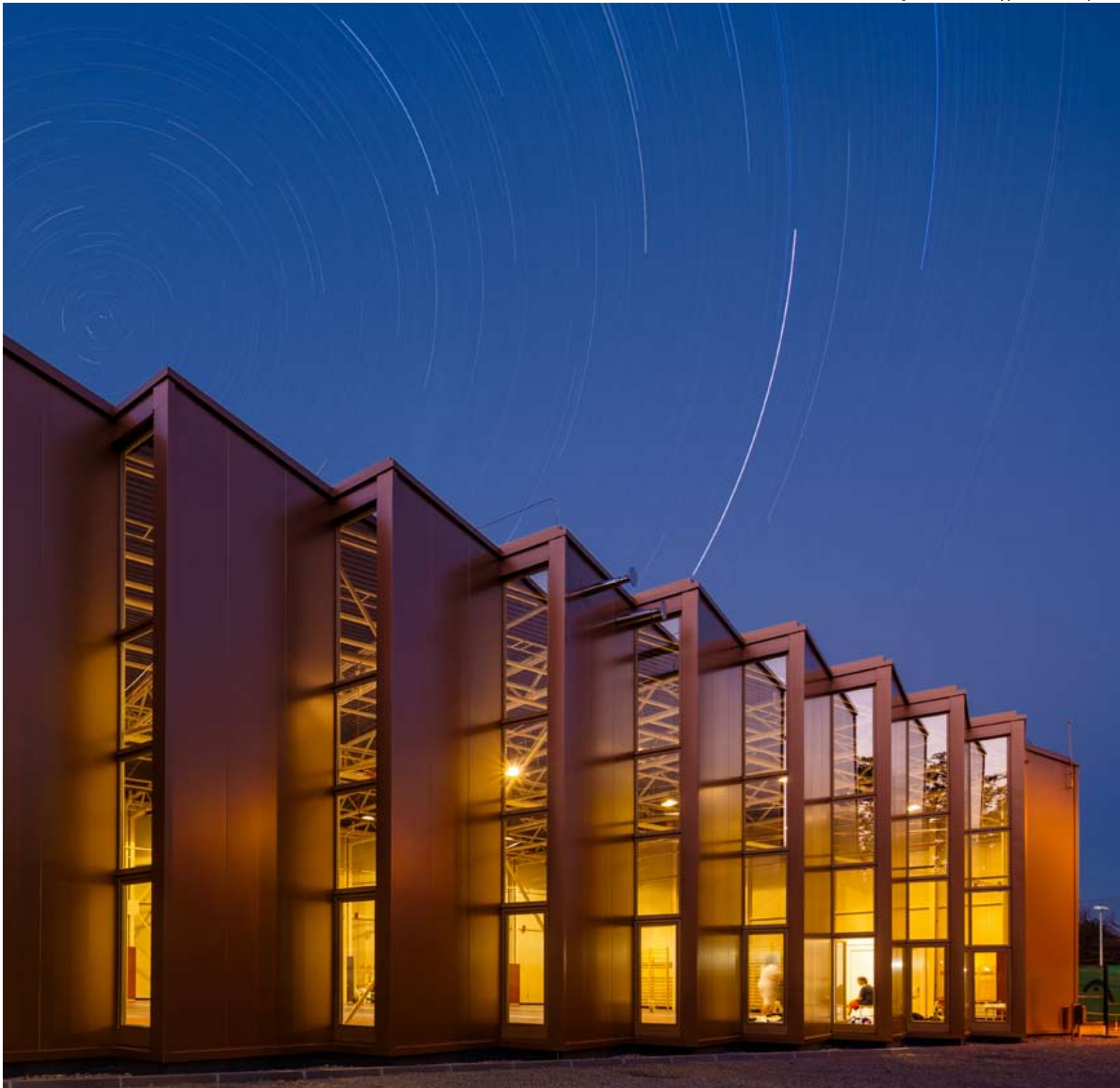
A ház este él igazán

asztalra is, a győzelmét megörökített pillanat már a homlokzatot díszíti. (Az átépítés terveit 2012-ben a Trimo Architectural Awards Future Dreams Award -kategóriában ítélték a legjobbnak – szerk.)