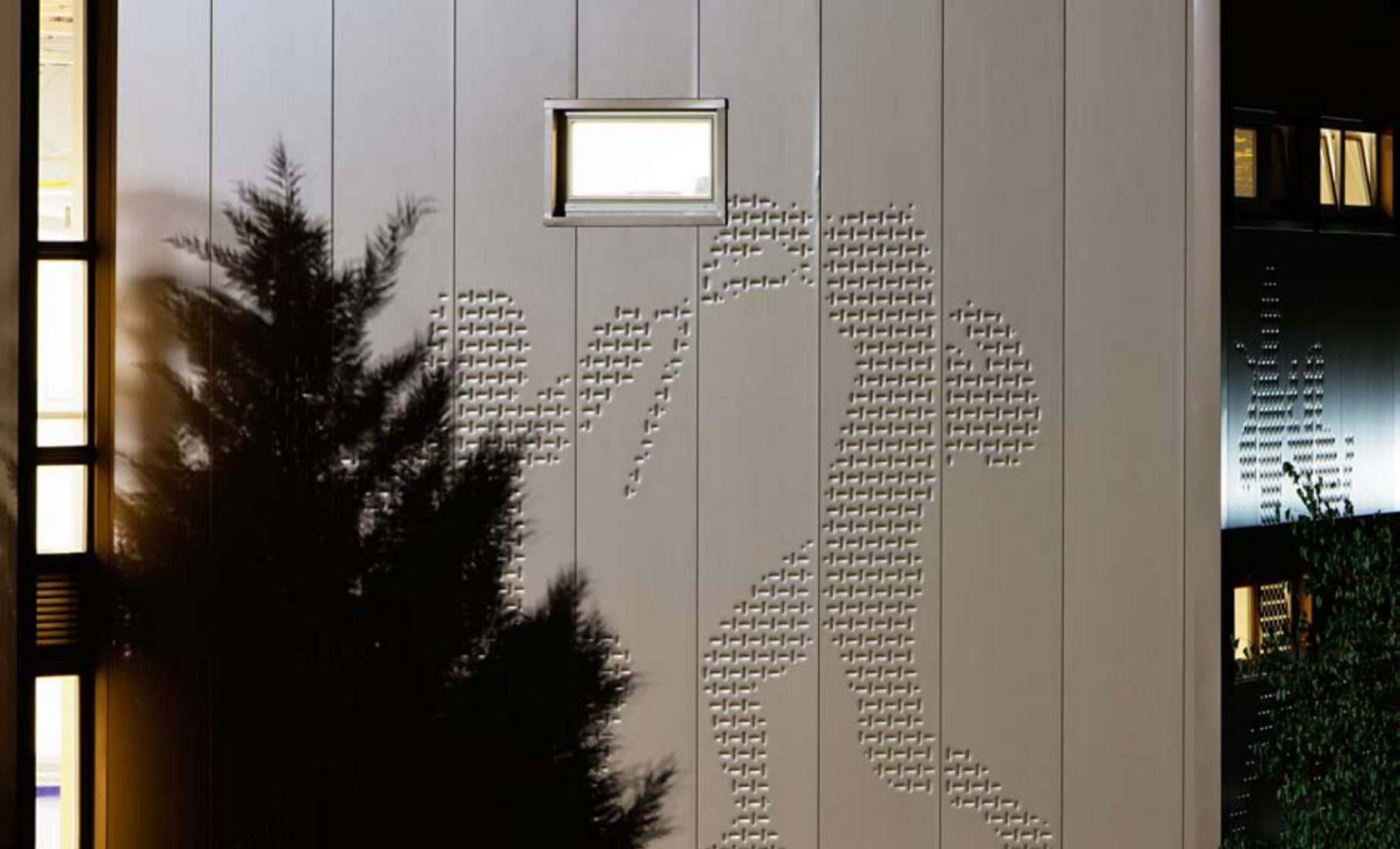
Az aranszínű burkolat napszaktól és fénytől függően különböző árnyalatokat vesz fel

A Sportklub-ház valamikor a Budapesti Budai Tornaegylet (BBTE) székházának épült, 1939-40-ben Korozai Vilmos tervei szerint, modern stílusban. Az út kanyarulatát követő vasbetonvázas épület íves, részben földszintes és részben emeletes. A karakterét meghatározza a két, a Pasaréti út felé félhengerben végződő lépcsőháztorony, ami összefogja a négyemeletes középrészt. A klubház oldalszárnyai kétszintesek és teljes alapterületén tetőteraszosak. Konyha, büfé, étterem, díszterem, irodák, tornaterem kaptak helyet az épületben. Az épület oldalszárnya a földszintig klinkertégla-burkolatot kapott, egyébként vakolt. A vívócsarnok, mely eredeti tervezőjének kiléte mára a homályba vész, a déli szárnyból közelíthető meg.