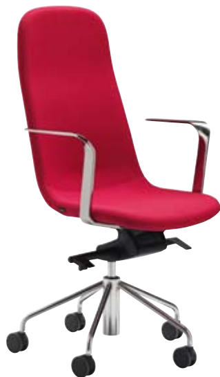
NEO SZÉK Gyártó: Materia Forgalmazó: Kinnarps Hungary Kft.

Funkció: oldalfalra szerelt lámpatest Anyag: alumínium Ár: 59 610 Ft