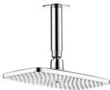
RAINDANCE SELECT 240 FEJZUHANY Hansgrohe www.hansgrohe.hu

Design: Phoenix Design Funkció: showerpipe zuhanyzóhoz Anyag: réz öntvény Ár: 245 435 Ft (bruttó ár – szeptember 30-ig)