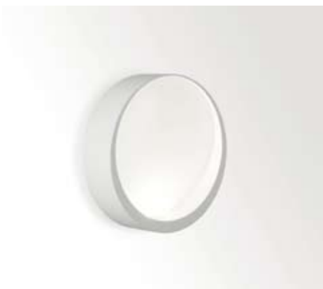
SKELP ON Delta Light Forgalmazó: be light! www.belight.hu

A Skelp On oldalfali lámpatest formavilágát a Nyugat-Flandria védjegyének, és egyben gasztronómiai különlegességnek számító kagylóról nyerte. A LED-es termék kellemes indirekt fény ad, vékony kialakítása miatt kis helyiségekben, szűk folyosókon is alkalmazható. Oldalfalba süllyesztett, keretes és keret nélküli típusban is bemutatták.