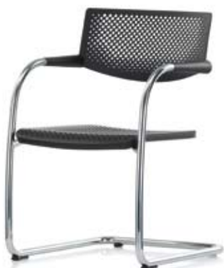
VISAVIS 3 VITRA Forgalmazó: do work! www.dowork.hu

A Budai Várban található Baltazár egy igazi gasztronómiai lubickálóközpont, borbárral és külön borbolttal. Több mint 300 tételes borválasztéka és Terra Hungarica flagship boltja a legjelentősebb autentikus borokat kínálja, elsősorban a Kárpát-medencéből. Ár: 1500 Ft-tól – 5000 Ft-ig