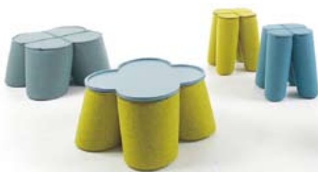
TREFLE NOTI Forgalmazó: do work! www.dowork.hu

Funkció: fejuhany Anyag: réz öntvény Ár: 82 640 Ft (bruttó ár – szeptember 30-ig)