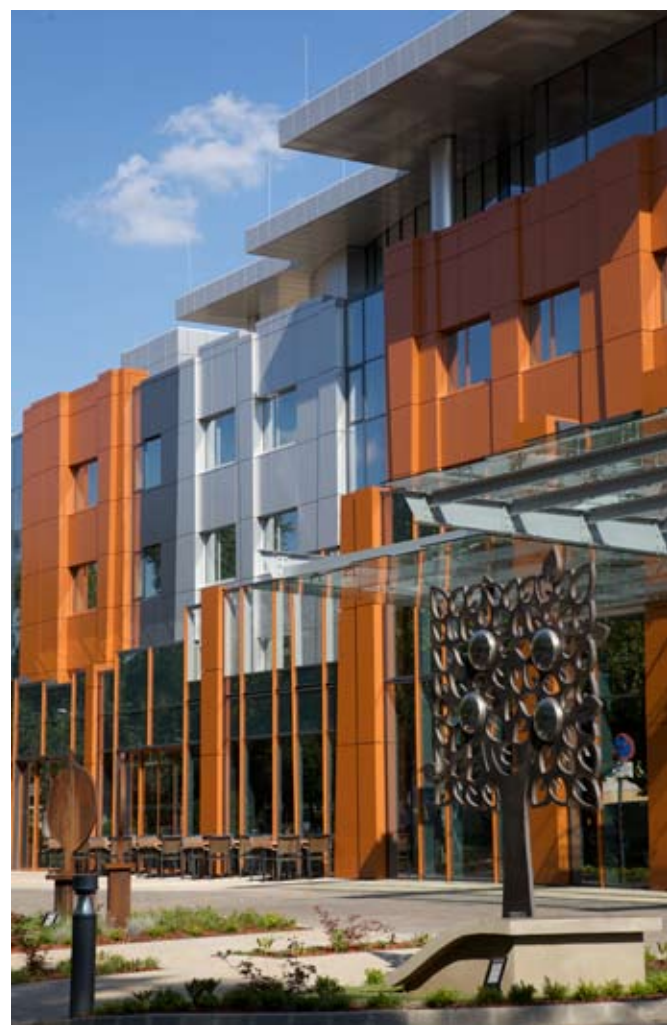
A tömeg kialakításánál inspirálólag hatottak az Izsáki úti védett platán fák

színezéssel, s különösen a főbejáratot hangsúlyozó előtetőrendszer esetében az üvegkiegészítések alkalmazásával sikerült megszüntetni a korábbi monotonitást, s az átszabás egyúttal határozott építészeti karaktert is adott az épületnek. Elsősorban az üzleti utazók igényeire szabott szállodában 130 szoba, 5 lakosztály és 1 penthouse, valamint 200 fős étterem kaptak helyet, a szekcionálható konferenciaközpont pedig összesen 1400 m 2 -en épült meg. Az enteriőr kialakításra a tereket érvényesíteni hagyó egyedi mobilíák alkalmazása, az üde színek – natúr és krém – kiegészítésben a barna-fekete dominanciája jellemző.