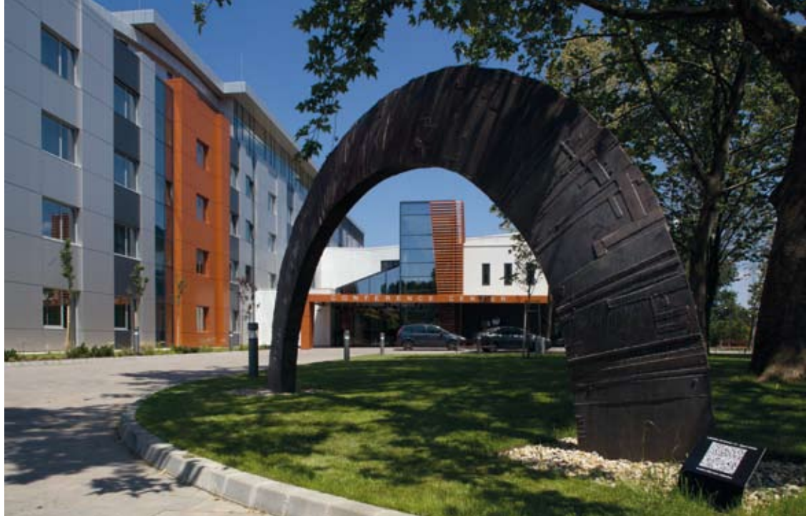
Konferencia Központ bejárata, kortárs alkotásokkal

Az épület környezet-tervezése során a kerttervező törekedett az épületre jellemző ferde vonalvezetést megjeleníteni a zöld felületek kontúrjainál. Az épület körüli parkban a tulajdonos által támogatott kortárs képzőművészek acélszobrai kaptak méltó helyet. A főbejárat előtt a hotel „al-brand” szobor-logója, egy acél sárgabarackfa került elhelyezésre