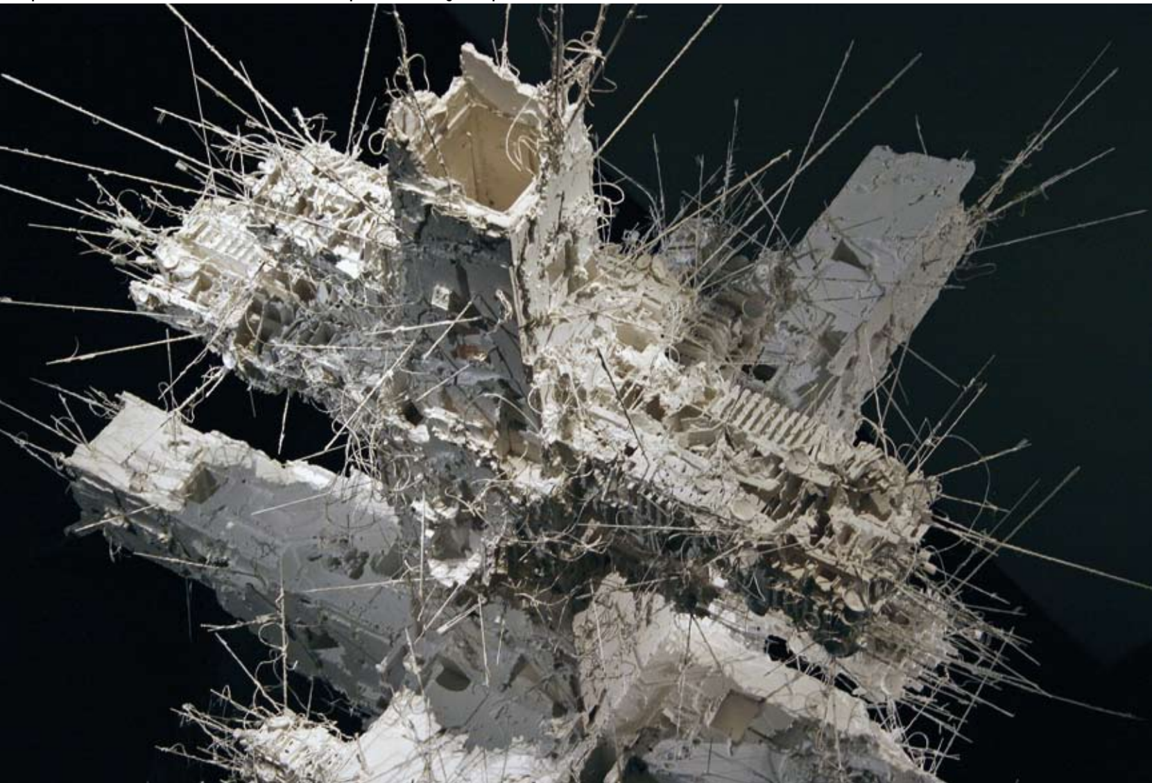
2010-ben az Imperial War Museum North felkérésére készítette Judah azt a 7 méteres, kereszt alakú installációt (The Crusader), aminek témája és technikája korábbi festményeivel függ össze – építészeti makettek átalakításával hozta létre a háborús pusztításokat megidéző, plasztikus formát