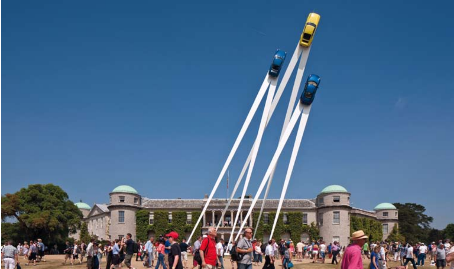
A 35 méter magas szobor Judah legfrissebb, 2013-as autópári megbízása. Az ikonikus, Porsche 911-nek szentelt alkotás 22 tonnánál is többet nyomott

A festményeire visszatérve. A képek mindegyike, ahogy már említette is, a disztópia jegyében születtek. Mesélne arról, miért kezdett el kísérletezni az építészeti makettekkel a vásznon?