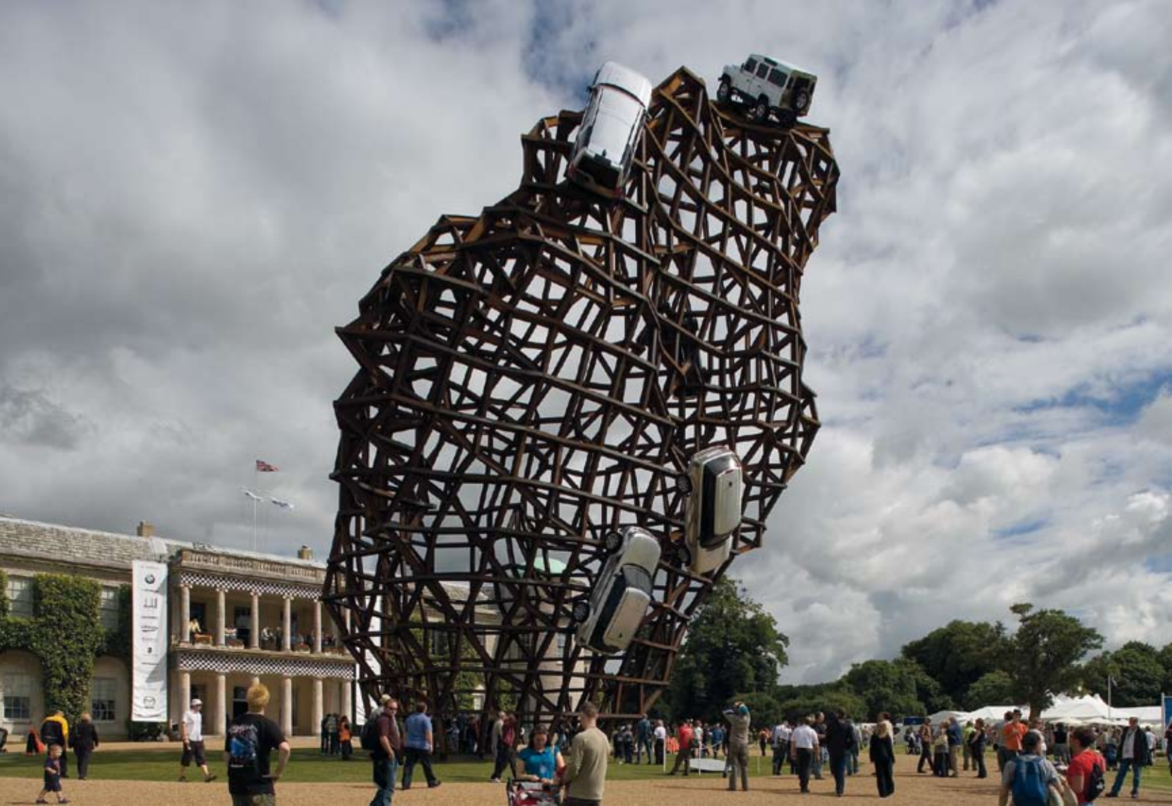
2008-ban, a Land Rover megrendelésére készült ez a 34 méter magas, 25 méter széles, sziklára emlékeztető szobor, amelyet a művész olyan struktúraként tervezett, hogy a szemlélő átláthasson rajta. A Meccano játék fém, elemes rendszerének analógiájára, egyhónapos munkával készült el az installáció