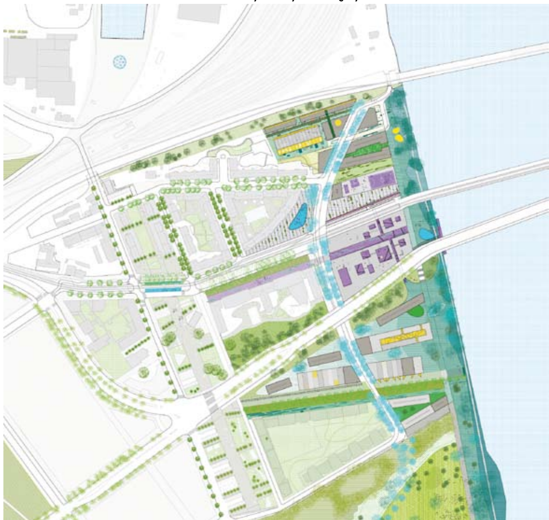
Van mit átalakítani a francia oldalon is, a kelet-nyugati kapcsolatok mellett az észak-déli irányokra helyezik a hangsúlyt – © LIN Architects Urbanists

Ma már nem kérdés: ahol van víz, a városok abba az irányba (is) terjeszkednek – ez Strasbourg és Kehl esetében sincs másképp. Fokozván ezzel a folyó fizikai és szimbolikus jelenlétét, ugyanakkor elnyelve a merev infrastrukturális vonalakat, és azokat egy új, városi környezeté transzformálva. A Rajna, mely egykoron elválasztotta a két várost, integráló erővé válik. A projekt sokkal inkább tekinthető flexibilis, mint szigorú tervek összességének, tulajdonképpen a funkciók kihasználási lehetőségeinek mátrixa, mely kellő rugalmassággal alkalmazkodik bármilyen körülményhez. A legfontosabb a kialakítandó dialógus a folyó és a táj között: francia oldalon sűrű beépítettséggel és nagyvárosias jelleggel, német oldalon több zölddel és a kikötői funkció erősítésével. Két identitás, egy folyó.