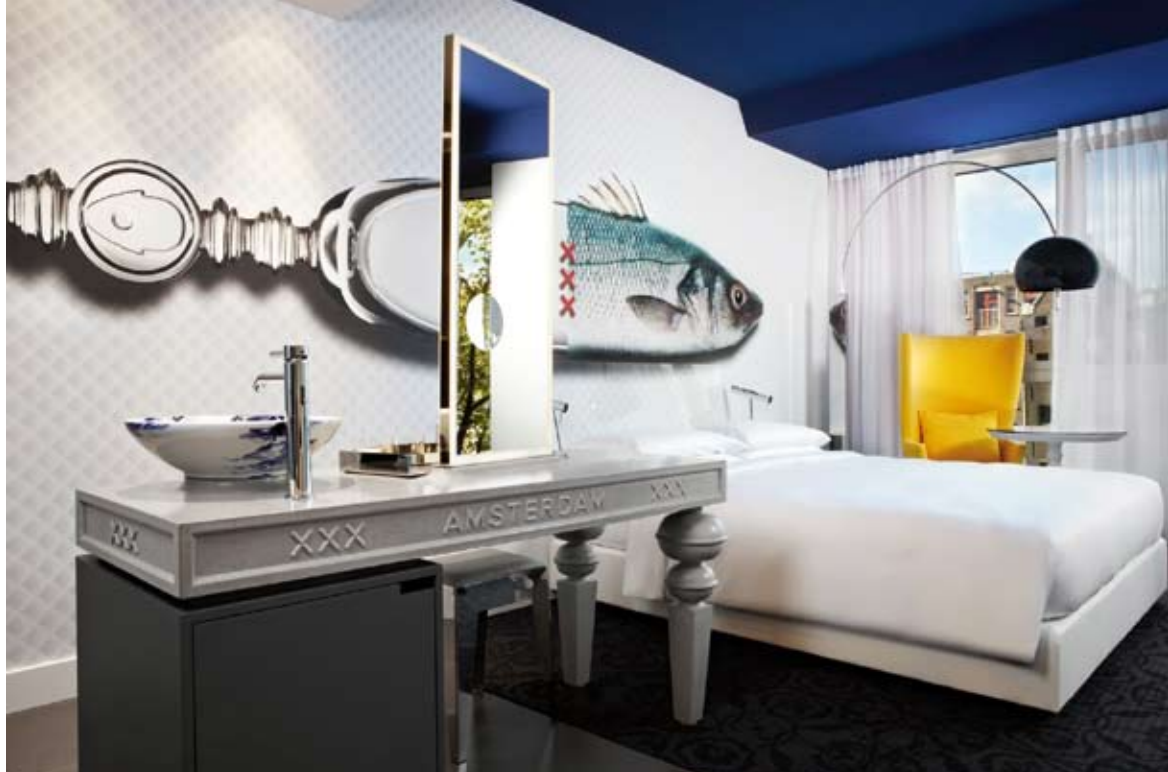
Luxus és tolerancia felsőfokon. Az amszterdamiak nyitottságát jelképező három xxx az igényes fésülködőasztalán, és a falat díszítő furcsa lényen is megjelenik

Az épületben 1977-től 2007-ig a város közkönyvtára működött. (A hét összes napján nyitva tartó központi könyvtár azután Oosterdokseilandon talált ultramodern, új otthonra.) Bár elköltözött, a könyvtár szelleme mégis áthatotta a falakat. A belsőépítészek erre az örökségre alapozták koncepciójukat: a könyvekben felhalmozott tudás allegorikus megjelenítése, és az olvasnivalóként, s egyben látványelemként elhelyezett kötetek meghatározzák a szálloda hangulatát. A történelmi könyvekből vett