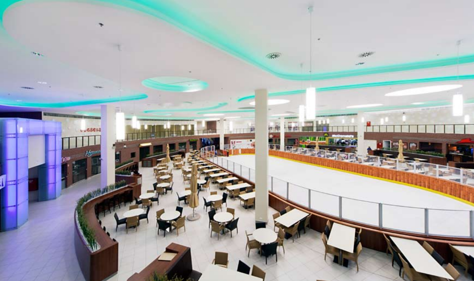
A galériáról jól áttekinthető a megújult ételudvar

közel szemmagasságig tartó zónája köti le. Mégis, ha ott járunk, érdemes néhány pillantást felfelé is vetni, hiszen a téglalap alakú álmennyezeti mezők ritmikusan váltakozó megjelenést mutatnak: a körben fénysávokkal szegélyezett mezőket aszimmetrikus bevilágító kürtők követik, amelyek egy kis természetes fényt csempésznek az állandó mesterséges világítás uralta környezetbe.