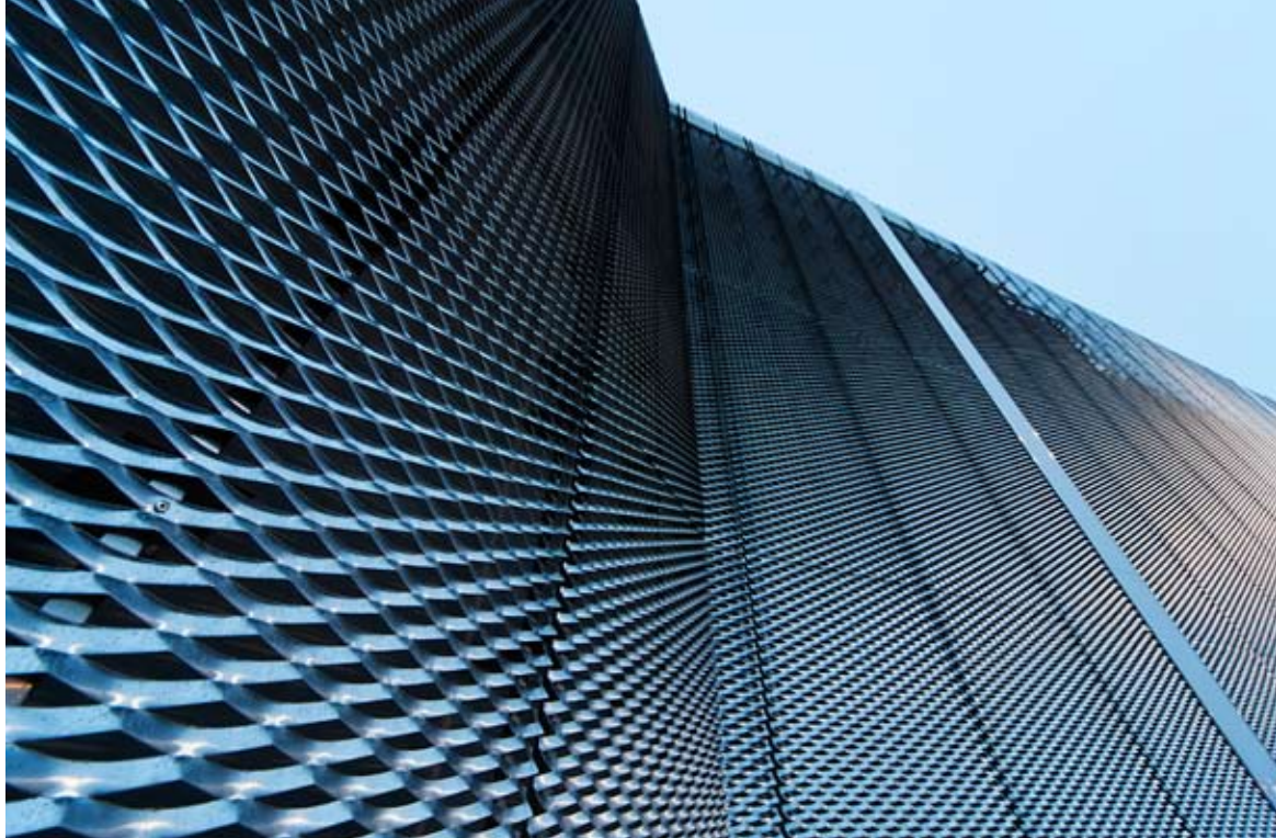
A perforált fémburkolat részlete