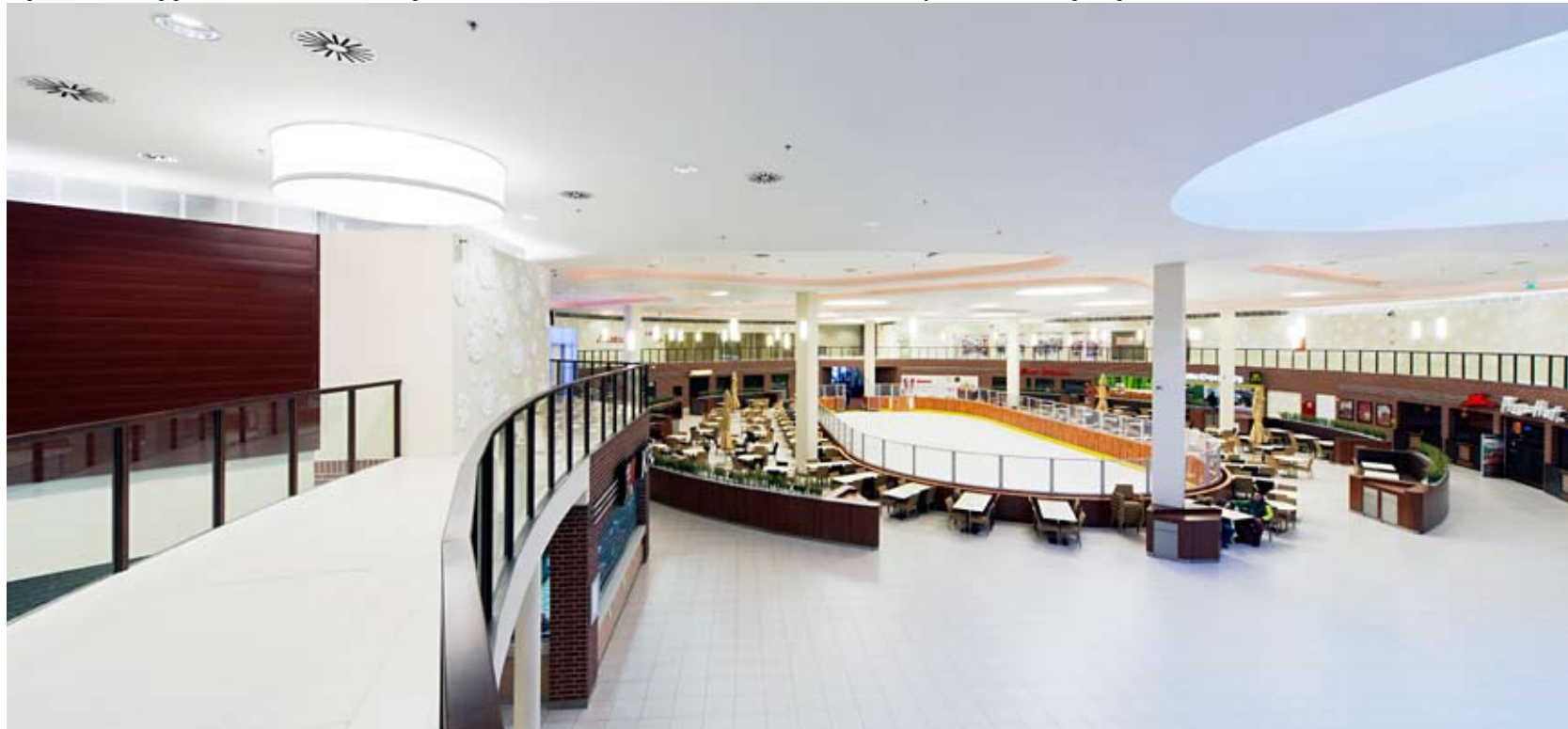
A galériaszinten végigfutó, famintázatú PREFA Sidings 1,0x200 mm-es, sötét tónusú homlokzatburkolat kiválóan ellenpontosza a tér világosságát

Lényeges változás a bevásárló utcák felső régiójában, az álmennyezetek és a megvilágítás terén történt – bár az átlagos látogató figyelmét elsősorban a hívogató üzletportálok