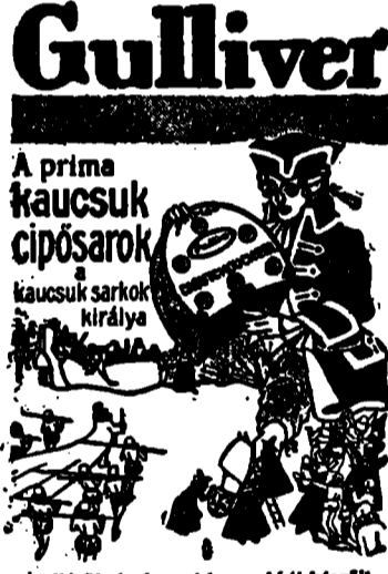
rendkívül olcsó, mert kaucsukból készült.