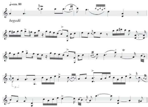
5. ábra. Lassú magyaros (a szerző lejegyzése) 23

finalis, végül pedig a legfontosabb adatok is szerepelnek, a gyűjtés helye és ideje, a dal szótagszáma és ambitusa illetve a dallamsorok záróhangjai. Ez a kottakép a segédadatokkal együtt a dallamok rendszerezéséhez adott támpontot. Részletes lejegyzések a fonográf-felvételek alapján készültek valószínűleg 1920 környékén, amikor Bartók A magyar népdal című könyvén dolgozott. Ekkor került sor Vikár Béla fonográf-felvételeinek lejegyzésére is. 1934 után, mikor a Magyar Tudományos Akadémia elhatározta a magyar népdalok összkiadását, Bartók revidálta saját lejegyzéseit, ami 1934-től egészen az Amerikába való távozásáig tartott. Az ekkor készült kottaképek szabad szemmel már-már a felfoghatatlanság határát súrolják, viszont az adott dallamok díszítés- és előadásmódjának elemzésére kiválóan alkalmasak. Láthatjuk tehát, hogy lejegyzéseinek részletességét mindig az adott lehetőségekhez és igényekhez mérten készítette el.