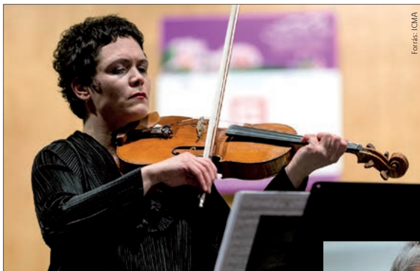
Tabea Zimmermann (brácsa), 2017-ben Az év művésze

Andante (Törökország), Crescendo (Belgium), Das Orchester (Németország), Horvát Rádió és Televízió (Horvátország), MDR Kultur (Németország), Musica (Olaszország), Musik und Theater (Svájc), Opera (Nagy-Britannia), Orpheus (Oroszország), ResMusica (Franciaország), Rondo Classic (Finnország), Scherzo (Spanyolország), IMZ International Music + Media Centre (Ausztria).