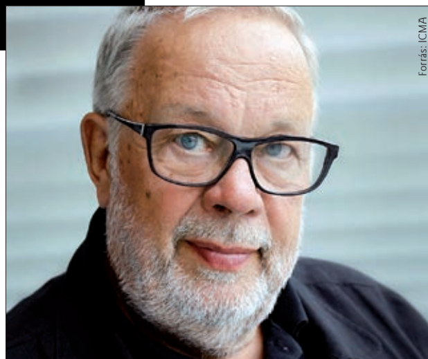
Matti Salminen operaénekes, a 2017. év Életműdíjasa