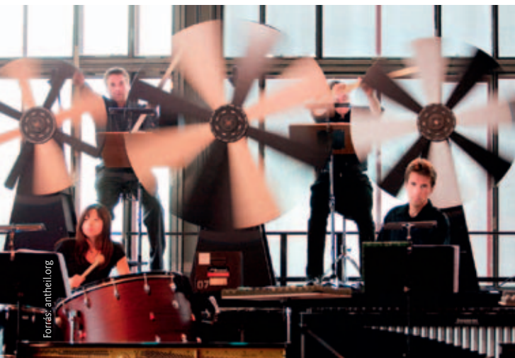
A MusikFabrik a Ballet Mécanique előadása közben 2002-ben Essenben, a KlavierFestival Ruhron

magyar irodalom nem kisebb alakjai, mint Déry Tibor, Illyés Gyula s még néhányan, a modern művészet akkor már európai híriű vezéralakjával, Kassákkal az élen, a dobogóhoz szaladtak, s szájukba dugott ujjakkal akkora füttyöket csaltak a Zeneakadémia csillára alá, hogy ennél nagyobb ricsaj a párizsi koncerten sem lehetett.”