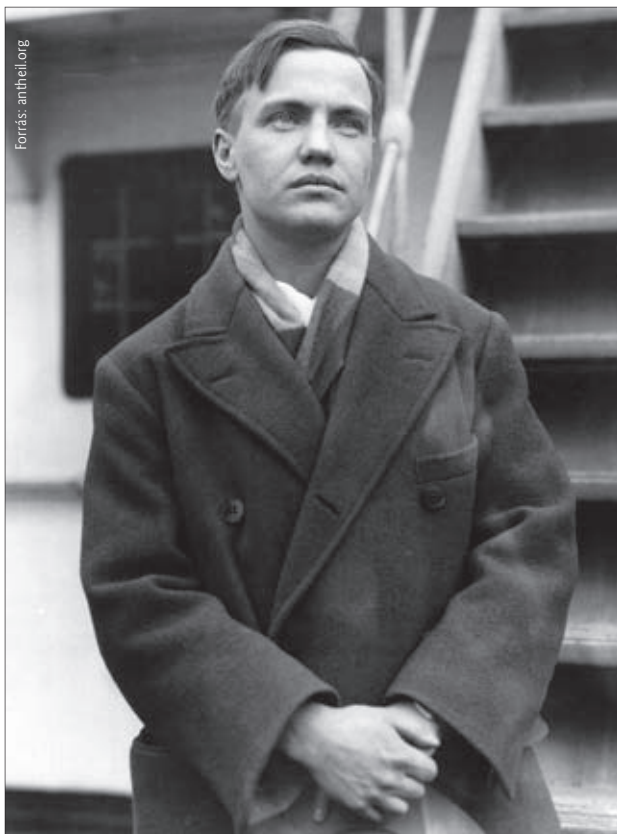
George Antheil New Yorkban, 1927-ben