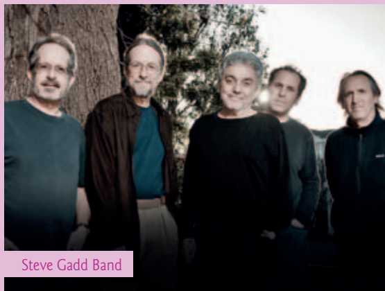
Steve Gadd Band