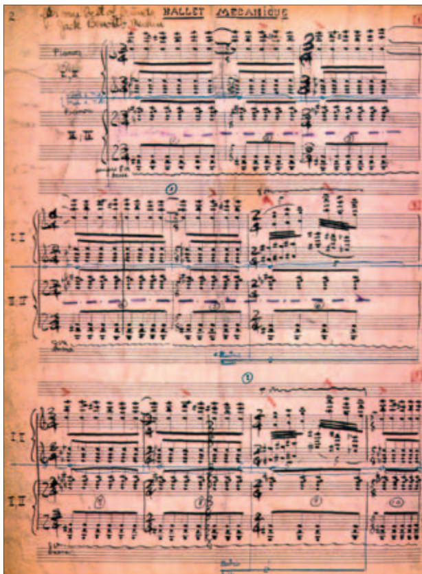
A Ballet Mécanique kézzel írt kottája