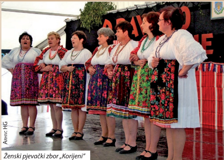
Ženski pjevački zbor „Korijeni“

Međunarodna smotra folklor „Dravsko proljeće“ se više od jednog desetljeća održavala svake druge godine, i to jednom u Sopju, a drugi put u Starinu, naizmjenično. Ovogodišnja – ako se održi – biti će jubilarna petnaesta po redu. Ali, na žalost, epidemiološka situacija i ovoga, kao i proljeća 2020, utječe na planove organizatora. Po planiranom Dravsko proljeće, koje se uvijek priređivalo na mladi Uskrs, ove godine planira se se za 8. svibnja. Ako Bog da okupit će se prijatelji, održati mimohod folkloriša, biti će veselja i pjesme. Do tada svi mi možemo usamljeno ili u manjim grupama prošetati obalom Drave i pozdraviti proljeće na njenim obalama i u obližnjim šumama.