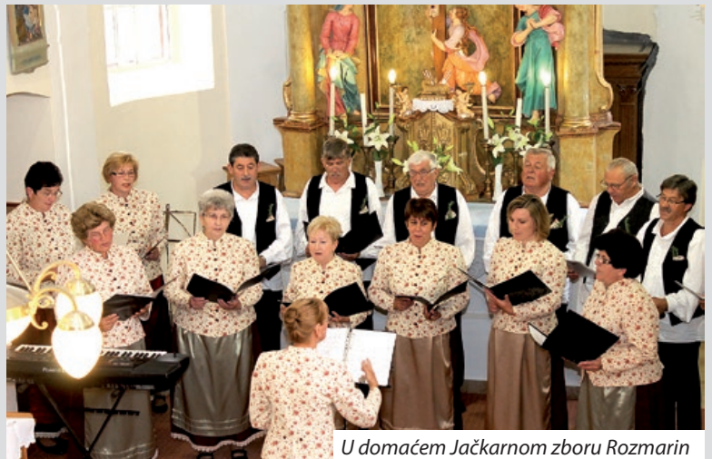
U domaćem Jačkarnom zboru Rozmarin

svojem lipom glasu, niste zaman bili med osnivači četarskoga Jačkarnoga zbora Rozmarin. Poznali ste i poštovali četarsku povijest, prirodu ka vam je darovala vinograd i zdravlje pri marljivom djelu polag klita, kamo ste srdačno pozvali svakoga, na klajzin vlašćega dobrog vina. A vinarstvo, ljubav prema Gori jerbali su i sini. Dali ste viker dušu i srce Bogu, trud i brigu priznali niste kad se je djelalo za selo, za crikvu ali za hrvatsku zajednicu. Tradicije su Vam bile važne, zato ste se i zeli za dužnost predsjednika Farskoga tanača u jesen 2007. Ljeta ter ste i ostali sve do 2018. Ljeta, dokle prik pet ljet ste peljali i brigu za četarsku šekreštiju kot crikvešnjak. Mirno moremo reći da nije se smilo ništ osebjunoga zgodati prez Vas u rodnom selu. Kot 19-ljetni mladić ste stupili na prvo i zadnje djelatno mjesto kod Volána i otud ste prošli u mirovinu, kot vozač autobusa s međunarodnih putovanj, 30. septembra 2002. Ljeta. Sami ste rekli, ovako je ostalo već vrimena familiji, voljenoj ženi, dicit, kot i nukicam. Beteg vas je neočekivano, podmuče zgrabio dopodne te kobne subote, dokle Vam je i hižna družica na bolničkoj stelji ležala.