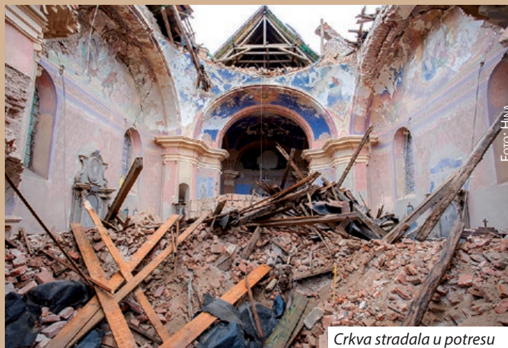
Crkva stradala u potresu

Kako je za Hrvatski glasnik 23. veljače izjavila predsjednica Hrvatske samouprave Šomođske županije Jelica Csende, zaključno sa spomenutim nadnevkom na račun samouprave s naznakom "földrengés" 150 donatora uplatilo je ukupno 5 338 904 ft. Od pojedinaca, do tvrtki, mjesnih samouprava, narodnosnih samouprava, civilnih udruga... Nemoguće ih je sve nabrojiti. Donacije su stizale i stižu s raznih strana. Tako je i sama samouprava na ime donacije uplatila 300 tisuća forinti. Među donatorima je i tvrtka koja je uplatila 500 tisuća forinti, ali i pojedinačne uplate od nekoliko tisuća forinti. Jelica Csende je istaknula kako će se prikupljena novčana donacija, s donacijama prikupljenima na računu koji je za stradale u potresu u Sisačko-moslavačkoj županiji otvorila Hrvatska državna samouprava, namijeniti za jedan konkretan projekt, a to je obnova glazbene škole u Petrinji, čiju će obnovu pomagati hrvatska zajednica u Mađarskoj.