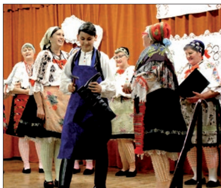
Mirkova škrinja blagom