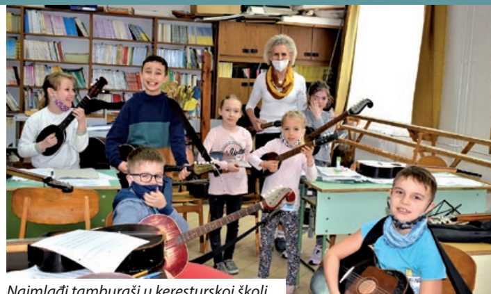
Najmlađi tamburaši u keresturskoj školi

„U našoj školi tamburica se podučava već gotovo deset godina, mnogi učenici koji poslije osmog razreda nastavljaju školovanje u Kaniži uključuju se u tamošnju tamburašku radionicu, pa trenutno u podmlatku kaniških tamburaša sviraju 3-4 naša bivša učenika. Mislim da je to jako dobro, jer tako i u srednjoj školi ostaju u kontaktu s hrvatskom kulturom i zajednicom. Sate tamburice uvijek smo financirali kroz razne projekte Hrvatske samouprave Kerestura, prethodnih godina Hrvatski kulturno-prosvjetni zavod Stipan Blažetin angažirao je učitelja tamburice iz Hrvatske, a ove godine financiranje smo riješili u sklopu projekta