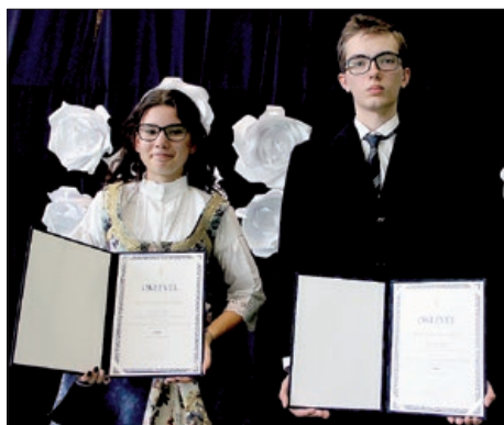
Krležini i HOŠIG-ovi srednjoškolski narodnosni stipendisti 3. – 4. stranica