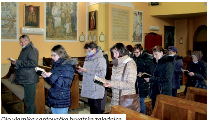
Dio vjernika santovačke hrvatske zajednice

Križni put u santovačkoj župi svakog korizmenog petka već prema stoljetnoj tradiciji moli se naizmjenično, jednoga tjedna na hrvatskom, a drugoga na mađarskom jeziku, prema tome kakav je aktualni crkveni tjedan. Naime, sve mise, pobožnosti i obredi u santovačkoj župi odvijaju se naizmjenično prema aktualnoj