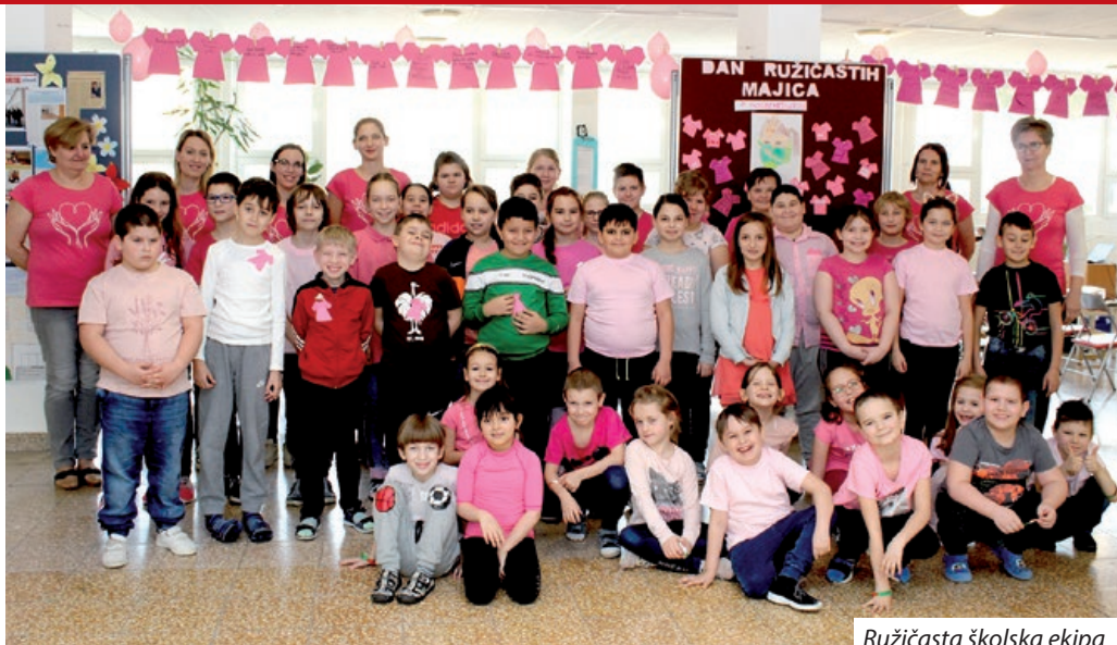
Ružičasta školska ekipa

Povidajki pripada i to kako se je 2007. ljeta u Kanadi oblikao dičak u ružičastu majicu u podršku svoje mame, ka se je obetažala u raku na prsa, a za ti čin su ga školski tuvaruši ismijavali, izložio se je napadu i verbalnom nasilju. U solidarnosti, drugi dan su i prijatelji dičaka na se oblikli ružičastu pratež. Deset ljet kasnije je zadnju februarisku srijedu Hrvatski sabor proglasio Nacionalnim danom borbe suprot nasilja. Ta se dan obilježava i u brojni škola Hrvatske. Tako su zadnji dani prošloga miseca potekli i u sambotelskoj ustanovi pri toj temi, u aktivnom razgovoru s dicom, napuhali su se baloni, a u djelaonica