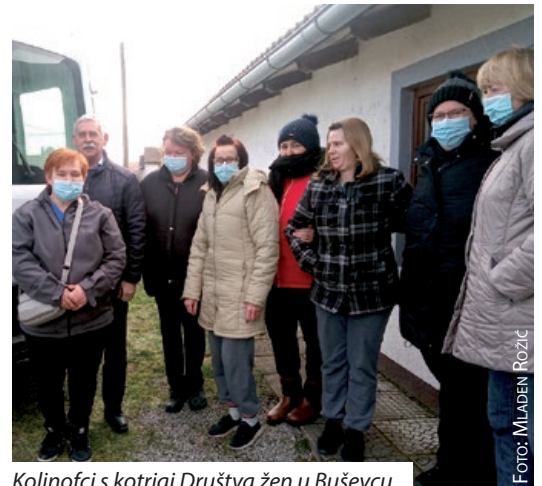
Koljnofci s kotrigi Društva žen u Buševcu