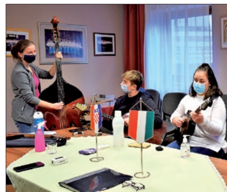
Tamburaške radionice u Pomurju