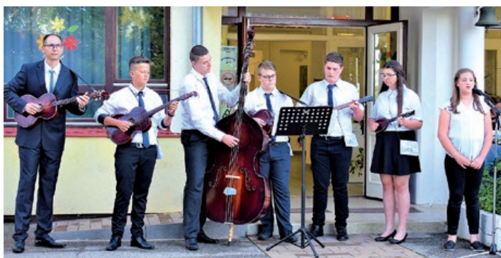
U serdahelskoj školi tamburaši nastupaju na svim školskim programima