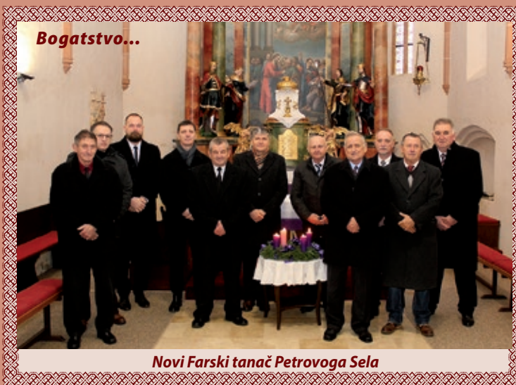
Novi Farski tanač Petrovoga Sela