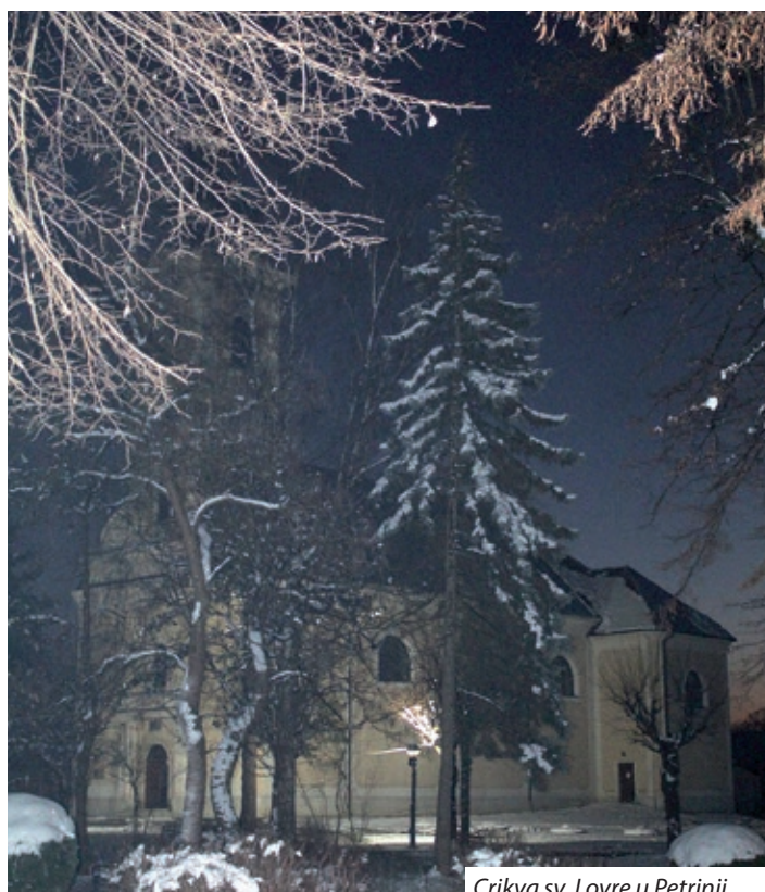
Crikva sv. Lovre u Petrinji