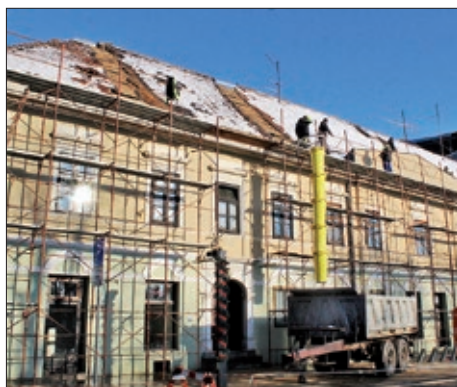
Reportaža s drhtavoga sisačkoga kraja 4 – 5. stranica