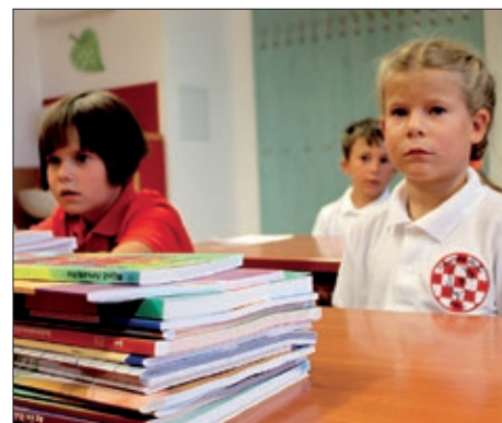
U školi Miroslava Krležje završeno prvo polugodište