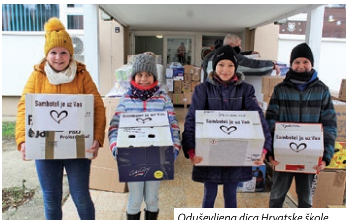
Oduševljena dica Hrvatske škole