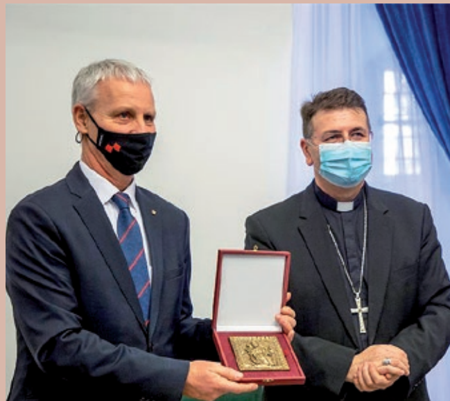
Biskup Šaško uručio prigodni poklon državnom tajniku Soltészu

Pomoćni biskup zagrebački mons. Ivan Šaško susreo se 14. siječnja 2021. u prostorijama Nadbiskupskog duhovnog stola s državnim tajnikom za vjerske i narodnosne odnose Ureda predsjednika Mađarske Vlade Miklósom Soltészom. Susretu je nazočio i predsjednik HDS-a Ivan Gugan, koji je bio u delegaciji državnog tajnika Soltésza za njegovog službenog posjeta 13.-14. siječnja u Republici Hrvatskoj.