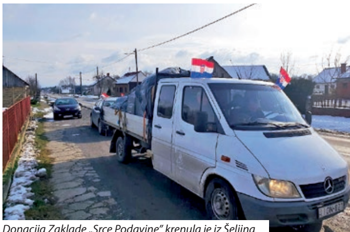
Donacija Zaklade „Srce Podravine“ krenula je iz Šeljina

Razorni potres koji je pogodio Sisačko-moslavačku županiju potaknuo je zakladu na prikupljanje donacija za potresom pogođena područja. Kako novčanih, koje se mogu uplati na račun zaklade, tako i donacija u hrani, odjeći, lijekovima i svemu što je