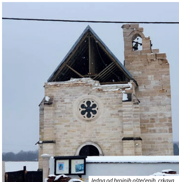
Jedna od brojnih oštećenih crkava