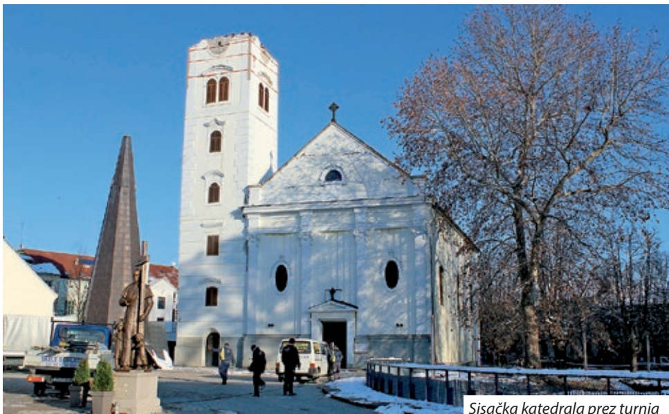
Sisačka katedrala prez turnja