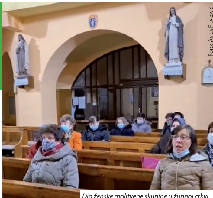
Dio ženske molitvene skupine u župnoj crkvi