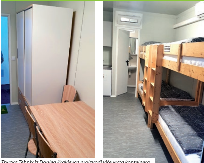
Trvrтка Tehnix iz Donjeg Krakjevca proizvodi više vrsta kontejnera