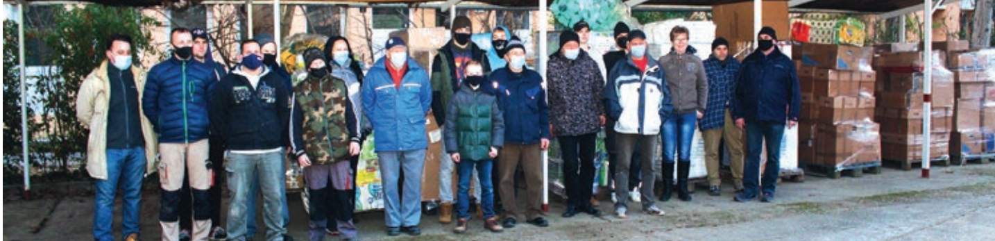
Pomoćnici pri skupastavljanju paketov jedan dan prlje odlaska kamiona