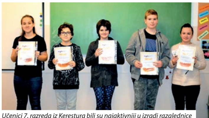
Učenici 7. razreda iz Kerestura bili su najaktivniji u izradi razglednice