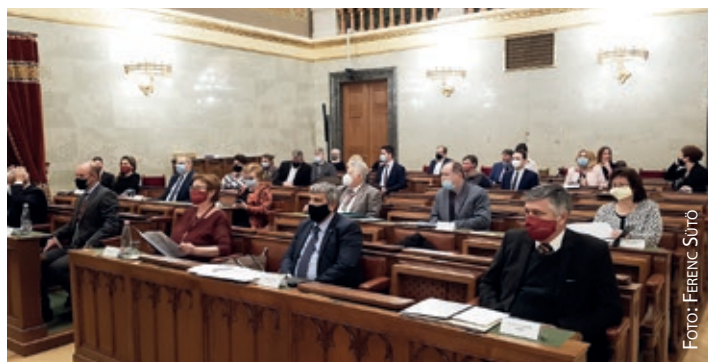
Sudionici sjednice Odbora za narodnosti slušaju izvješće Zsolta Semjéna

Naglasio je da su narodnosne potpore 2010. godine iznosile 3,5 milijarde forinti, a danas iznose najmanje 21,5 milijardi forinti. Povećanjem narodnosnog proračuna podmiren je stari dug, rekao je.