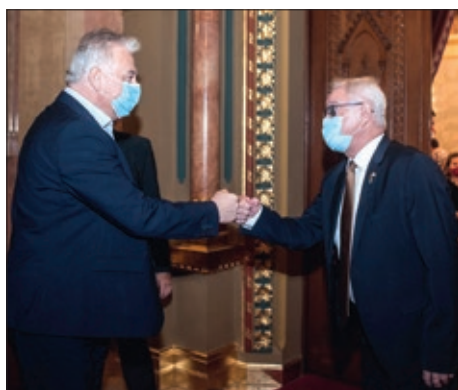
Odbor za narodnosti