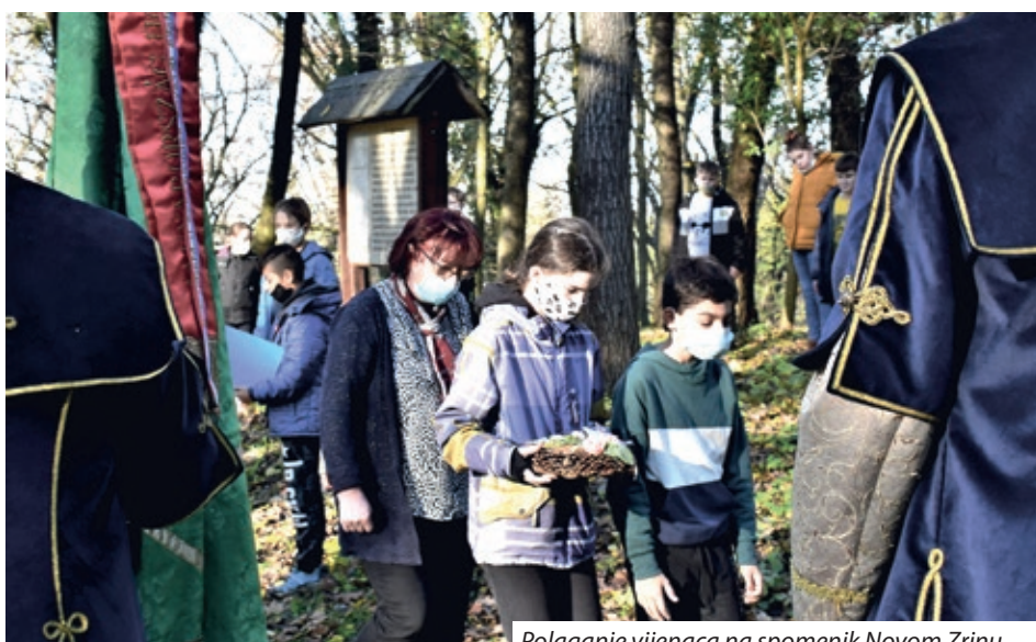
Polaganje vijenaca na spomenik Novom Zrinu

Na dan pogibije Nikole Zrinskog (18. studenoga) učenici 5. razreda odvezli su se biciklima do mjesta nekadašnje utvrde Novi Zrin, gdje su u okviru kratkog programa u kojem su sudjelovali Zrinski ka-