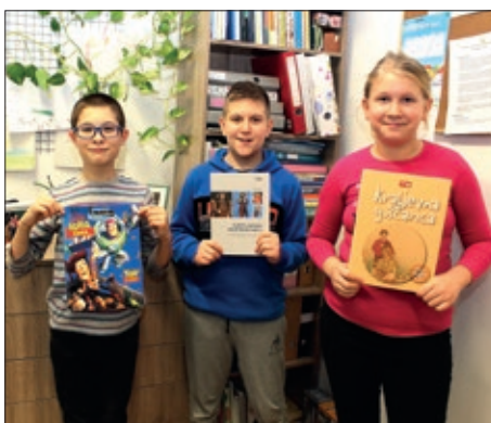
Poklon knjige sambotelskom Obrazovnom centru