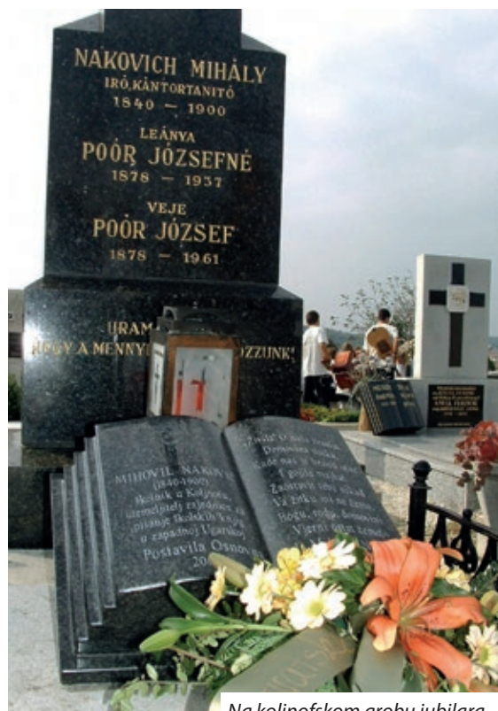
Na koljnofskom grobu jubilara