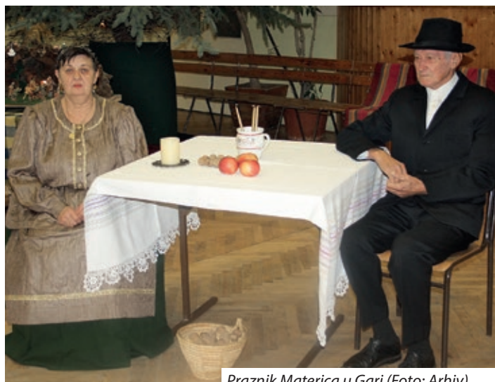
Praznik Materica u Gari

Treće nedjelje došašća bunjevački Hrvati u Bačkoj proslavljaju majke, a četvrte očeve. Običaj Materica očuvao se i u zapadnom dijelu Hercegovine, Dalmatinske Zagore, Sinjske krajine i Srednjedalmatinskog primorja. Običaj je da se Materice i Oci čestitaju ukućanima i rodbini. Majke svoju djecu daruju slatkišima, orašima i jabukama, a u novije vrijeme i novcima. Uvriježio se i običaj da muževi čestitaju ženama, punicama te drugim udanim ženama. Ponegdje i žene čestitaju Materice svekrvama, a one njima. Diljem mađarske Bačke običaj se očuvao sve do danas, a