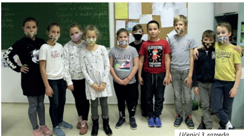
Učenici 3. razreda