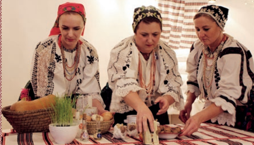
Sretan Vam Badnjak, Adam i Eva....!