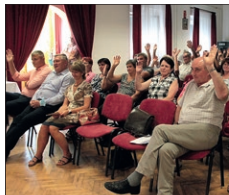
Trideseta obljetnica Saveza Hrvata u Mađarskoj