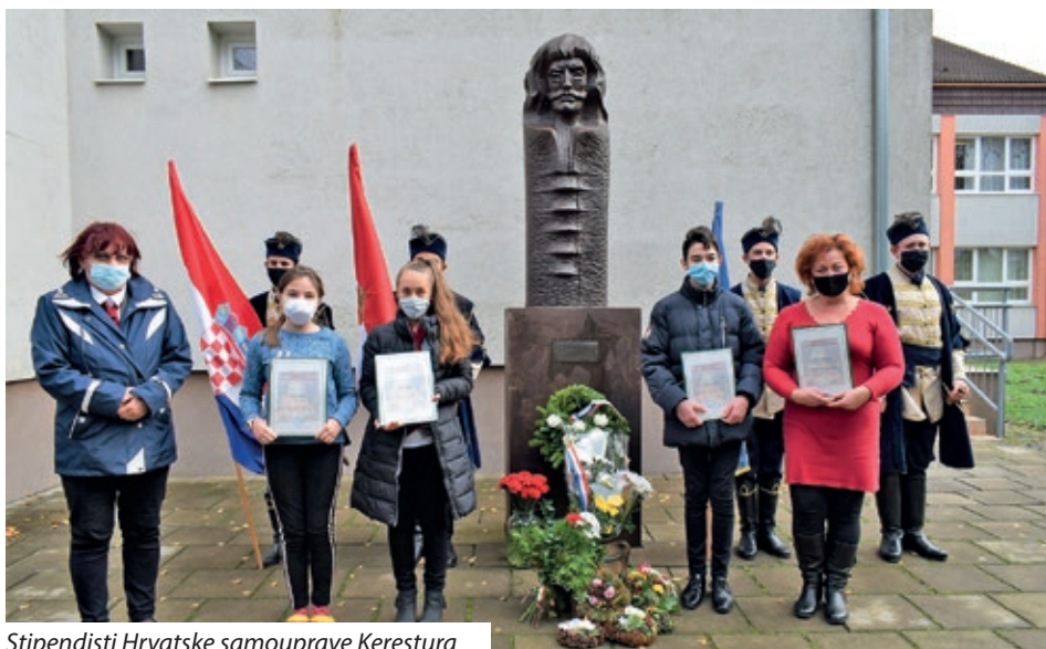
Stipendisti Hrvatske samouprave Kerestura

U povodu 400. obljetnice rođenja Nikole VII. Zrinskog tijekom cijele godine održavala su se razna obilježavanja. Premda zbog pandemije s manje sudionika ili drugačije od planiranog, udruge i ustanove koje čuvaju spomen na hrvatskog bana, vojskovođu, književnika i humanistu ipak su održale prigodne programe. Keresturska Osnovna škola „Nikola Zrinski“ programe vezane uz Nikolu Zrinskog priređivala je od početka rujna do kraja studenog, pri čemu je ostvaren niz aktivnosti, uključujući natjecanje u učenju stranih riječi, utrku i biciklističku turu do Novog Zrina, prisegu prvaša, polaganje vijenaca na spomenike, učeničku konferenciju, natječaj u njegovanju uspomene na obitelj Zrinskih, dodjelu stipendija i kratko prisjećanje u okviru nastave narodopisa, povijesti i mađarske književnosti.