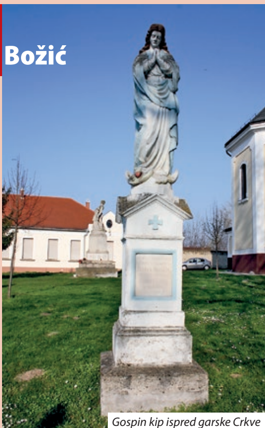
Gospin kip ispred garske Crkve