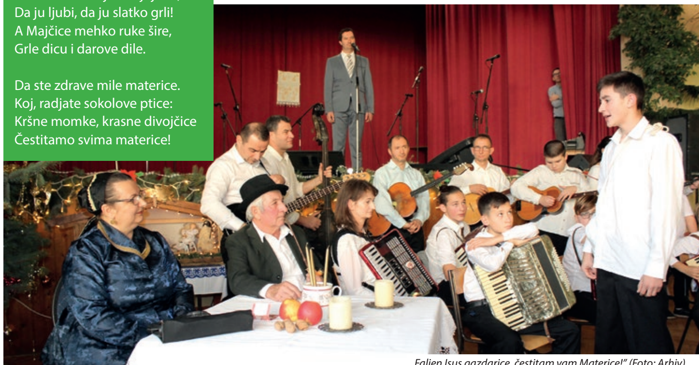
„Faljen Isus gazdarice, čestitam vam Materice!”