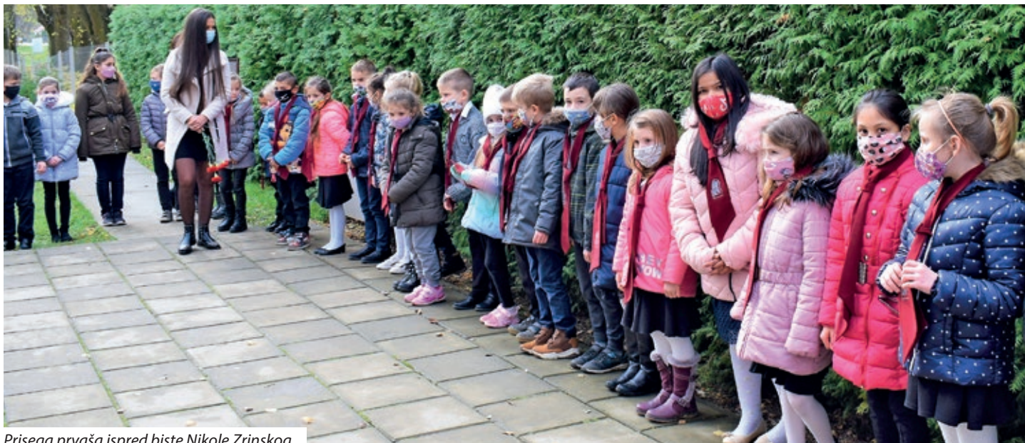
Prisega prvaša ispred biste Nikole Zrinskog

Programi vezani uz Nikolu Zrinskog započeli su početkom školske godine objavom natječaja za izradu maketa utvrde Ozalj koju je dao sagraditi još Nikola Šubić Zrinski, ali su u njoj boravili i drugi članovi obitelji. U izradi maketa uz pomoć svojih roditelja iskušali su se učenici nižih razreda, dok su učenici viših razreda male utvrde izrađivali već gotovo samostalno. Na poziv je pristiglo sedam radova od raznih materijala, drveta, stiropora, papira, mahovine i drugog. Radovi su bili vrlo kreativni, a prema ocjeni žirija nagrađeni su sljedeći učenici: prvo mjesto: