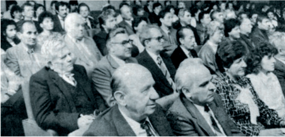
Na skupu su sudjelovali delegati iz svih hrvatskih krajeva u Mađarskoj

sasvim drugačije, puno temeljitije i bolje organiziran. Počev od tiskanog materijala, od pripremanja izborne komisije i da ne nabrajam dalje. Na ovaj način se ne može suvremeno, moderno raditi, razgovarati o nacrtu statuta, itd.