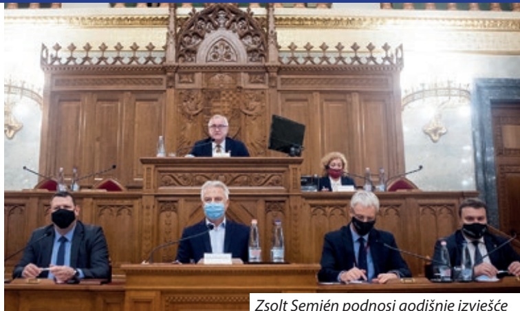
Zsolt Semjén podnosi godišnje izvješće

Rekao je kako narodnosti koje imaju maticu predstavljaju most između Mađarske i svojih matičnih država. Ukoliko je ta veza plodna, primjereno je da udio dobije i dotična narodnost, no ako zbog nečeg „nije baš najidealnija“, narodnost ne smije trpjeti nikakve negativne posljedice.