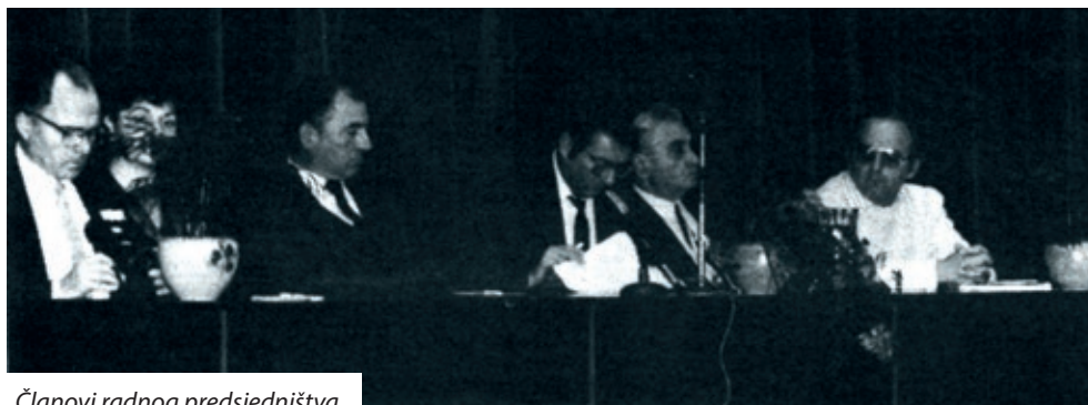
Članovi radnog predsjedništva

Budući da već nije bilo vremena za konačno oblikovanje Statuta, delegati su donijeli odluku o formiranju Statutarne komisije, koja će do 15. prosinca