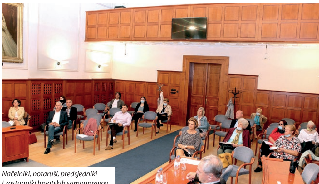
Načelniki, notaruši, predsjednici i zastupnici hrvatskih samoupravov

stavilo mnogo pitanj. U medjusobnoj diskusiji na ovoj temi više je bilo jasno, da postoji zamisao da umjesto centra se zaposli človik ki bi bio mobilno nadležan za hrvatske interese od Bizonje do Unde. Dr. Franjo Pajrić je kritizirao županijske samouprave čija zadaća, po njegovom mišljenju, ne bi smila biti isključivo podiljenje materijalnih sredstava, nego npr. i osnivanje županijske hrvatske ustanove. Marijana Pajrić je pozvala sve nazočne na skupno razmišljanje i na davanje pomoći da se konačno realizira i njeva sanja o osnivanju Hrvatskoga centra, u održavanju županijske Hrvatske samouprave. Ivan Gugan je dao podršku i ovoj formi i ponudio je svoju pomoć, informacije a i dosadašnje iskustvo s utemeljenjem takovih institucij, dokle je glasnogovornik Jozo Solga i artikulirao jur i konkretni okvir te zamisli. Ako hrvatske samouprave na području županije stupu u udruženje i na suradnju sa županijskom Hrvatskom samoupravom, inicijativa dobit će i pravni oblik. U završetku foruma je Marija Pilšić još dodala da na slijedećoj sjednici županijske Hrvatske samouprave ponovo će se baviti s ovom temom i odlučiti, u kom formatu da se napravi hrvatski centar u nadležnosti županijske Hrvatske samouprave i nadalje je proslila nazočne da i u budućnosti potpiraju nastojanja i djela Hrvatov u svakom naselju.