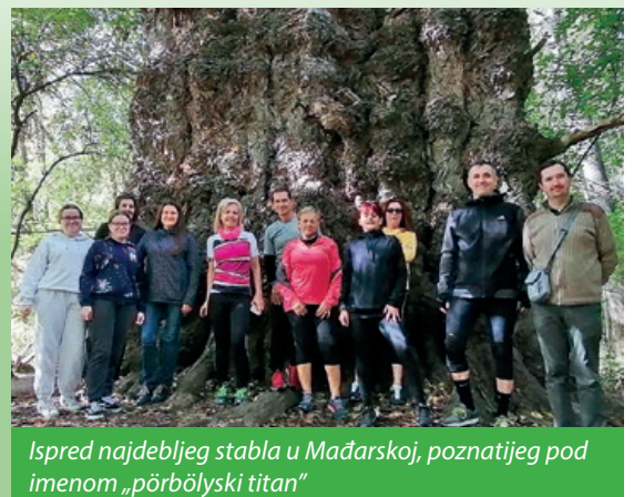
Ispred najdebljeg stabla u Mađarskoj, poznatijeg pod imenom „pörbölyski titan“

ca Türr na obali Dunava, a potom nastavilo šumskim putom kroz Gemenc do pörbölyskog „titana“, najdebljeg stabla u Mađarskoj. U povratku su se zaustavili na obali Dunava kako bi pojeli zajednički ručak, koji se sastojao od bajske „riblje čorbe“.