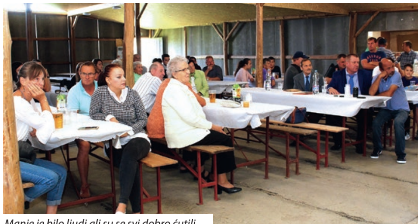
Manje je bilo ljudi ali su se svi dobro čutili