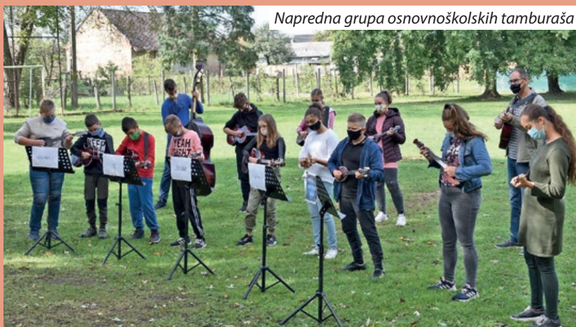
Napredna grupa osnovnoškolskih tamburaša