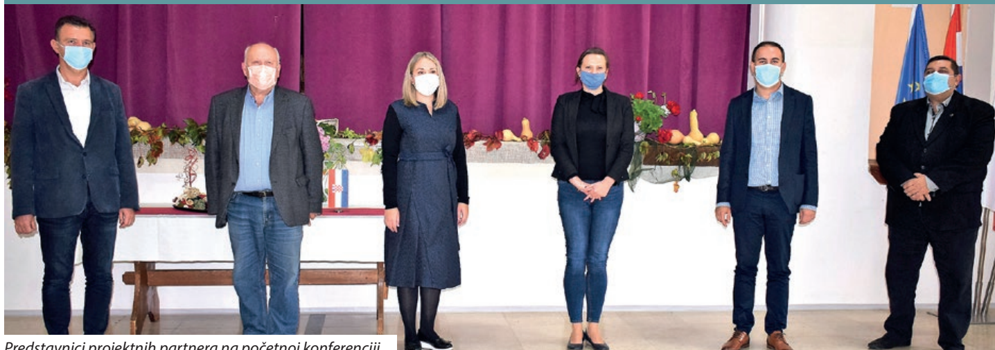
Predstavnici projektnih partnera na početnoj konferenciji

U Goričanu je 15. listopada održana početna konferencija projekta „Dvije rijeke, jedan cilj II.“, koji u okviru Programa Interreg za prekograničnu suradnju Mađarska-Hrvatska provode Općina Goričan (kao vodeći partner), Općina Donji Vidovec, Općina Legrad, Lokalna samouprava Serdahela i EGTS „Regija Mura“. Projekt je nastavak istomiennog, završenog projekta iz prvog poziva Interreg programa, ostvarenog u cilju razvoja turizma pograničnog područja Mure i Drave. Ukupna vrijednost projekta je 888 876 eura.