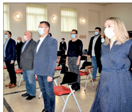
Dvije rijeke, jedan cilj II.