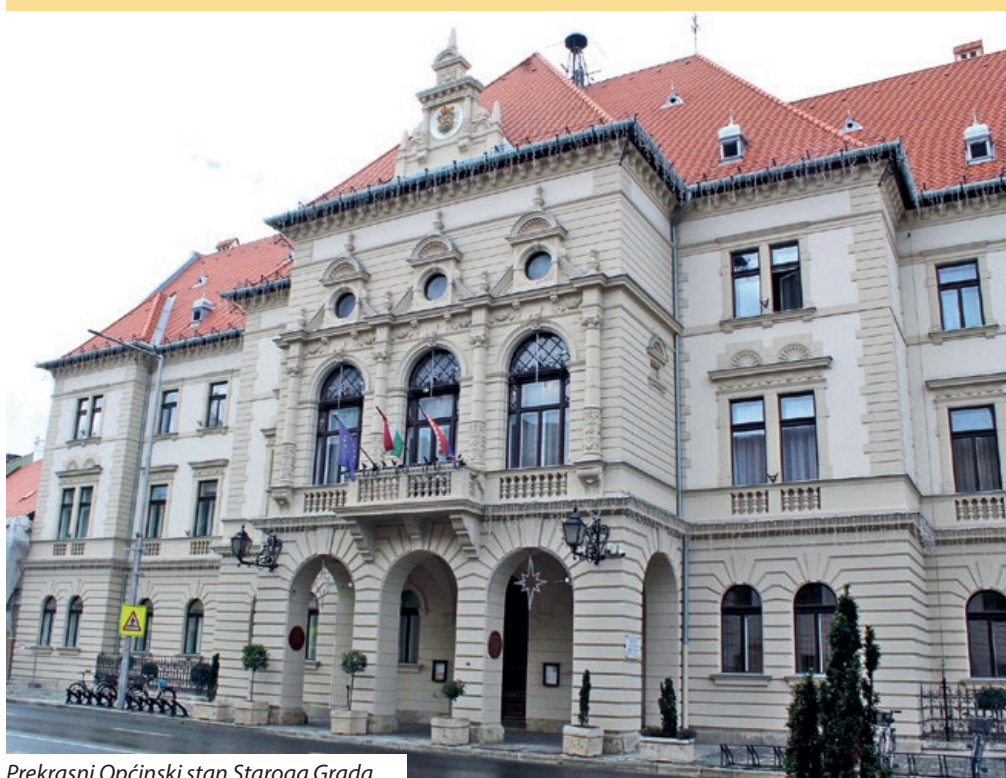
Prekrasni Općinski stan Staroga Grada