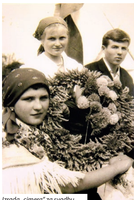
Izrada „cimera“ za svadbu

zanata svijeta. Srećom, konji se još uvijek moraju potkivati. Današnja žetva i kosidba posve se razlikuju od onog što vidimo na fotografijama. Kola se rijetko mogu vidjeti, većinom u rastavljenom stanju i bez funkcije, dok su saonice za transport postale ono što se na njima vozilo zimi iz šume: drvo za ogrjev. Za nekoliko desetljeća potpuno se promijenio namještaj i izgubila nošnja. „Hrvatska postela“, „cifrana deska“, „klopa na vuglu“, „zdelnjak“, „kaslen“, „lajca“, „stalak“, ili „flajdanka“, „fodre“, „tokica“, „pleček“, „frton“, „šurec“, „žnora“ i „bajk“ malo koga podsjećaju na stvarne predmete. Na ovim starim fotografijama pojavljuje se staro i pomalo zaboravljeno: svadba, vjerski život, vrtić i škola, vojnici, traktori i kombajni. Pođimo na putovanje u ne tako davnu prošlost! U prošlost Hrvata na dvije obale Mure, napisao je o izložbi dr. Šandor Horvat. Nakon otvorenja gosti su pozvani na domjenak.