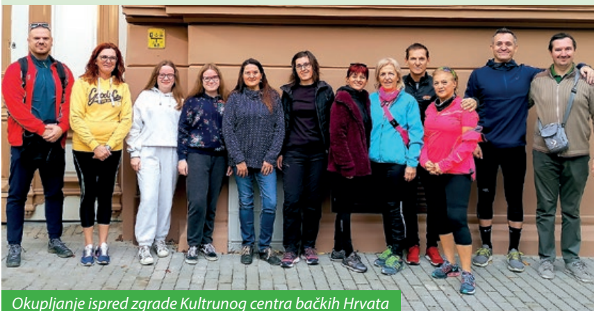
Okupljanje ispred zgrade Kulturnog centra bačkih Hrvata

ca Türr na obali Dunava, a potom nastavilo šumskim putom kroz Gemenc do pörbölyskog „titana“, najdebljeg stabla u Mađarskoj. U povratku su se zaustavili na obali Dunava kako bi pojeli zajednički ručak, koji se sastojao od bajske „riblje čorbe“.