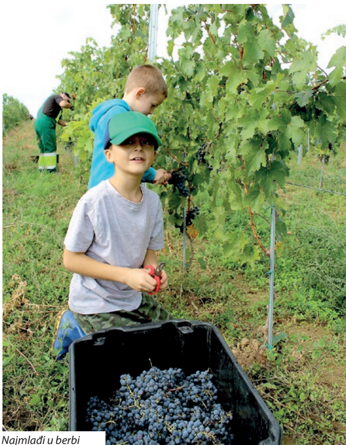
Najmlađi u berbi

Raduje se beračima i upravlja svoje radnike koji tovare kutije pune sočnih bobica na traktorsku prikolicu i voze dolje do podruma gdje će se odvijati daljnja prerada.