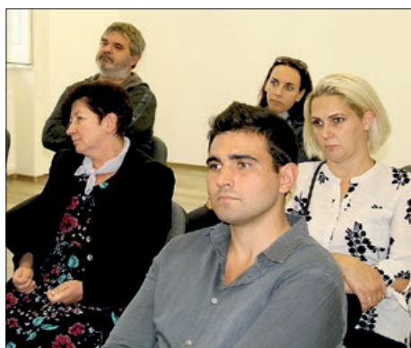
Forum u Baji