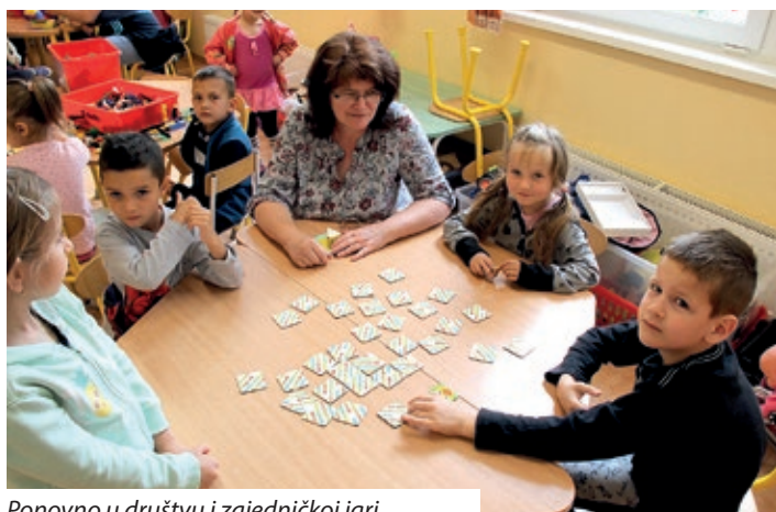
Ponovno u društvu i zajedničkoj igri