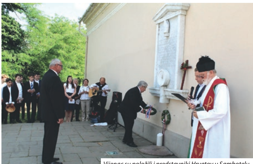
Vijenac su položili i predstavnici Hrvatov u Sambotelu