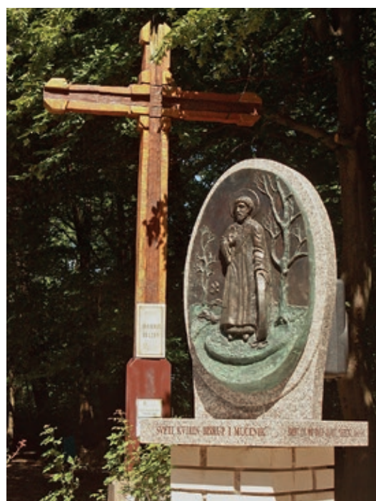
Spomenik sv. Kvirina pri Peruškoj Mariji u židanskoj lozi