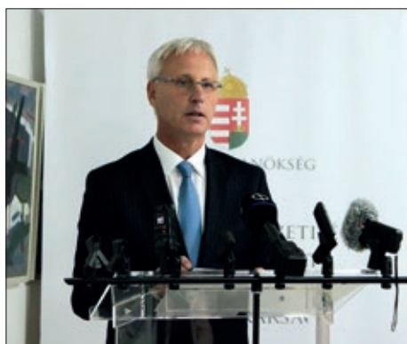
Zakon o narodnostima