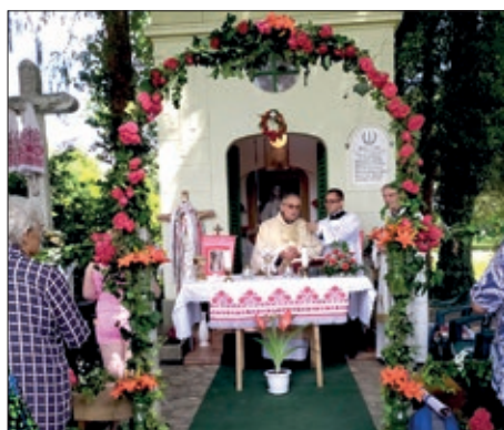
U čast Presvetog Srca Isusova