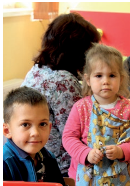
Poziranje pred fotoaparatom novinara

voditeljica vrtića, u vrtiću boravi dvadesetak mališana, čiji se broj iz dana u dan mijenja, nadzor traje od osam do podne. Dijele se dva obroka, doručak i ručak. Mališani su radosni što su opet u društvu svojih vršnjaka i predaju se igri, što nakon dva mjeseca rasterećuje i roditelje. Trenutno je boravak u vrtiću opcionalan, pa svi koji su u mogućnosti ostavljaju djecu