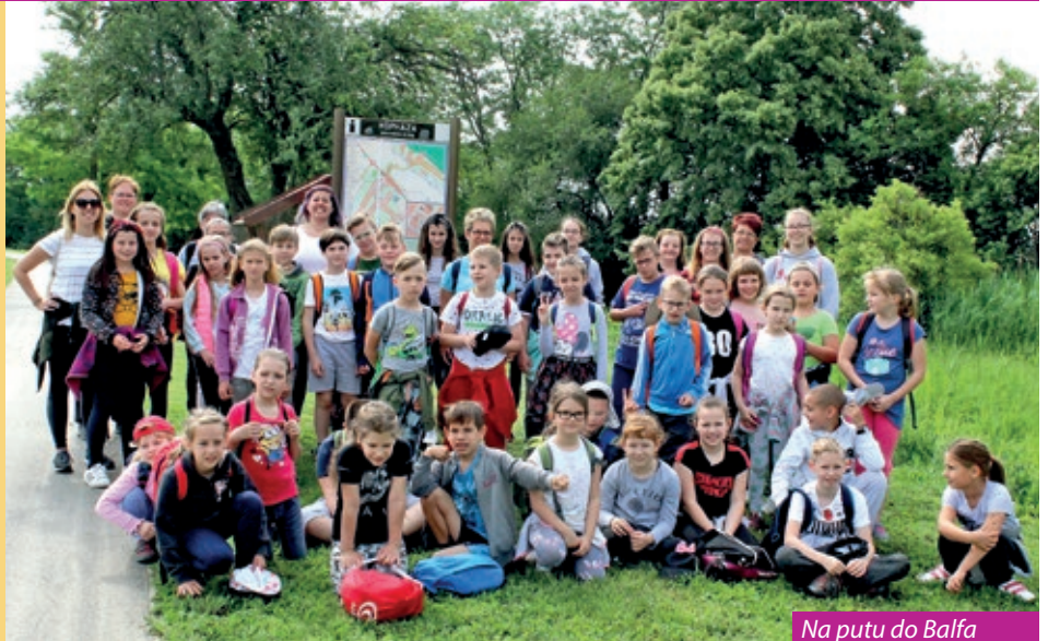
Na putu do Balfa

Duglji period je prošao u korona-zaprtnosti i zbog toga su bili željni školari, kako i pedagogi ponovno-ga spravišća, širom Gradišća. To je i uzrok, kako su u neki naši škola održani ljetni tabori, dugi od jedan, ali uprav dva tajedne. U Koljnofu umjesto Tamburaškoga i čitalačkoga tradicionalnoga tabora su izmislili kamp prirode s turama dopodne, a otpodne sa zanimanji ručne šikanosti, športom i glazbom. Od 15. do 19. junija za 42 dice je osiguran zanimljiv i šareni program.