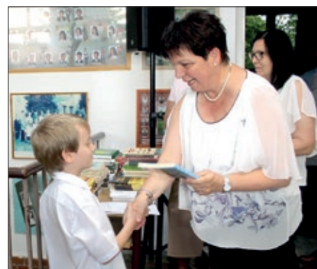
Zatvaranje školskoga ljeta