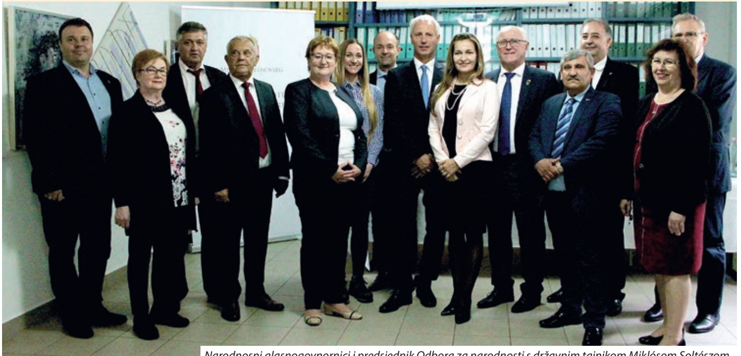
Narodnosni glasnogovornici i predsjednik Odbora za narodnosti s državnim tajnikom Miklósom Soltézsom

Dana 16. lipnja Mađarski parlament s 184 glasa za i 9 suzdržanih usvojio je izmjene Zakona o pravima narodnosti. Povodom toga u prostorijama Njemačke državne samouprave održana je tiskovna konferencija, na kojoj su parlamentarni zastupnik Nijemaca i predsjednik Odbora za narodnosti Imre Ritter i državni tajnik za odnose s vjerskim zajednicama i narodnostima pri Uredu predsjednika Vlade Miklós Soltész naglasili kako se radi o dvotrećinskom zakonu, koji je nastao jednogodišnjim zajedničkim naporima Odbora i Vlade. Događaju su prisustvovali i narodnosni glasnogovornici.