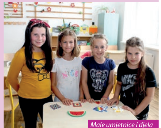
Male umjetnice i djela