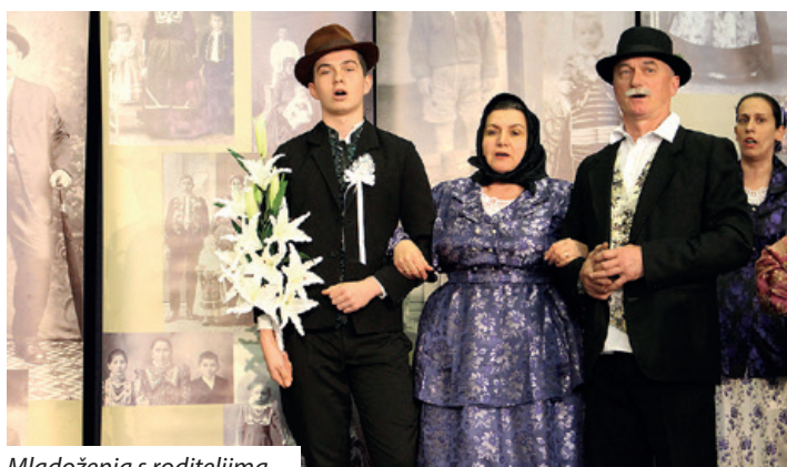
Mladoženja s roditeljima