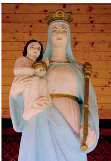
Stari Gospin kip na santovačkoj Vodici

Na inicijativu pojedinaca santovački šokački Hrvati ujedinili su se u zajedničkoj molitvi. Tako se na blagdan Božjega milosrđa, u nedjelju 19. travnja, u zajedničku molitvu uključilo pedeset Hrvata, Santovčana i drugih. Kako saznajemo, pozivu su se odazvali Santovci od Ostrogonia i Budimpešte do Pariza. Zajednički se molila „Zlatna krunica“ za sve oboljele i pogođene koronavirusom i prestanak epidemije. Zajednička molitva ponovljena je i sutradan, 20. travnja. Utječući se Blaženoj Djevici Mariji, molilo se deset molitva (klečeći), a nakon toga Zdravo Marijo (stojeći) prema molitveniku „Duhovna mana“ (Subotica, 1874.), to jest: „Molitve vrlo ugodne Blaženoj Divici Mariji, koje ako ko s pomnjom moli, trideset dana jedno za drugim upalivši sviču prid prilikom Gospinom ili za se, ili za drugoga molio bude, sve koće isprositi, ako bude što prosi, na slavu Božju i spasenje duše onoga, koji moli.“ Deset navedenih mo-