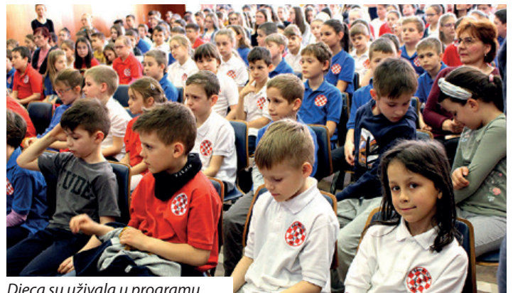
Djeca su uživala u programu