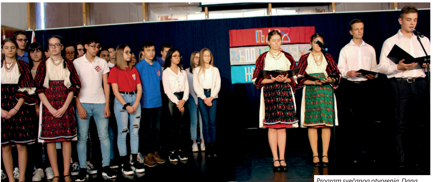
Program svečanog otvorenja Dana