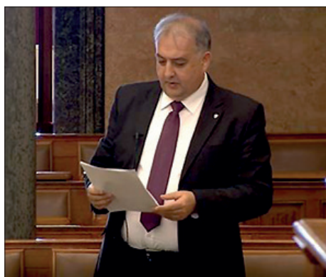
Godišnje izvješće hrvatskog glasnogovornika za 2019. godinu 4. – 7. stranica