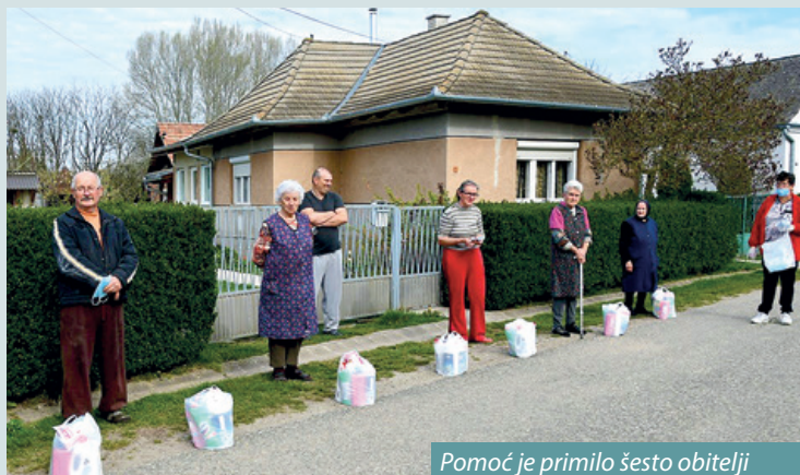
Pomoć je primilo šesto obitelji

Osim potpore iz EFOP programa Društvo je izdvojilo sredstva iz svog proračuna, koja su upotrijebljena za nabavu namirnica. U teškim vremenima, kad su neki od mještana izgubili i radno mjesto, pomoć je dobrodošla. U podjeli paketa pomagalo je 16 volontera, a obitelji su se zahvalile Društvu na pruženoj pomoći.