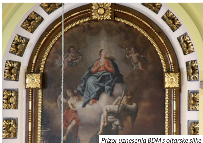
Prizor uznesenja BDM s oltarske slike