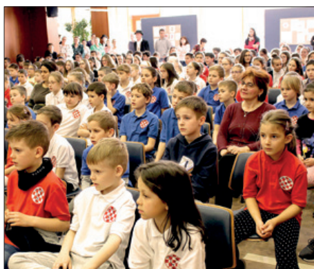
Dani hrvatskoga jezika 10. – 11. stranica