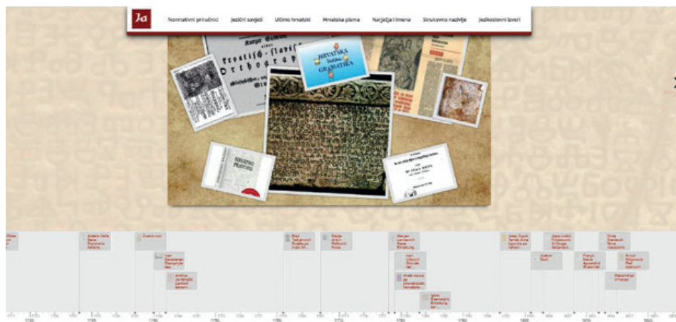
Vremenska lentica s najvažnijim događajima u razvoju hrvatskoga jezika

U odjeljku Narječja i imena podaci su o osobnim imenima i prezimenima ljudi s popisima najčešćih imena, o imenima mjesta (s posebnim dijelom o egzonymima) te o imenima životinja. U tome odjeljku nalazi se poveznica na Portal suvremenih hrvatskih osobnih imena na adresi osobno-ime.hr s podacima o najčešćim imenima, ali i podrijetlu, imendanu i obliku imena u različitim jezicima za više od 1700 imena. Na stranici Hrvatski u dijaspori podaci su o hrvatskome jeziku izvan Hrvatske, a na stranici Hrvatska narječja opis je triju hrvatskih narječja s kartama i zanimljivostima. Na stranici Jezik kao baština opisuju se zaštićeni hrvatski govori, nabrajaju rječnici mjesnih govora, a rasprostiraju je mjesnih govora koji su zaštićeni kao