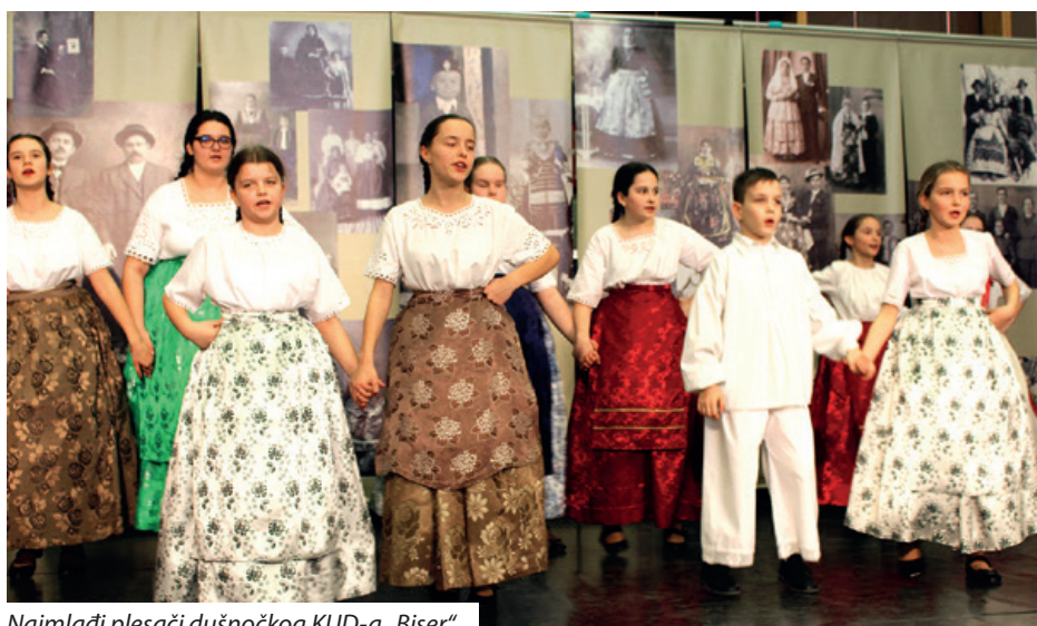
Najmlađi plesači dušnočkog KUD-a „Biser“

hanja s ciljem jačanja postojećeg, i u nadi stjecanja novog znanja o hrvatskom jeziku.