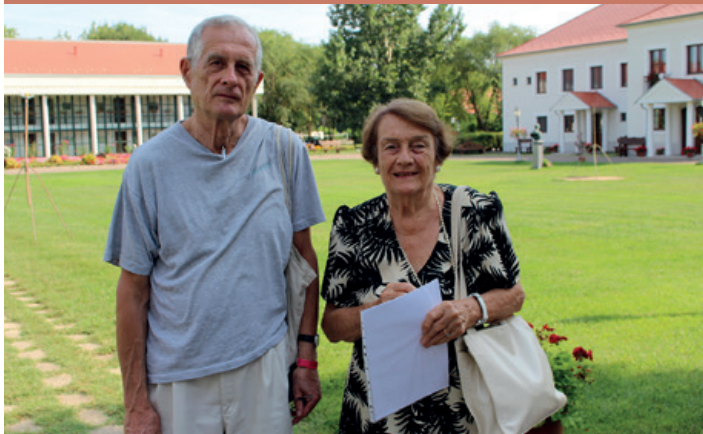
U prevoditeljskom kampu „László Németh”, s kćeri Lászlóa Németha

Predsjednik Mađarske János Áder povodom državnog praznika revolucije 1848.-1849. 15. ožujka 2020. dodijelio je visoka državna odlikovanja Kossuth i Széchenyi. Za postignuća u području umjetnosti i kulture odlikovano je sedamnaest osoba i jedan ansambl, dok je odlikovanje za znanstveni rad primilo dvanaest znanstvenika, među kojima je i povjesničar književnosti Csaba Kiss Gy. Svečano uručenje odgođeno je zbog izvanrednog stanja uslijed epidemije koronavirusa. Imena odlikovanih objavljena su u službenom glasilu Magyar Közlöny.