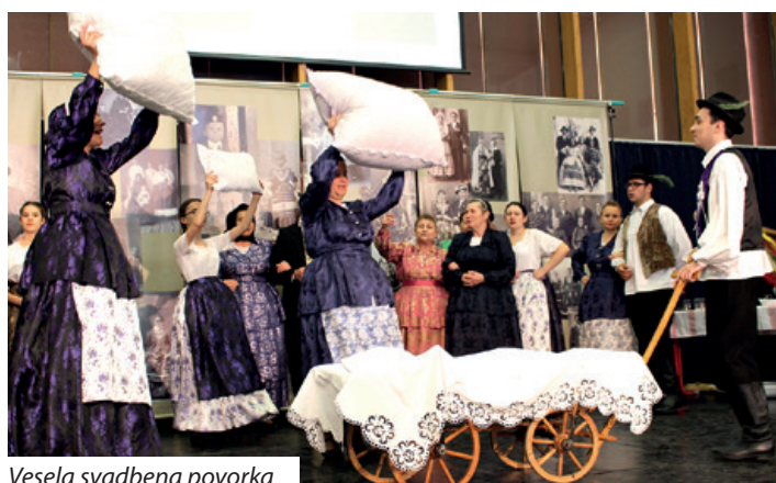
Vesela svadbena povorka