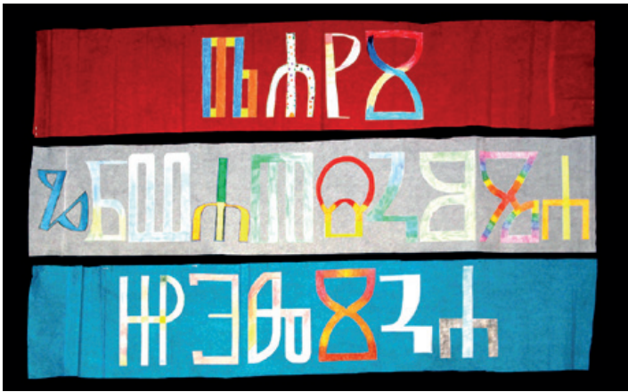
Dani hrvatskoga jezika