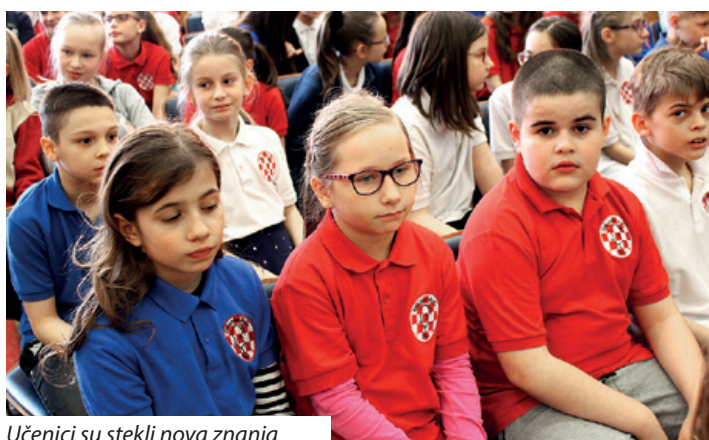
Učenici su stekli nova znanja