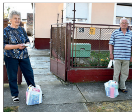
Kulturno društvo Kerestur pomaže u pandemiji 21. stranica