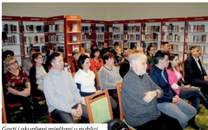
Gosti i okupljeni mještani u publici