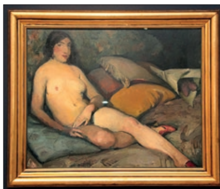
„Kraljević – hrvatski modernist“