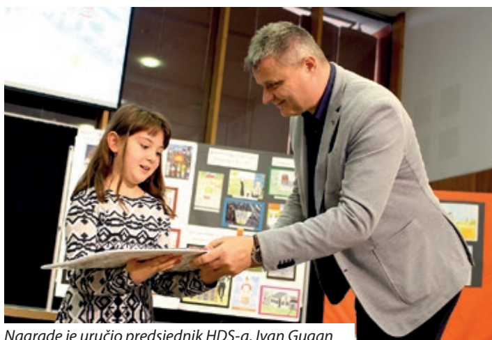
Nagrade je uručio predsjednik HDS-a, Ivan Gugan

U organizaciji Hrvatske državne samouprave, u okviru „Croatiade“, pod nazivom „Narodno blago moga kraja“ i ove godine objavljen je likovni natječaj za hrvatske učenike u Mađarskoj. Nakon što je stručni žiri ocijenio pristigle radove 26. veljače ove godine, već po tradiciji u Hrvatskoj školi Miroslava Krleža u Pečuhu održana je svečana dodjela nagrada. U auli Hrvatske škole priređena je izložba najboljih radova, koju je otvorio Ivan Gugan, predsjednik Hrvatske državne samouprave.