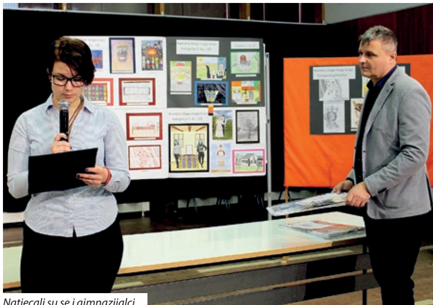
Natjecali su se i gimnazijalci

škola prijavljeno 135 (Budimpešta – HOŠIG 21, od toga 10 radova gimnazijalaca, Pečuh HŠC MK 3, od toga 2 rada gimnazijalaca, Santovo – HOŠUD 16, Petrovo Selo 4 i Koljnof 11). U kategoriji škola s predmetnom nastavom hrvatskog jezika pristiglo je 80 radova (Kemlja 7, Mohač 28, Salanta 6, Lukovišće 17, Borsfa 1, Kerestur 8, Serdahel 8 i Barč 5).