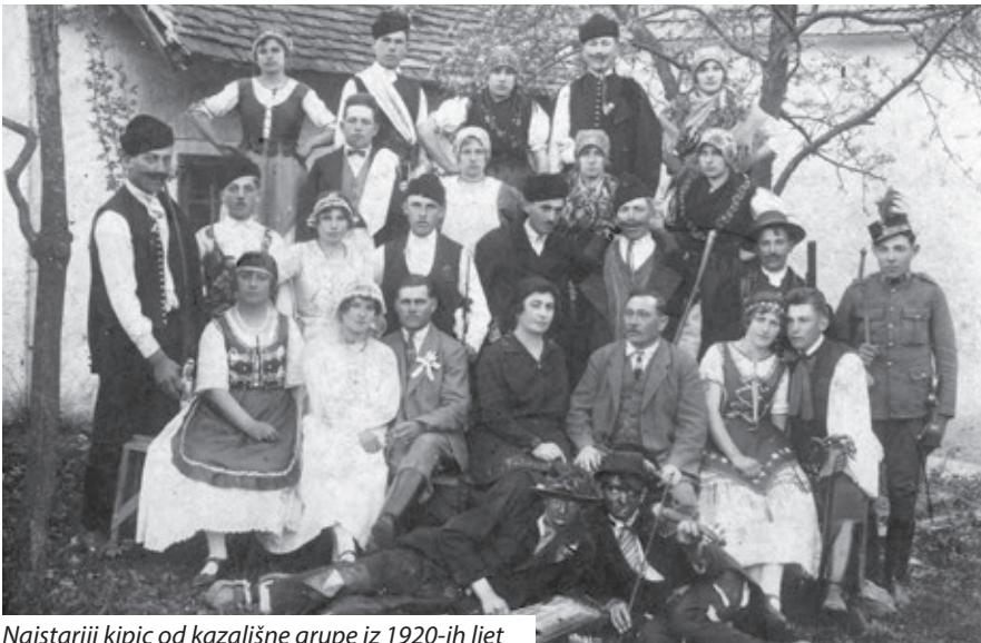
Najstariji kipic od kazališne grupe iz 1920-ih ljet

ovde katani, regrute, jer to se mora znati da Prvi i Drugi svitski boj jako čuda dičakov je od nas zeo. Vrgli smo nuter i dokumente, razglednice ke su oni domom slali da knjiga bude još zanimljivija. Meni je jako žao da nimamo jedan pošteni selski muzej, kamo bi ljudi znali odnesti ovakove stvari. Aš mladi ljudi će sve ovo hitati van u kuku. To sam ja i rekla na prezentaciji, aš imamo ča, ali to nije muzej, to je samo mala izložba. Ljudi još svenek imadu čuda ča, to bi bilo dobro skupasabrati da bude na jednom mjestu da ne bude sve izgubljeno.