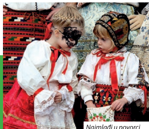
Najmlađi u povorci

Na pokladni utorak, 25. veljače, simboličnim spaljivanjem pokladnog lijesa, sahranom zime i pozdravljanjem proljeća okončan je naširoko poznati ophod mohačkih bušara. Radi se o pokladnom običaju šokačkih Hrvata koji je 2009. godine uvršten u UNESCO-v popis svjetske nematerijalne kulturne baštine.