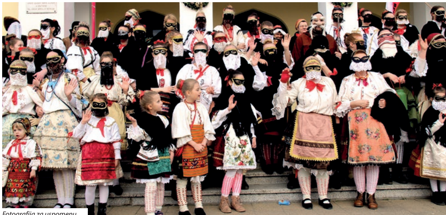
Fotografija za uspomenu