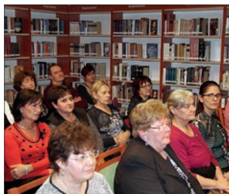
Tribina u Čavolju