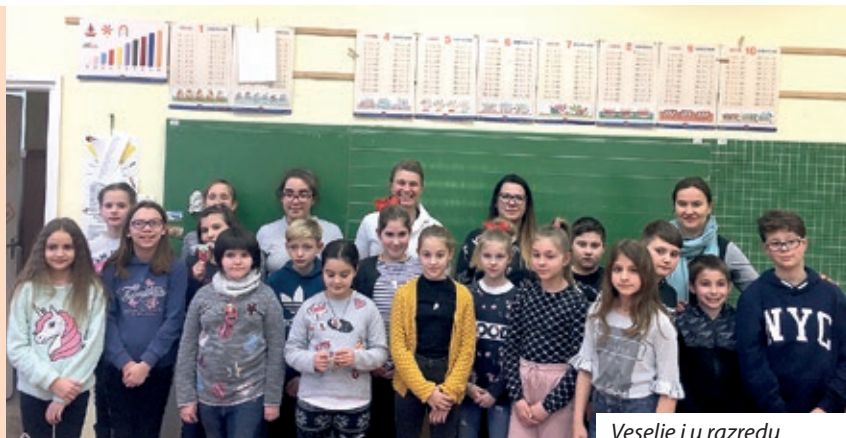
Veselje i u razredu

Na taj dan tradicionalno nas posjećuju učenici Osnovne škole „Franjo Tuđman“ iz bratskog grada Belog Manastira. Bilo je jako veselo. Naši gosti bili su oduševljeni i veseli što su imali priliku upoznati taj običaj šokačkih Hrvata i sudjelovati u ophodnji bušara.