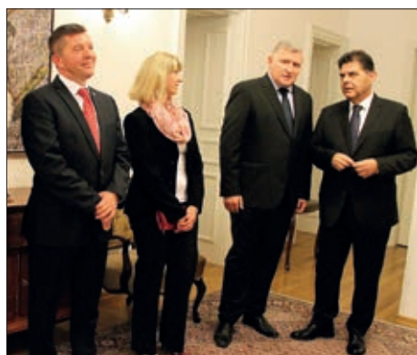
Obilježeni Dan neovisnosti