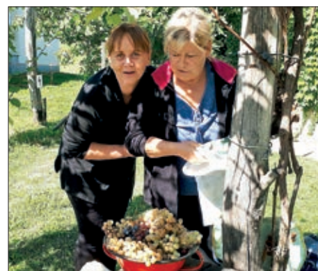
Berbene svečanosti u Pomurju