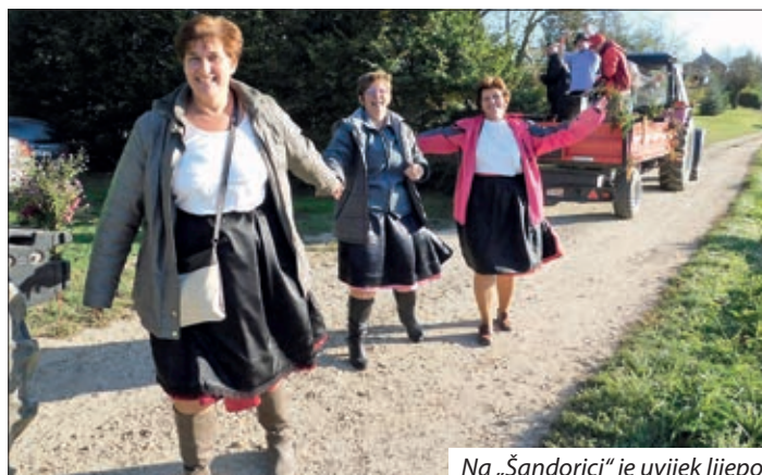
Na „Šandorici“ je uvijek lijepo.

gori kod vinograda pajdaša i skupa pobrali preostalo grožđe s loze i družili se.