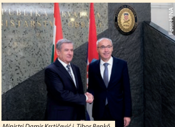
Ministri Damir Krstičević i Tibor Benkő

ZAGREB, 11. listopada 2018. (Hina) – Potpredsjednik vlade i ministar obrane Damir Krstičević sastao se u četvrtak u Zagrebu s mađarskim ministrom obrane Tiborom Benkőom s kojim je razgovarao o dvostranoj suradnji i mogućim pravcima njenog razvoja, nakon čega su zajedno posjetili zrakoplovnu bazu HRZ-a u Zemuniku gdje je upravo završena obuka mađarskih pilota, priopćeno je iz MORH-a.