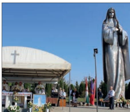
Santovačka Blažena Djevica Marija