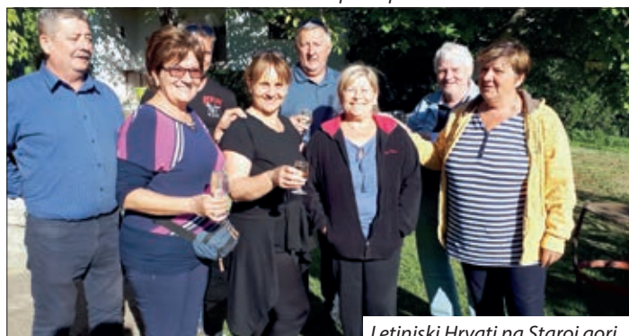
Letinjski Hrvati na Staroj gori

U Letinji 22. listopada, u okviru Berbenog festivala na tromeđi, održana je uobičajena povorka po gradu u kojoj su sudjelovale družine, kulturne skupine iz Hrvatske, Slovenije i Mađarske. Neki na konju, neki na ukrašenim konjskim zapregama, a neki na traktorima pjevali su hrvatske i mađarske popijevke uz harmoniku, kušajući usput mošt i vino. Svirači i plesači su pred Domom starih i nemoćnih prikazali kratak kulturni program, te na raznim križanjima, gdje su ih mještani čekali ukusnim pogačicama, kolačima i vinom. Na kraju povorke svi su se okupili na glavnom trgu pod šatorom. Sutradan su se okupili na Staroj