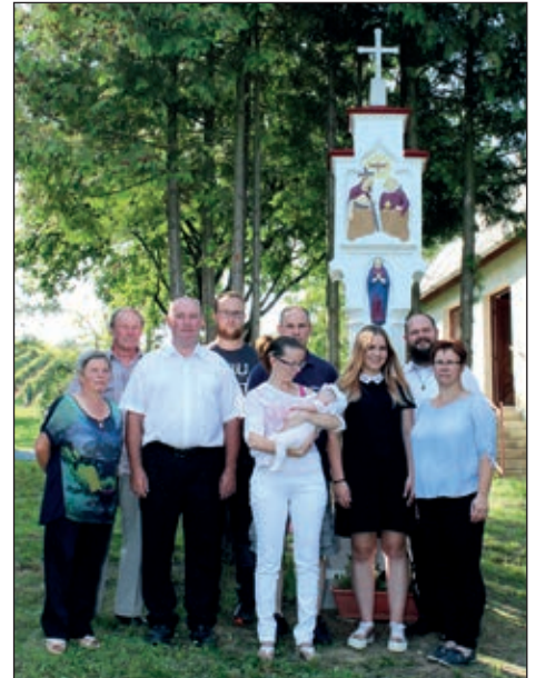
Familija Kovač s duhovnikom

knjigi. Kakov uzrok je služio za postavljanje spomenika, takaj se ne zna, jedino to da 5. majuša 1874. ljeta tadašnji keresteški farnik je blagoslovio spomenik Svetoga Trojstva. Duhovnik se je toga otpodneva zahvalio i obnoviteljem i pozdravio sve nazočne da ova mala svetačnost je ovako