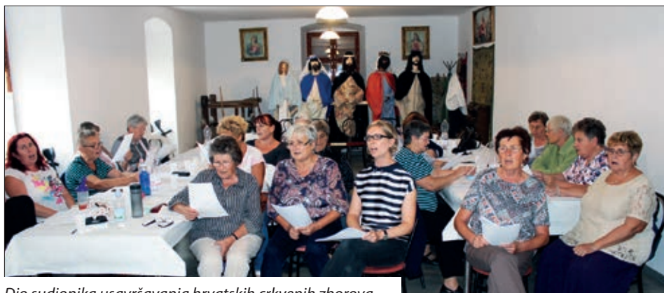
Dio sudionika usavršavanja hrvatskih crkvenih zborova.