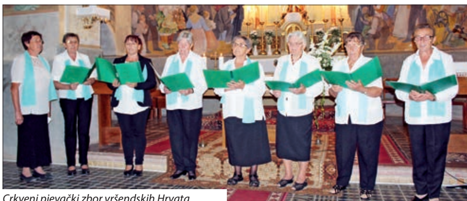
Crkveni pjevački zbor vršendskih Hrvata

gan i glasnogovornik Hrvata u Mađarskom parlamentu Jozo Solga. Popodne je priredbu posjetio i generalni konzul Republike Hrvatske u Pečuhu Drago Horvat koji je uz pozdravne riječi i zapjevao s članovima pjevačkih zborova pjesmu „Veseljaci smo mi“, a nakon zajedničkog ručka