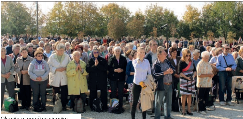
Okupilo se mnoštvo vjernika.