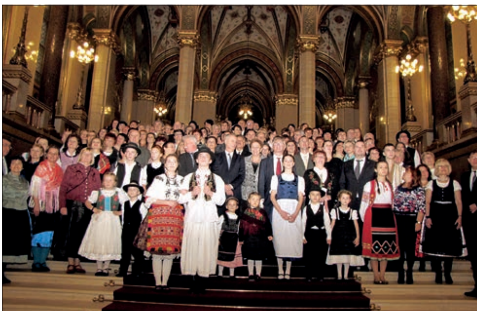
Dio dobitnika dodatne potpore u društvu državnoga tajnika Miklósa Soltésza