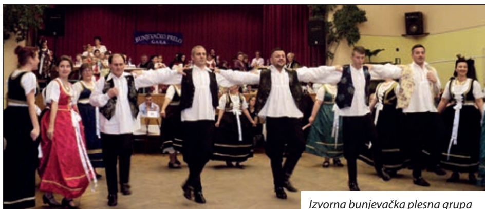
Izvorna bunjevačka plesna grupa

Hrvatska samouprava sela Gare 3. veljače priredila je najveću godišnju priredbu, Bunjevačko prelo, koje je već po tradiciji otvoreno, najpoznatijom preljskom pjesmom, bunjevačkom himnom „Kolo igra, tamburica svira“ u izvođenju mjesnoga tamburaškog Orkestra „Bačka“. Na pokladnoj zabavi u dupkom punom domu kulture okupilo se umalo tristo gostiju iz Gare i obližnjih bunjevačkih, ali i udaljenijih naselja. Tako su došli gosti iz Baje i okolnih naselja, pa i iz Kečkemetu. Kao i svake godine, pozivu su se odazvali i gosti iz Topolja, prijateljskog naselja u Hrvatskoj. Kako nam uz ostalo reče predsjednik Martin Kubatov, u prigodnome kulturnom programu predstavila su se četiri naraštaja garskih Hrvata Bunjevaca: vrtičari i učenici izveli su dječje bunjevačke igre i plesove, članovi omladinske skupine Bunjevačku svitu, a izvorna, odrasla skupina Momačko kolo. Učenice garske škole Viktorija i Boglarka Kettinger otpjevale su pjesmu Miroslava Škore Ne dirajte mi ravnicu. Posebna je točka programa bilo predstavljanje novosnimljenoga