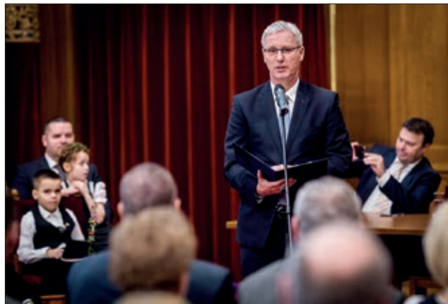
Državni tajnik Miklós Soltész

Državni tajnik Miklós Soltész u nazočnosti narodnosnih glasnogovornika i predstavnika dobitnika natječaja govorio je o tome da su od 2010. godine velike promjene bile u životu narodnosti, primjerice od 2014. godine trinaest autohtonih narodnosti ima pravo predložiti i delegirati svoga glasnogovornika u Mađarski parlament, u proteklih sedam godina utrostručio se iznos za podupiranje narodnosti. U proteklih sedam i pol godina gotovo se usedmostručio broj odgojno-obrazovnih ustanova u održavanju narodnosnih samouprava: dok ih je u 2010. bilo tek 12, danas ih ima već 82, a broj djece s prijašnje tri tisuće porastao je na 15 tisuća, izjavio je državni tajnik Soltész. Kako reče, narodnosti Mađarska vlada ne smatra „teretom“, nego u svakom pogledu računa i oslanja se na njih jer one jačaju i podupiru cjelokupno mađarstvo. Potom je svim dobitnicima pojed-