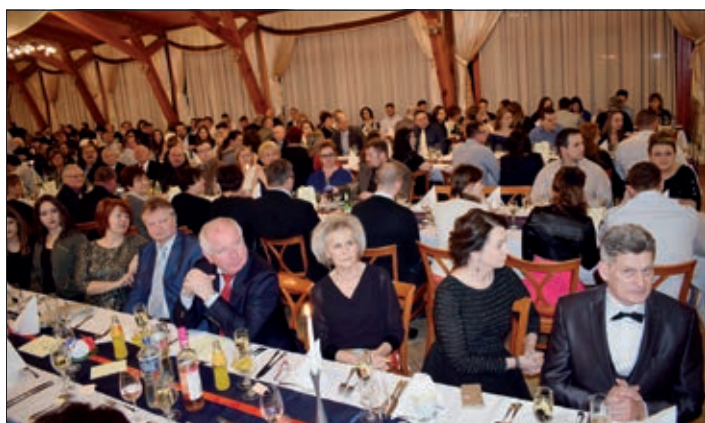
Umalo tristo sudionika