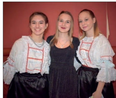
Pomurski hrvatski bal