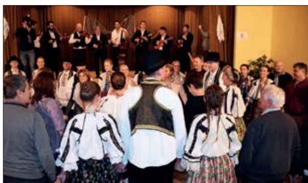
U zajedničkom kolu