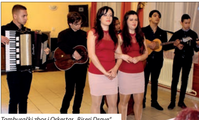
Tamburaški zbor i Orkestar „Biseri Drave“