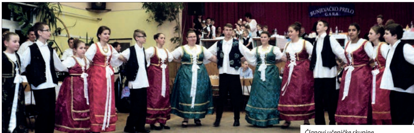
Članovi učeničke skupine

Hrvatska samouprava sela Gare 3. veljače priredila je najveću godišnju priredbu, Bunjevačko prelo, koje je već po tradiciji otvoreno, najpoznatijom preljskom pjesmom, bunjevačkom himnom „Kolo igra, tamburica svira“ u izvođenju mjesnoga tamburaškog Orkestra „Bačka“. Na pokladnoj zabavi u dupkom punom domu kulture okupilo se umalo tristo gostiju iz Gare i obližnjih bunjevačkih, ali i udaljenijih naselja. Tako su došli gosti iz Baje i okolnih naselja, pa i iz Kečkemetu. Kao i svake godine, pozivu su se odazvali i gosti iz Topolja, prijateljskog naselja u Hrvatskoj. Kako nam uz ostalo reče predsjednik Martin Kubatov, u prigodnome kulturnom programu predstavila su se četiri naraštaja garskih Hrvata Bunjevaca: vrtičari i učenici izveli su dječje bunjevačke igre i plesove, članovi omladinske skupine Bunjevačku svitu, a izvorna, odrasla skupina Momačko kolo. Učenice garske škole Viktorija i Boglarka Kettinger otpjevale su pjesmu Miroslava Škore Ne dirajte mi ravnicu. Posebna je točka programa bilo predstavljanje novosnimljenoga