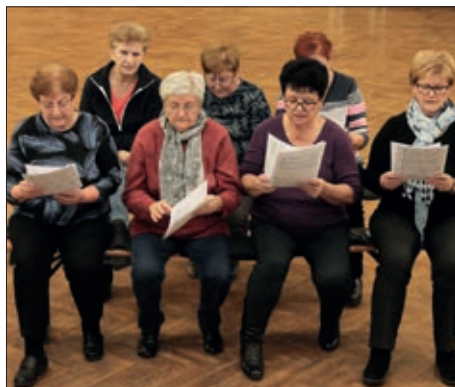
Hrvatska Kemlja danas, a sutra?